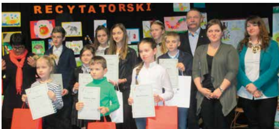
Laureaci konkursu pozowali do pamiątkowego zdjęcia po wręczeniu nagród.

przedstawić zarówno wiersz Jerzego Ludwika Kerna oraz wybrany fragment prozy Henryka Sienkiewicza. Wybór autorów nie był przypadkowy, w tym roku przypada 95. rocznica urodzin Jerzego Ludwika Kerna, a Sejm RP ogłosił bieżący rok Rokiem Henryka Sienkiewicza.