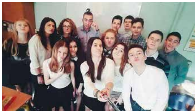
Dzięki wygranej młodzież pojedzie na wycieczkę w góry.