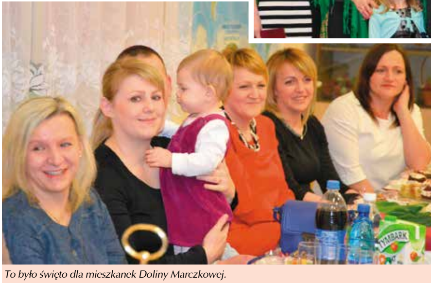
To było święto dla mieszkanki Doliny Marczakowej.