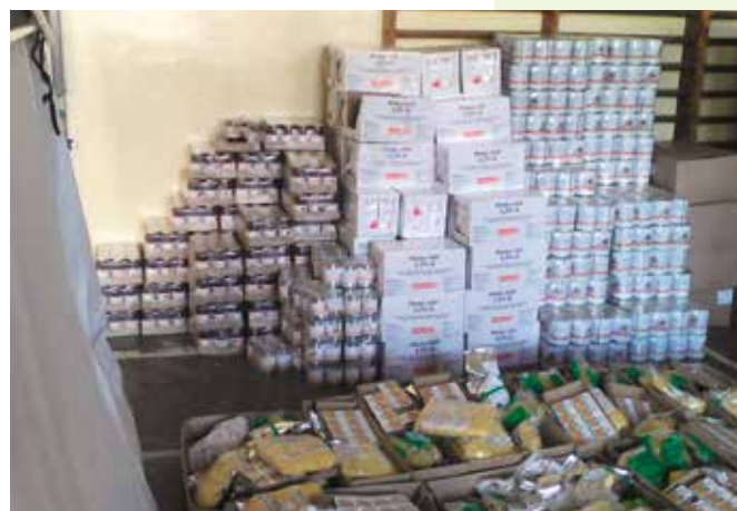
W paczkach znajdowały się m.in. konserwy, soki, makarony.

W wydawanie paczek zaangażowani byli członkowie Stowarzyszenia Rozwoju Wsi Mąchocice-Scholasteria i Ciekot wraz z pracownikami GOPS-u, Urzędu Gminy oraz strażakami Ochotniczej Straży Pożarnej w Masłowie. - W ramach współpracy z naszym ośrodkiem do pomocy przy obsłudze projektu zostały oddelegowane dwie osoby, które w ramach obowiązków służbowych dyżurowały przy wydawaniu żywności. Ponadto GOPS-Masłów pokrywał część kosztów transportu towaru i udzielał skierowań