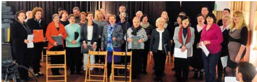
Chór Masłowianie swoją płytę nagrywał podczas kilku spotkań w Szklanym Domu.

W tym roku mija 95 lat od pierwszego koncertu Chóru Masłowianie. Z tej okazji nagrywana jest wyjątkowa płyta, która będzie prezentem dla wielbicieli talentów wokalistów na jubileusz.