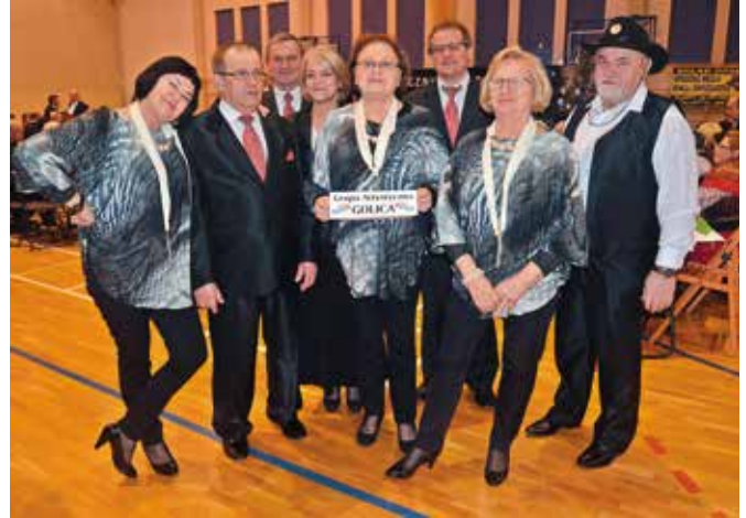
To już druga nagroda dla Golicy w tym roku.