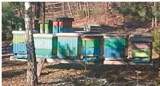
Pasieka prowadzona jest na ulach wielokorpusowych na tzw. niskiej ramie, dzięki czemu można zbierać miód z danej rośliny zanim zmiesza się z inną odmianą.

Kurier Masłowski: Miody z pana pasieki tak zasmakowały w Niemczech, że do Mąchocic Kapitulnych wrócił pan z ważną nagrodą.