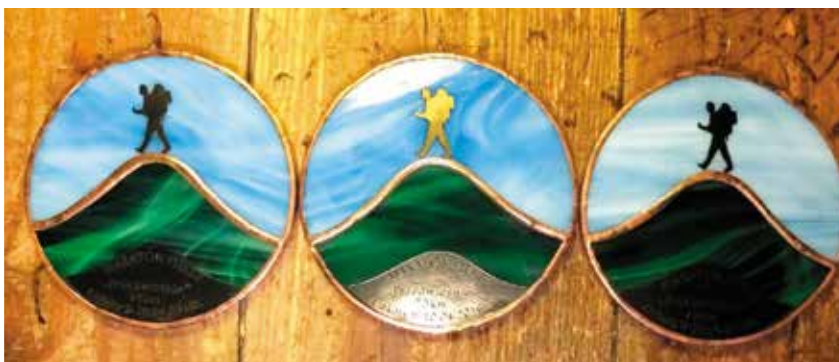
Tak prezentują się gotowe już medale.

Gotowe są już niezwykle medale, które trafią do każdego, kto przejdzie trasę o długości 75 km. Będzie ona wiodła po najpiękniejszych zakątkach Gór Świętokrzyskich. Piechurzy zdobędą m.in. Radostową, Wymysłoną, Łysicę, Święty Krzyż, Bukową Górę, Diabelski Kamień, Dąbrowkę czy Ameliówkę. Co ciekawe turyści przejdą również przez niedostępne na co dzień tereny Świętokrzyskiego Parku Narodowego.