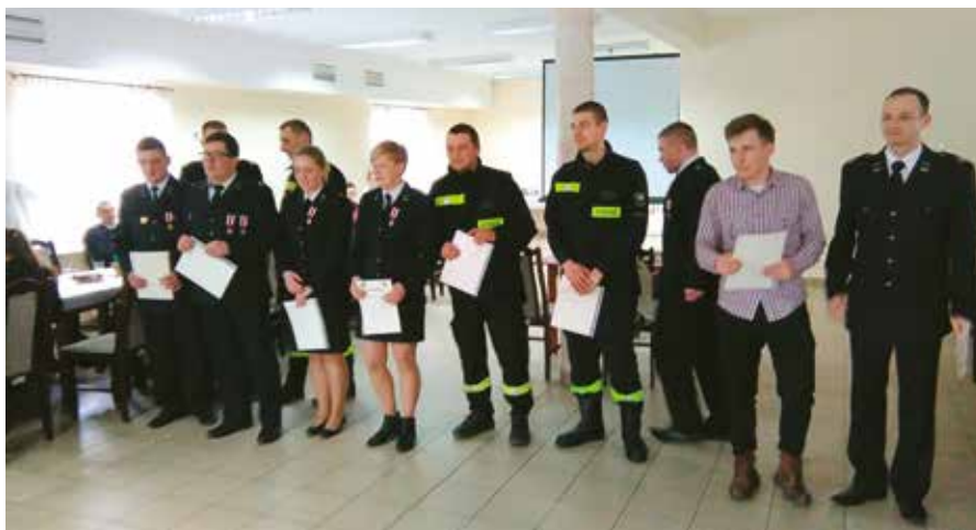
Podczas spotkania wręczono odznaczenia Brązowe Medale Za Zasługi dla Pożarnictwa oraz dyplomy dla druhów, dzięki którym jednostka wygrała defibrylator.