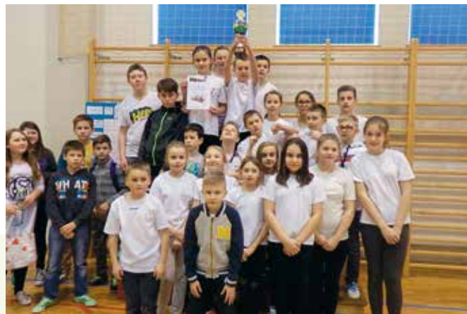
Tak ze zwycięstwa cieszyła się drużyna z Mąchocic- Scholasterii.