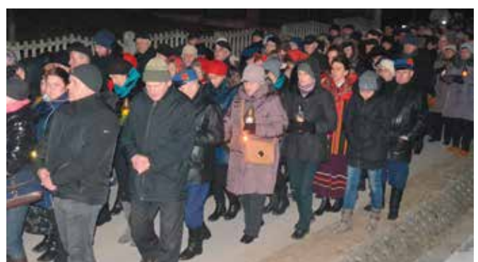
Wiele osób zabrało ze sobą lampiony.