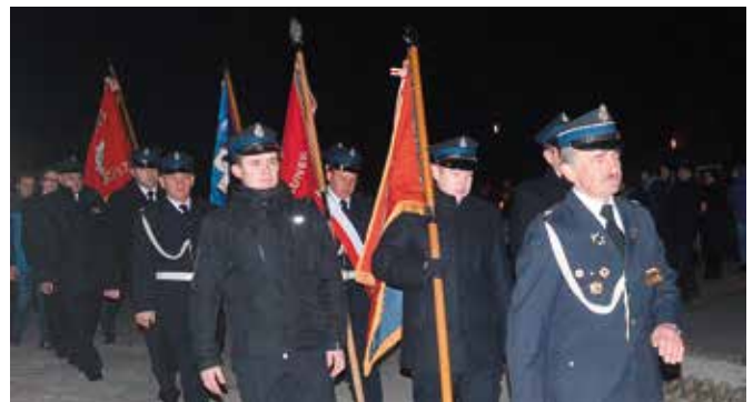
Na czele szli druhowie.