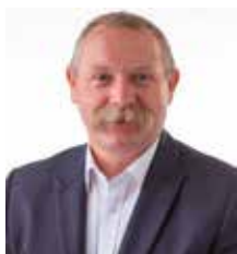
Szanowni Mieszkańcy Gminy Masłów,