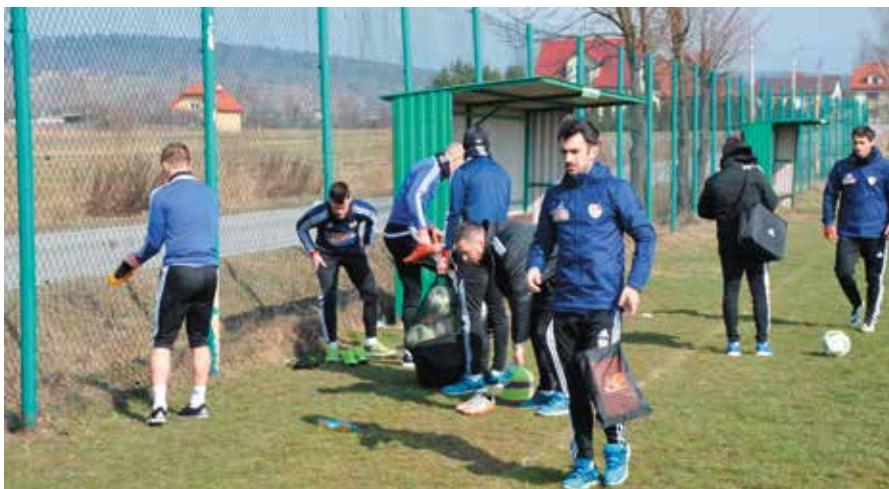
Drużyna Piasta Gliwice do meczu z Koroną przygotowywała się na boisku w Brzezinkach