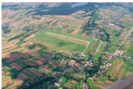
Na temat Studium będą mogli wypowiedzieć się mieszkańcy gminy Masłów

Już w styczniu tego roku gmina Masłów posiadała kompletną dokumentację gotową do wyłożenia do publicznego wglądu. Do tego jednak nie doszło, bo zmiana przepisów po raz kolejny opóźniła wdrożenie dokumentów planistycznych. W dniu 18 listopada 2015 r. weszła w życie ustawa z dnia 9 października 2015 r. o rewitalizacji, która wprowadziła istotne zmiany do ustawy z dnia 27 marca 2003 r. o planowaniu i zagospodarowaniu przestrzennym, w szczególności w zakresie wymogów jakie powinno zawierać Studium gmin. - W związku z tym, że ustawa o rewitalizacji