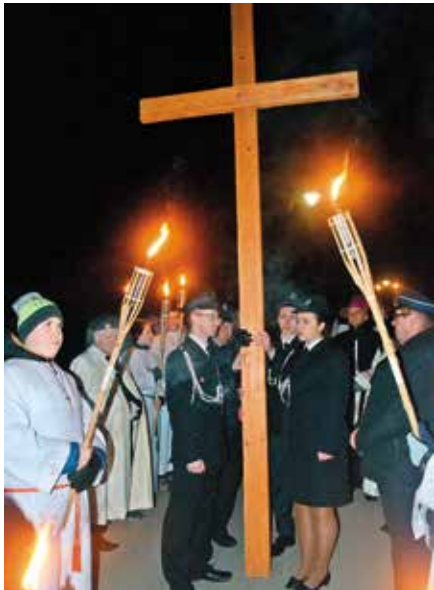
Wielki krzyż od stacji do stacji niesiony był przez wybranych reprezentantów poszczególnych grup działających na terenie gminy.

W piątek poprzedzający Wielki Tydzień droga krzyżowa przeszła ulicami Masłowa. W jej organizację i przygotowanie zaangażowanych było wielu mieszkańców gminy.