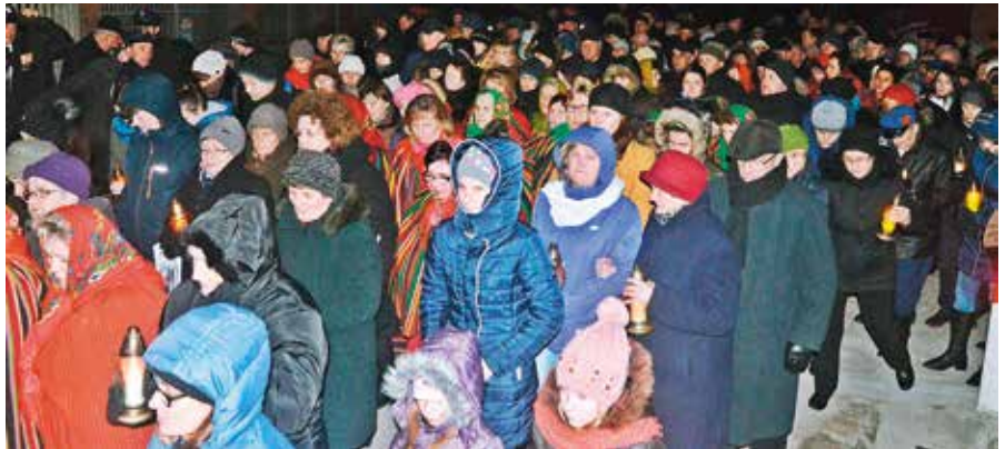
W nabożeństwie wzięło udział mnóstwo mieszkańców gminy Masłów.