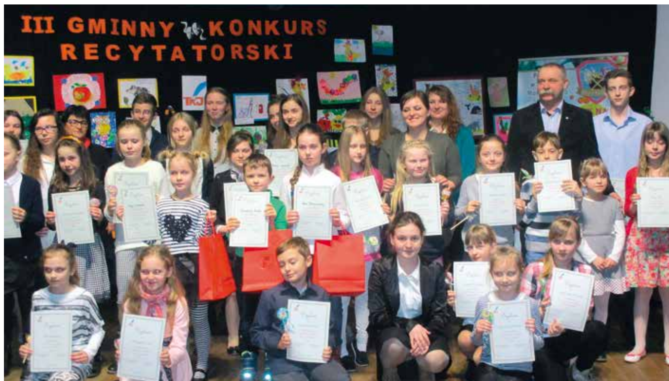
W III Gminnym Konkursie Recytatorskim zmierzyło się ponad 30 osób.