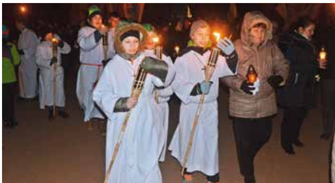
Ministranci dzielnie radzili sobie z utrzymaniem ognia w pochodniach.