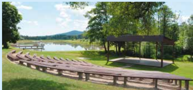
WP Impreza odbędzie się w plenerze.

Choć to impreza szkolna organizowana przez Szkołę Podstawową w Brzezinkach, to wychodzi poza mury, by zachęcić do wspólnej zabawy całe rodziny i znajomych występujących uczniów. W amfiteatrze przed publicznością oraz jurorami wystąpią najlepsi wykonawcy ze wszystkich szkół na terenie gminy Masłów zarówno z podstawówek jak i gimnazjów. Co ważne wykonawcy zaśpiewają piosenki turystyczne i krajoznawcze. Zgłoszenia reprezentacji szkolnych przyjmowane są do końca kwietnia pod adresem: brzezinki@gmail.com, szczegóły oraz regulamin znajdują się na stronie www.brzezinki.superszkolna.pl . Międzyszkolny Konkurs Piosenki Turystycznej odbędzie się po raz pierwszy.