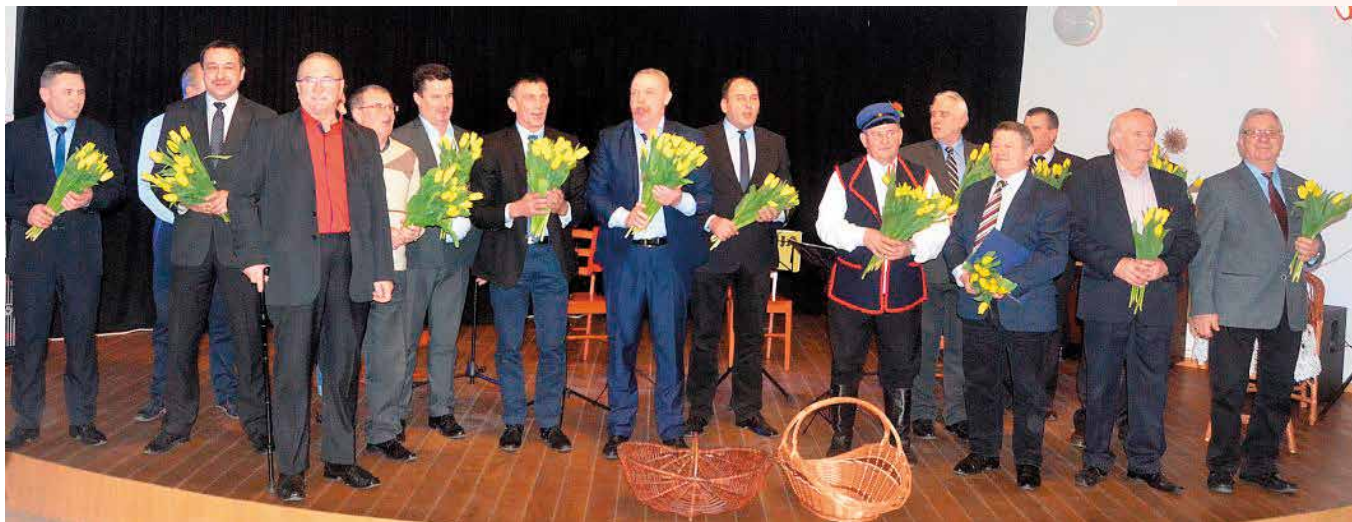
Męski chór odśpiewał „100 lat” wszystkim paniom.