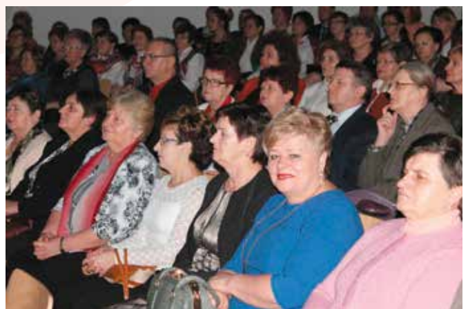
Na widowni przeważały panie, którym dopisywały świetne humory.