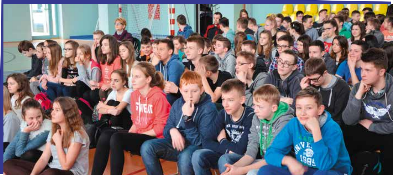
W debacie w hali sportowej w Masłowie udział wzięli m.in. gimnazjaliści.