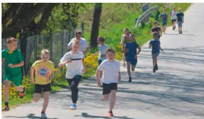
Bieg na Żeromszczyźnie to już tradycja gminy Masłów.