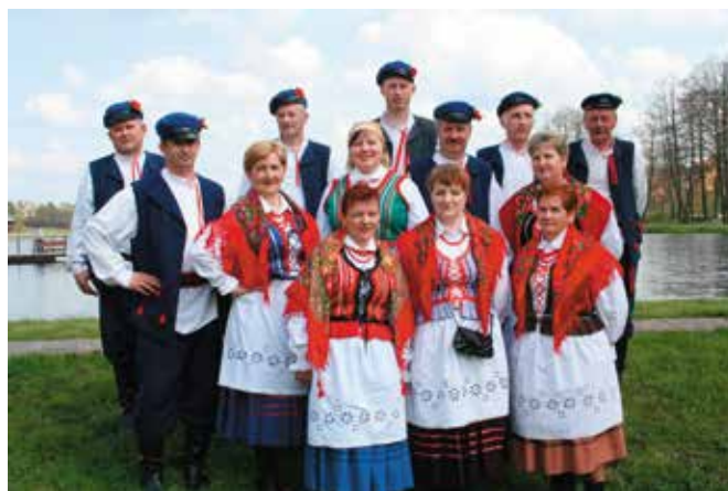
Zespół Pieśni i Tańca Ciekoty cieszył się z werdyktu.

Przed jurorami oraz publicznością zaprezentowało się 56 podmiotów wykonawczych. Ostatecznie do finału w Busku Zdroju zakwalifikowano 23. Nie zabrakło tam reprezentantów gminy Masłów: Zespołu Pieśni i Tańca Ciekoty oraz Zespołu Śpiewaczego