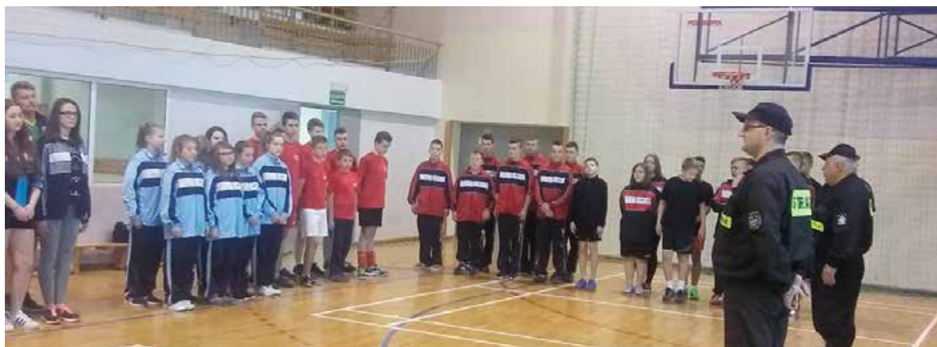
Inauguracja spotkań miała miejsce w Mąchocicach - Scholasterii.