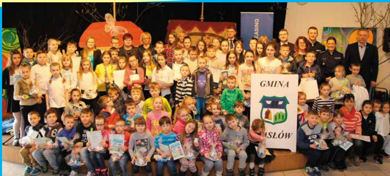
W konkursie udział wzięło mnóstwo młodych mieszkańców gminy Masłów.