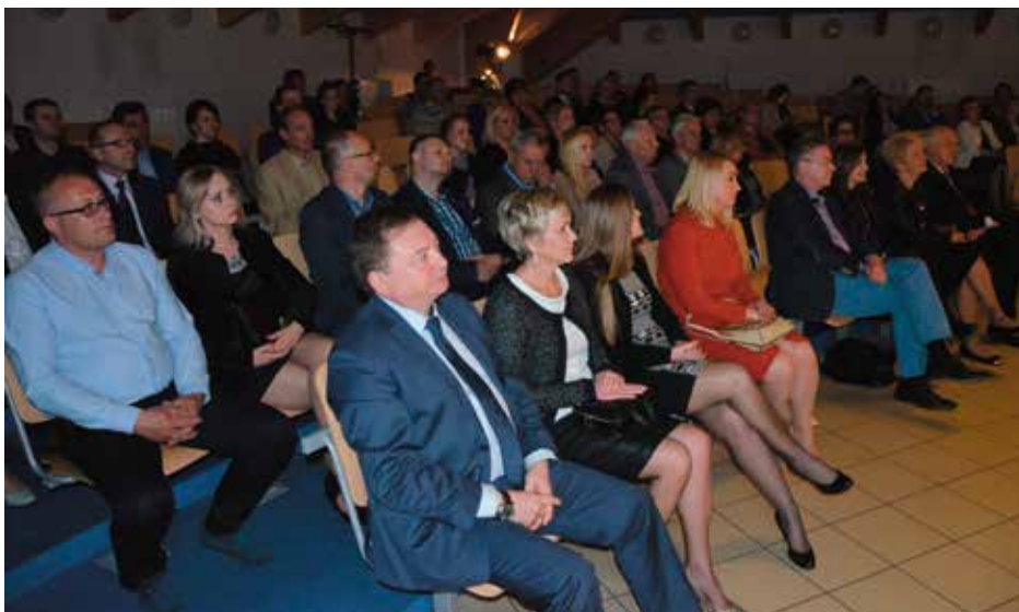
Na galę przybyło mnóstwo przedsiębiorców z naszej gminy