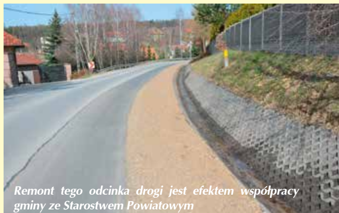
Remont tego odcinka drogi jest efektem współpracy gminy ze Starostwem Powiatowym