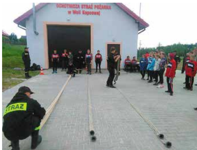
W Woli Kopcowej rywalizowano m.in. w zwiżaniu weży na czas.