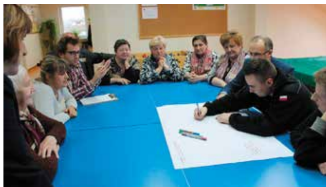
Podczas spotkań mieszkańcy gminy tworzyli specjalne mapy.

W ramach tego projektu Gminny Ośrodek Kultury i Sportu wraz ze wszystkimi swoimi placówkami (Szklanym Domem i świetlicami samorządowym) zaprosił w kwietniu mieszkańców gminy na 4 spotkania w 4 różnych miejscowościach (Ciekotach, Woli