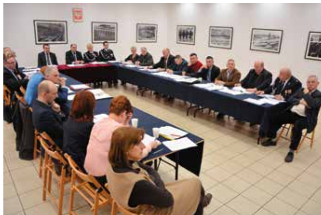
Radni obradowali w Szklanym Domu w Ciekotach.

W projekcie uchwały dotyczącej zmiany uchwały budżetowej radni przyjęli środki pochodzące z nadwyżki budżetowej. Zadsponowali nowe środki z 2015 roku na realizację kilku za-