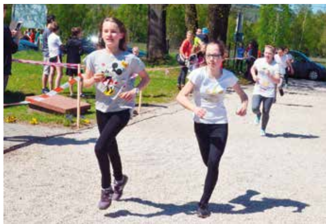
Finisz był szczególnie emocjonujący.