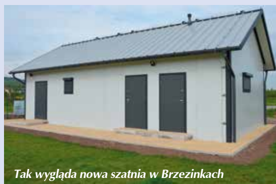
Tak wygląda nowa szatnia w Brzezinkach

To finał prac przy budowie szatni dla zawodników MSS Klonówka Masłów