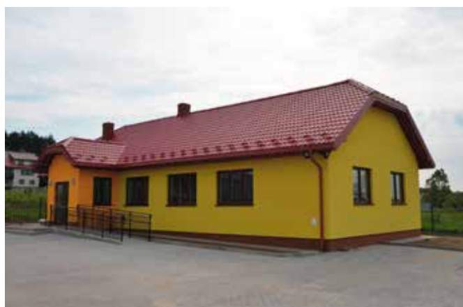
Tak prezentował się budynek w trakcie prac i na ich finiszu.