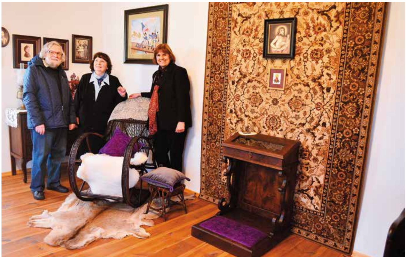
Pokój matki to miejsce, które bardzo podoba się odwiedzającym Ciekoty. Znajduje się w nim m.in. klęcznik, na którym modliła się prababka pisarza.