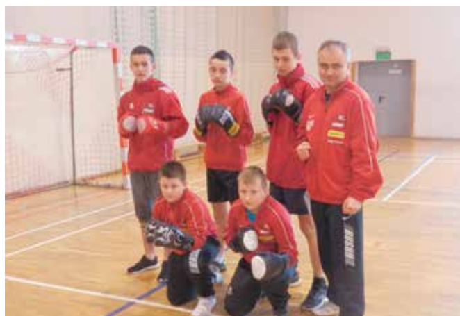
Zawodnicy i trenerzy zapraszają wszystkich miłośników boks na treningi