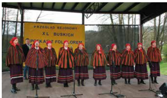
Masłów Drugi Nove wyśpiewał nominację do występu w Busku.

Masłów II Nove. Pięknie zaprezentowały się również Kopcowianki, Dąbrowianki, Barczanki. Ich występy były bardzo udane i komisja miała niezły ból głowy przy wyborze finalistów. Impreza nie zakończyła się jednak po ogłoszeniu werdyktu. Jeszcze długo później członkowie zespołów ludowych biesiadowali na trawnikach i zachęcali do wspólnej tanecznej zabawy gości, którzy tego dnia odwiedzili Ciekoty. O małą gastronomię zadbały Brzeziniarki, które serwowały pyszny żurek i kielbaskę. Na imprezę zaprosił wójt gminy Masłów wraz z dyrektorem Gminnego Ośrodka Kultury i Sportu w Masłowie, dyrektorem Wojewódzkiego Domu Kultury w Kielcach.