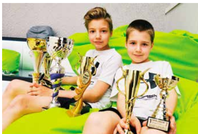
Dumą są puchary, które przywożą z zawodów.