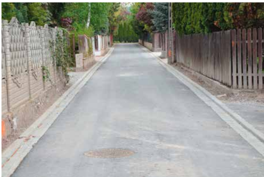
Ul. Żeromskiego w Woli Kopcowej przed i po remoncie.