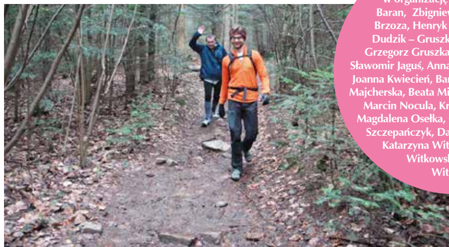
Do przejścia w deszczowych warunkach było 75 km.