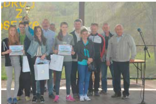
Do najlepszych powędrowały puchary, dyplomy i nagrody.

Wiosenne bieganie już na stałe weszło w kalendarz imprez gminy Masłów. Na Żeromszczyźnie pojawiło się mnóstwo osób, które chciały zmierzyć się w biegach na czas. Długość trasy była uzależniona od wieku zawodników. W sześciu kategoriach biegowych wzięło udział 212 zawodników z przedszkoli, podstawówek i gimnazjów z terenu gminy Masłów oraz 10 zawodników w kategorii dorośli. Pogoda okazała się bardzo łaskawa dla biegaczy. Wiatr wiejący od ciekockiego zalewu skutecznie chłodził uczestników imprezy. Na trasie na wszystkich czekali kibice, który głośno dopingowali szczególnie najmłodszych biegaczy.