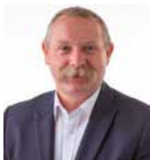
Szanowni Mieszkańcy Gminy Masłów,