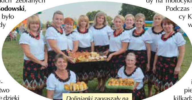
Dolinianki zapraszały na swoje domowe wypieki.