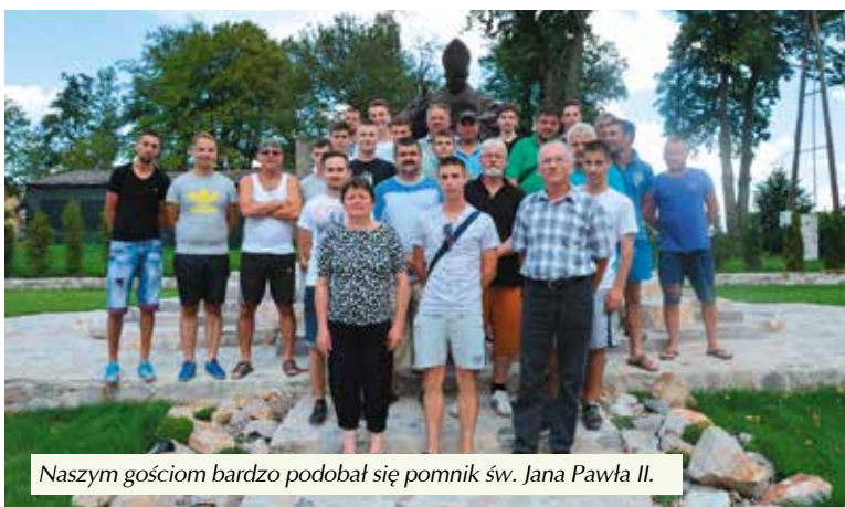
Naszym gościom bardzo podobał się pomnik św. Jana Pawła II.

Góra i Börcs FC stoczyli bardzo wyrównany pojedynek, który zakończył się wynikiem 3-1 dla drużyny z Węgier. Międzynarodową rywalizację obserwowało wielu mieszkańców gminy, którzy chcieli poznać sportowe umiejętności Węgrów i dopingować obie drużyny. Po spotkaniu na murawie goście czekał relaks na basenie w Hotelu Przedwiośnie. Wieczorem zarówno goście jak i mieszkańcy gminy spotkali się na wspólnej zabawie pod gwiazdami.