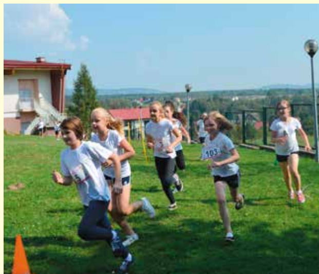
Dzieci dzielnie biegły do mety dopingowane przez nauczycieli.