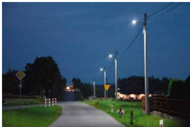
Różnica widoczna jest gołym okiem.