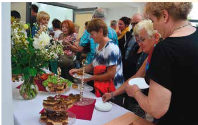
Jak przysłało na imieniny na gości czekała pyszna stefanka.