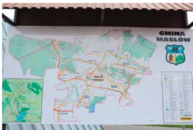
Tablice przed i po