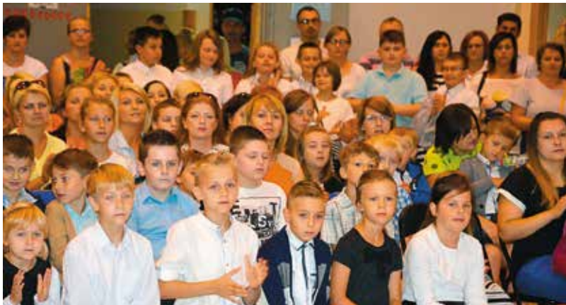
Wypoczęte dzieciaki wróciły z wakacji do szkoły w Mąchociach - Scholasterii.

W roku szkolnym 2016/2017 w szkołach gminy Masłów naukę rozpoczęło 269 dzieci w oddziałach przedszkolnych, 570 uczniów w szkołach podstawowych, 208 w gimnazjach. Do pierwszej klasy podstawówek poszło 137 osób, a w gimnazjum 70 osób. W czasie wakacji szkoły zostały przygotowane do przyjęcia uczniów dzięki niezbędnym pracom remontowym.