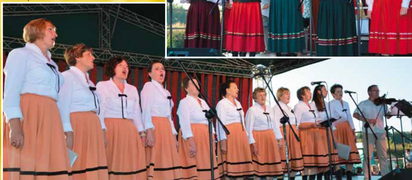
Masłów Drugi NOVE