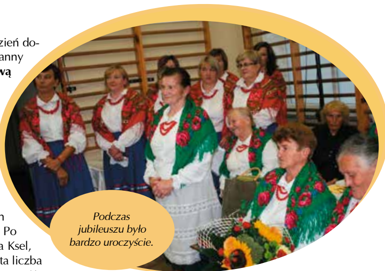
Podczas jubileuszu było bardzo uroczyście.