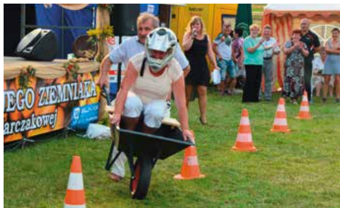
Wiele emocji towarzyszyło nietypowemu slalomowi...w taczach.