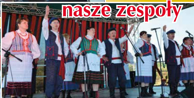
Zespół Piesni i Tańca Ciekoty