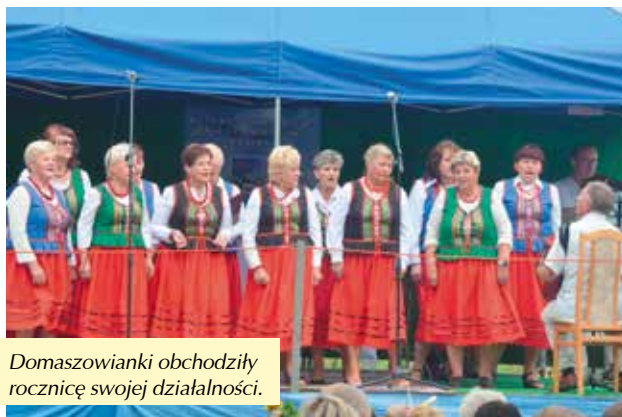
Domaszowianki obchodziły rocznicę swojej działalności.