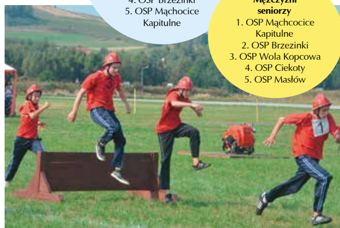
Druhowie podczas zawodów dawali z siebie wszystko.