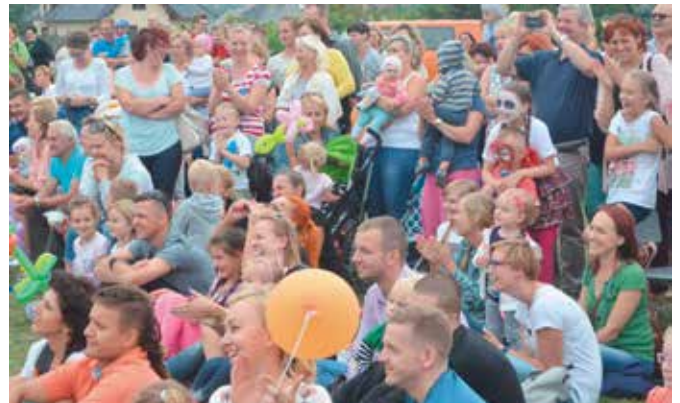
Publiczność nagradzała artystów wielkimi brawami.