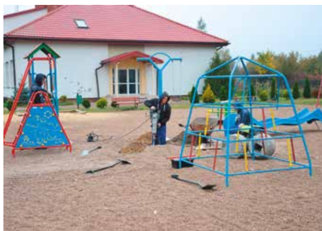
Nowe urządzenia montowano m.in. w Woli Kopcowej.