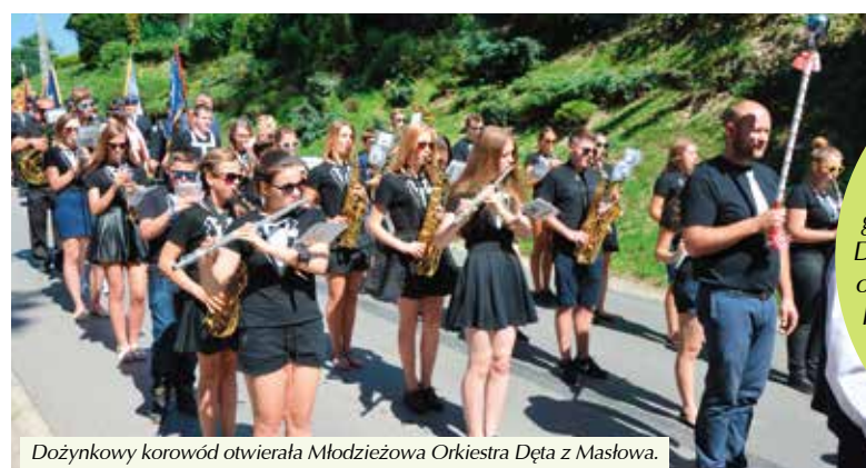
Dożynkowy korowód otwierała Młodzieżowa Orkiestra Dęta z Masłowa.