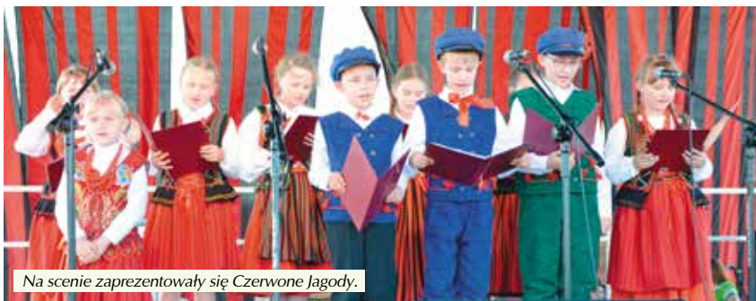
Na scenie zaprezentowały się Czerwone Jagody.