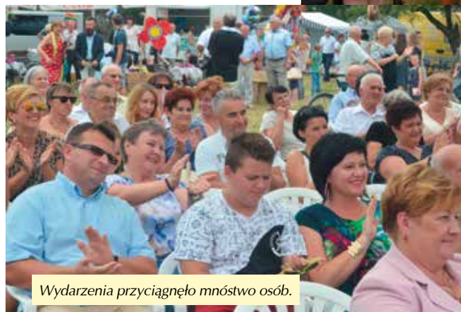
Wydarzenia przyciągnęło mnóstwo osób.