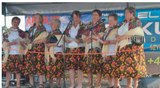
Dolinianki - seniorki zaprezentowały m.in. dowcipne przyśpiewki.