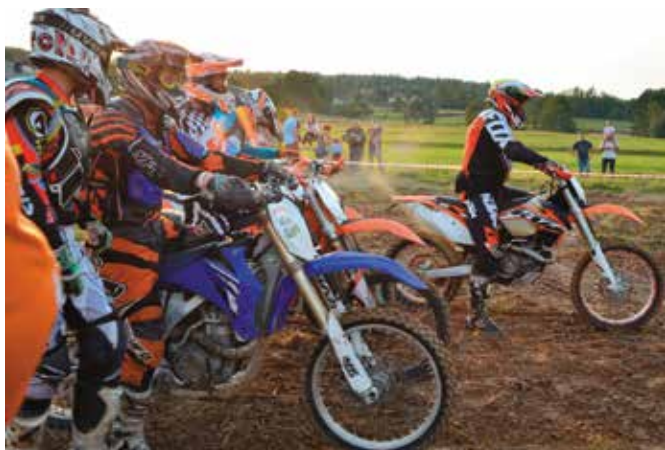
Najbardziej widowiskowa była prezentacja motocykli.