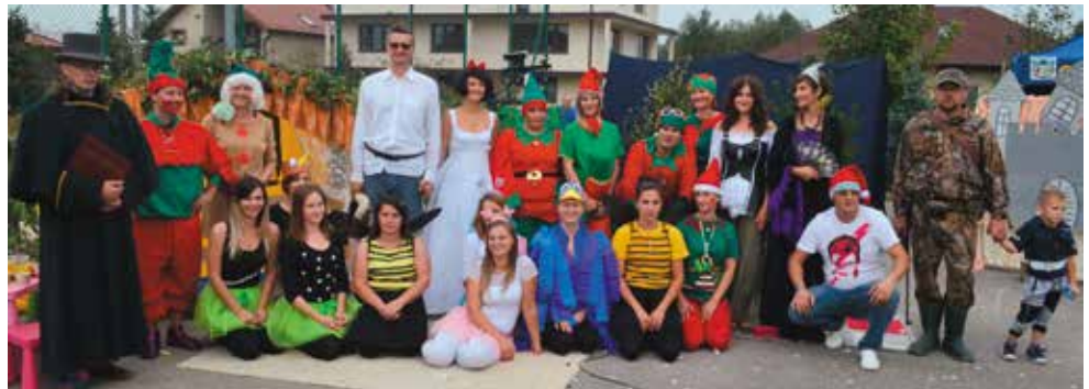
Na ogromne brawa założyli rodzice przedszkolaków, którzy zaprezentowali przedstawienie "Królowa Śnieżka".