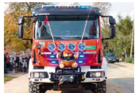
Już w przyszłym roku podobny wóz będą posiadali druhowie z Masłowa.