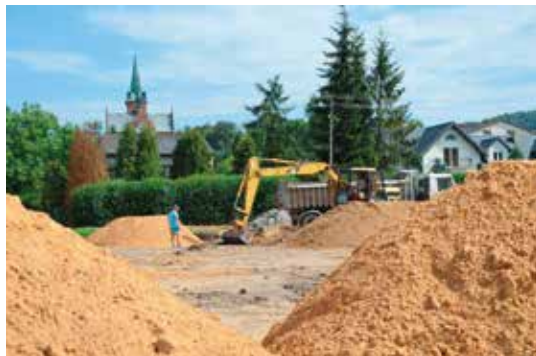
W tym miejscu powstaje boisko.

Jest to kolejny etap prac związanych z rewitalizacją centrum gminy. Do tej pory brakowało w Masłowie boiska z prawdziwego zdarzenia. Mieszkańcy z sentymentem wspominają stare boisko mieszczące się naprzeciwko Urzędu Gminy, które co weekend przyciągało mieszkańców wszystkich sołectw, którzy grali i dopingowali swoje drużyny w meczach Ligi Gminnej w piłce nożnej. Z boiska będą mogli korzystać zarówno uczniowie Zespołu Szkół im. Jana Pawła II w Masłowie oraz wszyscy chętni mieszkańcy naszej gminy. Budowa boiska zakończy się w przyszłym roku.