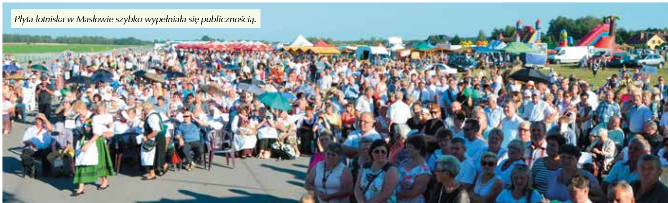
Płyta lotniska w Masłowie szybko wypełniła się publicznością.