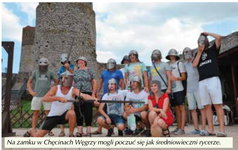
Na zamku w Chęcinach Węgrzy mogli poczuć się jak średniowieczni rycerze.