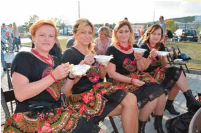
Na stołach królowały dania z grilla, ale można było też zjeść gulasz z dzika którym zachwycali się Barczanki.