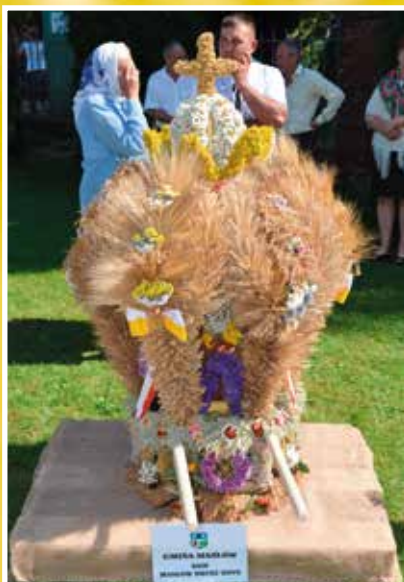
KGW Masłów Drugi NOVE