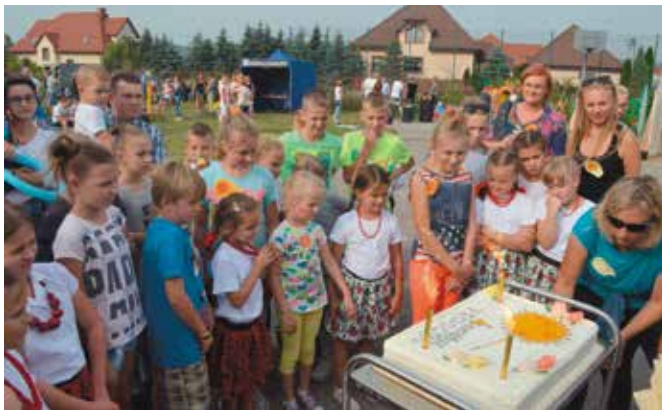
Dzieci ustawily się w kolejce po kawałek urodzinowego tortu "Promyczka".