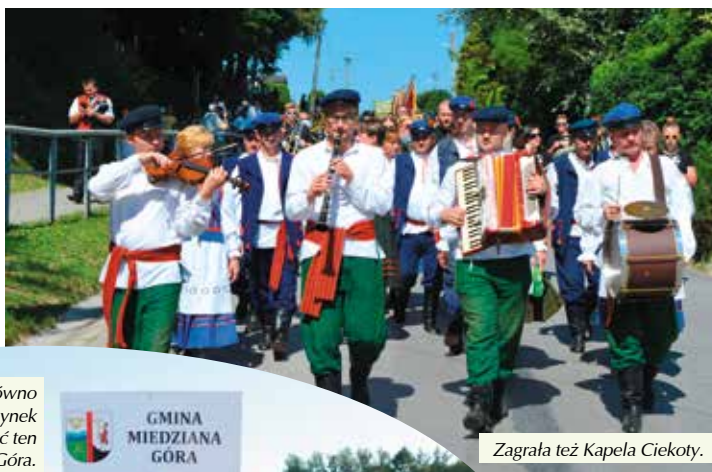
Zagrała też Kapela Ciekoty.

za szczególne osiągnięcia sportowe oraz godne reprezentowanie gminy Masłów.