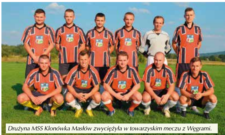
Drużyna MSS Klonówka Masłów zwyciężyła w towarzyskim meczu z Węgrami.

Kolejny dzień upłynął naszym gościom na zwiedzaniu najciekawszych miejsc w Kielcach. Wieczorem na boisku w Brzezinkach ponownie rozegrano mecz. Tym razem przeciwnikiem ekipy z Węgier była drużyna z Miedzianej Góry. Wicher Miedziana