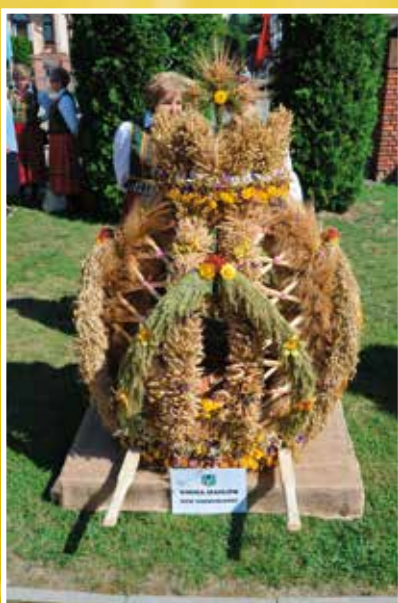
Wieniec KGW Dąbrowianki