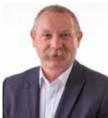
Szanowni Mieszkańcy Gminy Masłów,

Za nami zebrania we wszystkich sołectwach naszej gminy. To właśnie podczas ich trwania zapadały decyzje dotyczące inwestycji, które będą realizowane z pieniędzy w ramach funduszu sołeckiego w 2017 roku. W każdym sołectwie wybierano propozycje ważne i potrzebne dla danej społeczności. Powstaną np. trzy nowe siłownie na wolnym powietrzu, strażacy ochotnicy zyskają nowy sprzęt, a zespoły stroje. O tym, jak bardzo potrzebny jest w naszej gminie fundusz sołecki niech świadczą choćby uśmiechy dzieci, które korzystają z placów zabaw doposażonych w ostatnich tygodniach właśnie z ubiegłorocznego funduszu. Na ukończeniu są prace przy opracowaniu Programu Rewitalizacji, który jest podstawą do wystartowania inwestycji w centrum Masłowa Pierwszego. Duży udział w tym mieli mieszkańcy biorący udział w konsultacjach społecznych. To jednak nie jedyna inicjatywa oddana w ręce mieszkańców naszej Gminy Masłów. Jesteśmy w trakcie realizacji projektu "Kulturalnie poruszeni". To właśnie mieszkańcy sami mogli zgłaszać propozycje wydarzeń w swoich sołectwach, o organizację których zabiegali pisząc projekty. Najlepsze z nich są realizowane przy pomocy Gminnego Ośrodka Kultury i Sportu. Świadczy to o wielkim potencjale, jaki posiadają mieszkańcy naszej gminy. Serdecznie zapraszam do udziału w finałach kolejnych inicjatyw w październiku i listopadzie, których szczegóły znajdziecie Państwo w tym wydaniu Kuriera Masłowskiego.