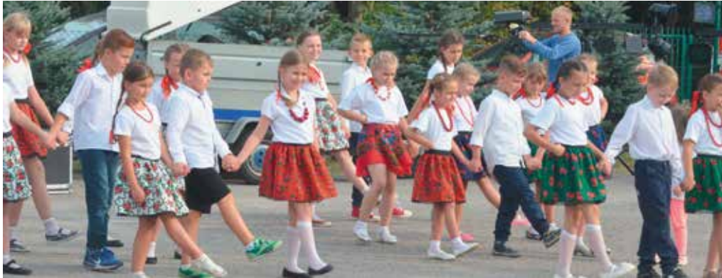
Młodzi mieszkańcy Woli Kopcowej towarzyszyli Kopcowiankom w czasie obrzędu dożynkowego.