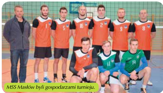
MSS Masłów byli gospodarzami turnieju.