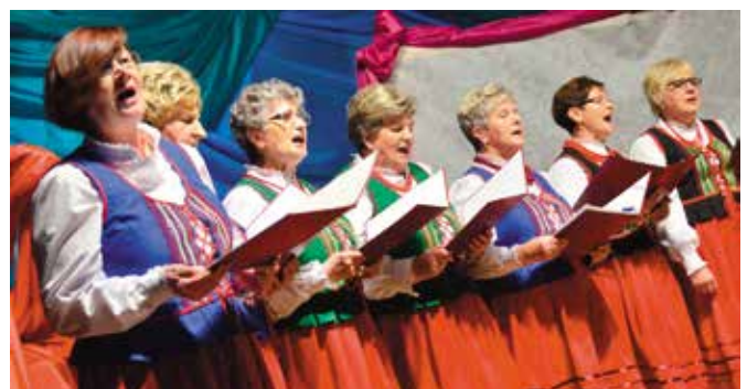
Dla wszystkich wystąpiły Domaszowianki.