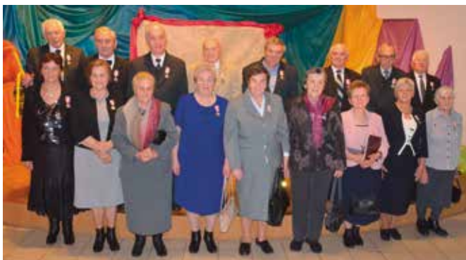
Pamiątkowe zdjęcie jubilatów obchodzących Złote Gody.