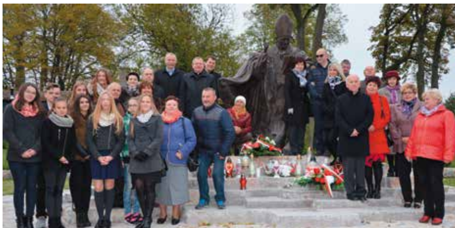
Delegacje mieszkańców spotkały się przed pomnikiem św. Jana Pawła II.