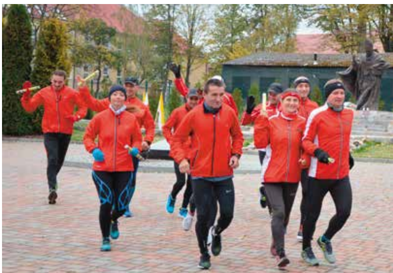
Z Rudy Śląskiej przybiegli do Masłowa.