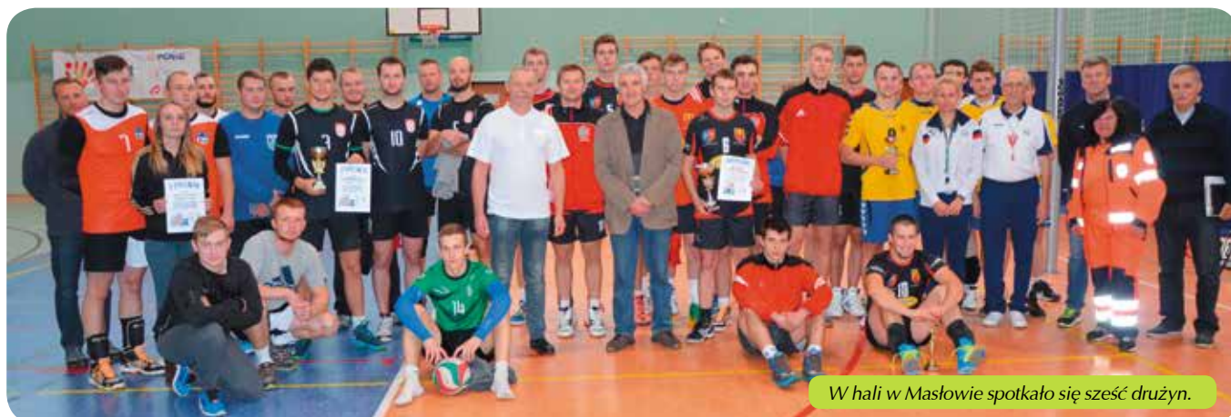
W hali w Masłowie spotkało się sześć drużyn.