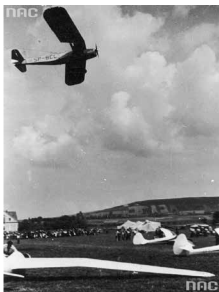
Zdjęcie z historyczną wartością z Narodowego Archiwum Cyfrowego.

Przyszedł czas wojennej zawieruchy. Już 2 września o godzinie 17 lotnisko w Małowie zostało zbombardowane. Samoloty bombowe zbombardowały płytę lotniska. Bombardowania dokonało aż 21 samolotów He-111. Zginęło także dwoje mieszkańców Małowa. 3 września dokonano kolejnego nalotu, tym razem zapalając z broni pokładowej stogi siana w