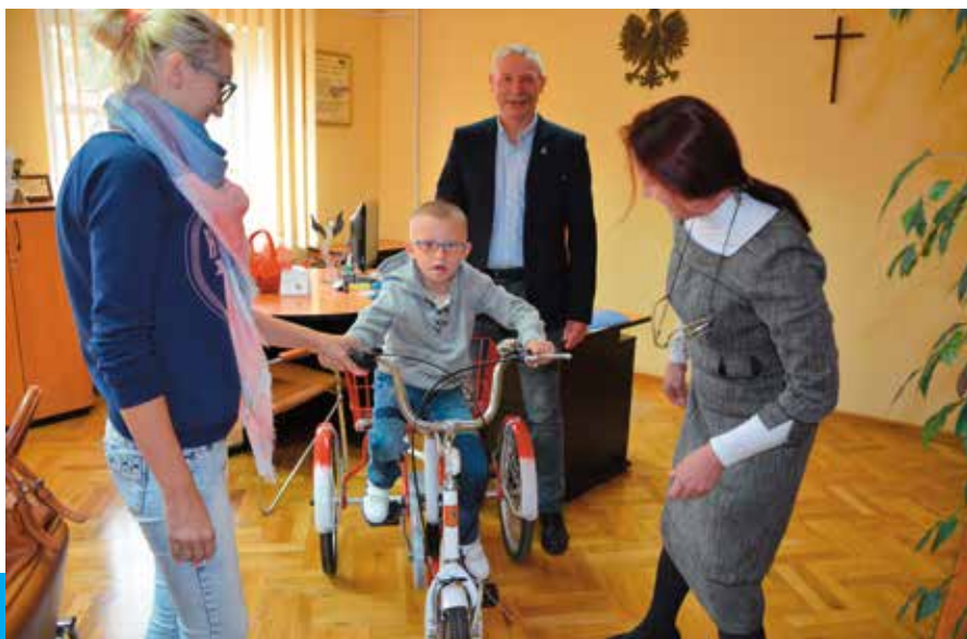
Kacperek otrzymał prezent w gabinecie wójta.