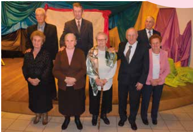
Pary obchodzące Diamentowe Gody.