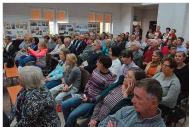
Świetlica zappełniła się do ostatniego miejsca.