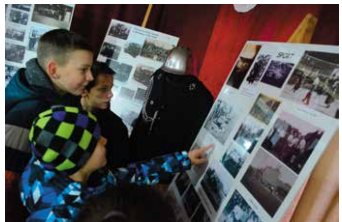
Młodzi mieszkańcy Wiśniówki z zainteresowaniem przyglądali się archiwalnym zdjęciom.