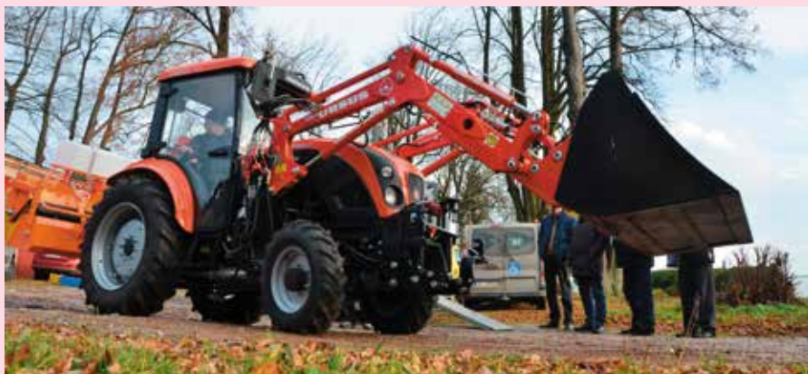
Tak prezentuje się nasz nowy nabytek

Oszczędności i duże ułatwienia w kwestii bieżącego utrzymania dróg w gminie to plusy wynikające z zakupu nowego ciągnika, który właśnie stał się własnością Urzędu Gminy w Masłowie.