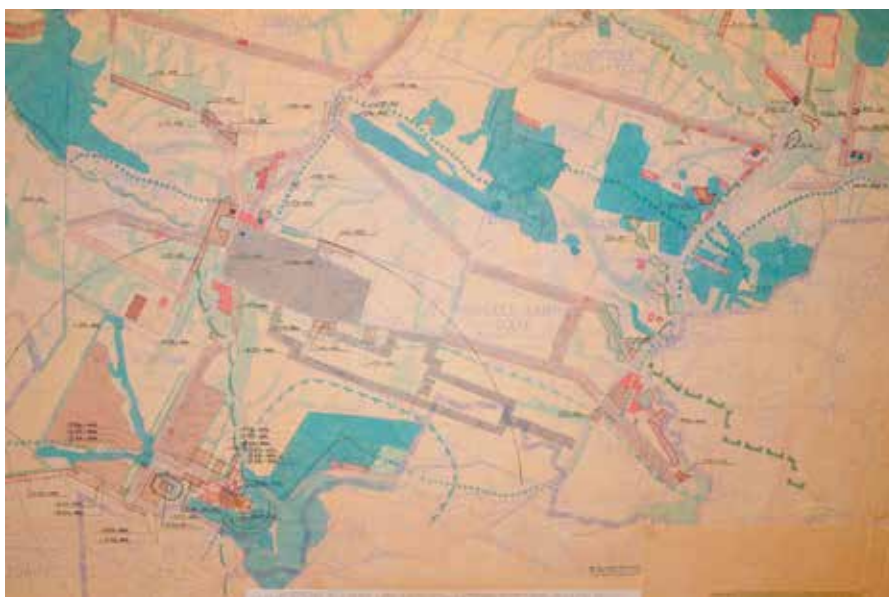
Fragment planu zagospodarowania przestrzennego, z planowaną rozbudową lotniska pasażerskiego.

Władze Polski międzywojennej odbudowując gospodarkę narodową zdawały sobie sprawę z potrzeby rozwoju lotnictwa. Szkolono pilotów dla sił zbrojnych, na potrzeby lotnictwa cywilnego (1929 powstanie PLL „LOT”). Powstała Liga Obrony Powietrznej i Przeciwgazowej (1923r), organizacja której zadaniem było między innymi przygotowanie obywateli do obrony przeciwlotniczej oraz szkolenia pilotów dla potrzeb lotnictwa cywilnego i wojskowego. Organizacja tworzyła sieć lotnisk, które obecnie moglibyśmy nazwać lotniskami sportowymi. Pierwsza na Kielecczyźnie taka placówka to lotnisko Pińczów-Polichno i powstała przy nim szkoła szybowco-