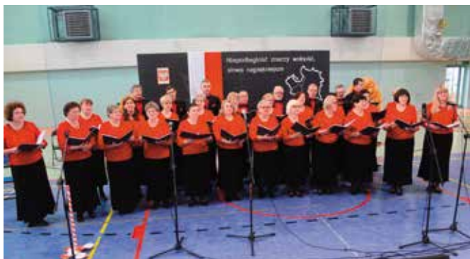
Chór Masłowanie zaprosił do wspólnego śpiewania pieśni patriotycznych.