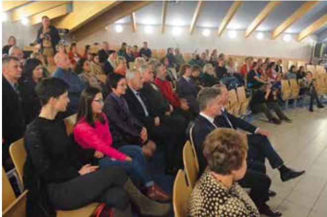
Publiczność serdecznie przyjęła wyjątkową premierę.