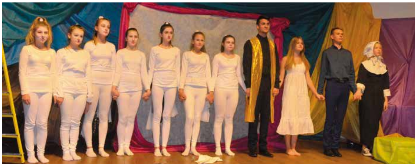
Młodzi aktorzy zaprezentowali swoją wersję „Romea i Julii”.