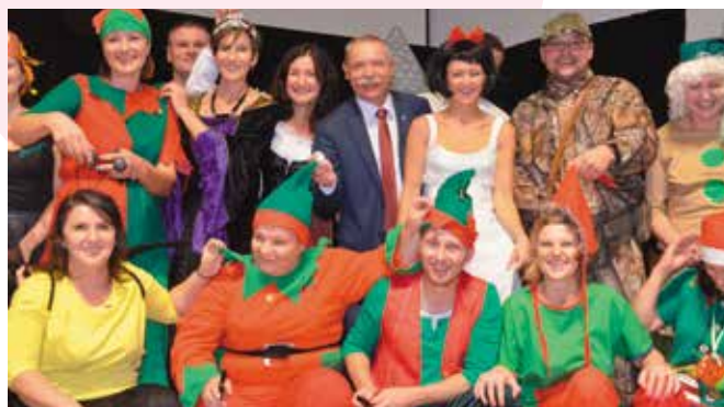
Humory dopisywały krasnoludkom czyli rodzicom przedszkolaków z oddziałów przedszkolnych Szkoły Podstawowej w Woli Kopcowej, którzy za prezentowali przedstawienie o Królowie Śnieżce.