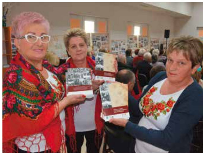
Wystawie towarzyszyła prezentacja okolicznościowego folderu.