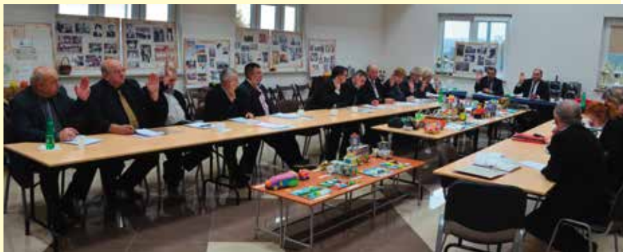
Obrady odbyły się w nowej świetlicy samorządowej w Dąbrowie.

Przyjęcie przez radnych Programu Rewitalizacji Gminy Masłów 2016 - 2023 było najważniejszym punktem sesji Rady Gminy, która odbyła się w świetlicy samorządowej w Dąbrowie.