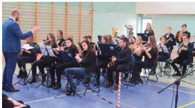
Pięknie zagrała Młodzieżowa Orkiestra Dęta z Masłowa.

nata Szwaczka. Obchody zakończyło widowiskowe odtarcie poloneza. Szczególną uwagę zwracały kolorowe suknie dziewczyn.