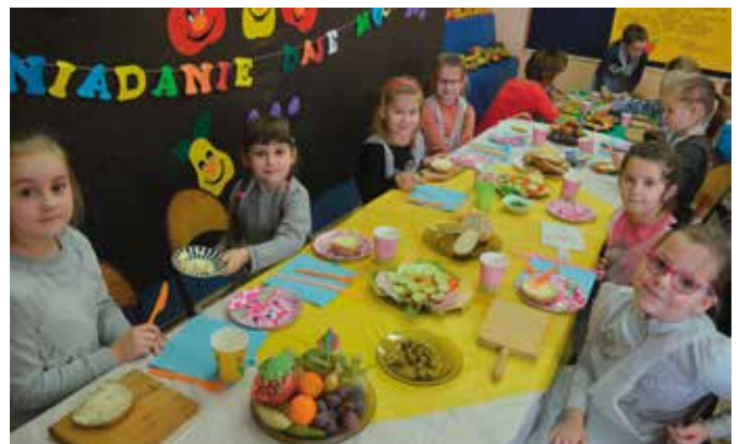
Akcja ma zwrócić uwagę dzieci na ważną rolę śniadania.

W szkole w Brzezinkach akcja miała szczególną oprawę, bo placówka znalazła się w gronie najlepszych w całym kraju. - Do programu zgłosiło się ponad 4000 szkół, ale tylko jedna z każdego województwa dostała dofinansowanie. Jako jedyni otrzymaliśmy 1000 zł, by zakupić wszystko to, co jest niezbędne do zdrowego