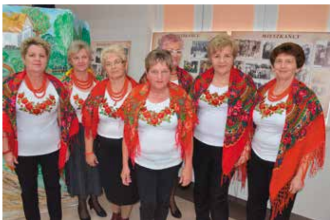
Dąbrowianki zaprosiły na wyjątkową wystawę.