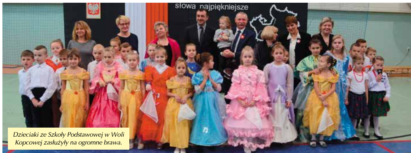
Dzieciaki ze Szkoły Podstawowej w Woli Kopcowej zasłużyły na ogromne brawa.