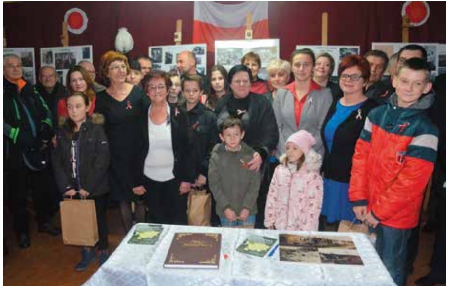
Inicjatorzy wydarzenia, laureaci konkursu plastycznego i goście pozowali do wspólnego zdjęcia.