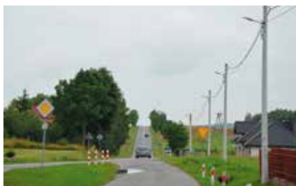
Już niedługo w całej gminie pojawią się LED-owe oprawy lamp takie jak w Mąchocicach Kapitulnych

Na początku listopada ruszył przetarg, który wyłoni wykonawcę modernizacji gminnego oświetlenia. Zmiana, jaką odczują mieszkańcy będzie znaczna. Lampy będą świecić się przez całą noc, ze względu na ich energooszczędność budżet gminy nie będzie ponosił większych kosztów związanych z oświetleniem niż dotychczas. - To pierwsza inwestycja, jaką Gmina Maśłów realizuje w ramach Zintegrowanych Inwestycji Teryto-