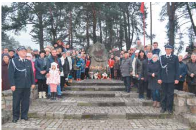
Pamiątkowe zdjęcie uczestników spotkania pod pomnikiem w Wiśniówce.