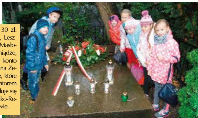
Dzieci złożyły kwiaty na grobie Stefana Żeromskiego.

łącznie zebrać 1323,30 zł: w Brzezinkach 506,80 zł, Leszczynach 141,50 zł, a w Małowie 675 zł. Zebrane pieniądze zostaną przekazane na konto Stowarzyszenia im. Stefana Żeromskiego w Warszawie, które jest głównym organizatorem akcji. Grób pisarza znajduje się na Cmentarzu Ewangelicko-Reformowanym w Warszawie.