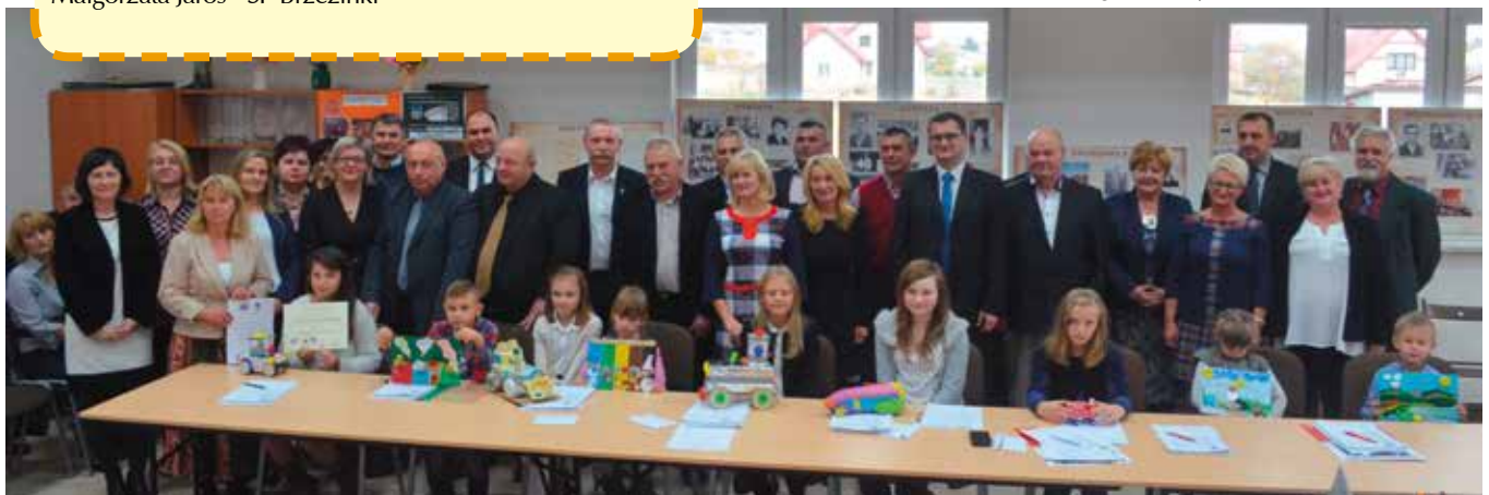
Laureaci odebrali nagrody podczas sesji Rady Gminy. Nie zabrakło więc wspólnego zdjęcia z radnymi.