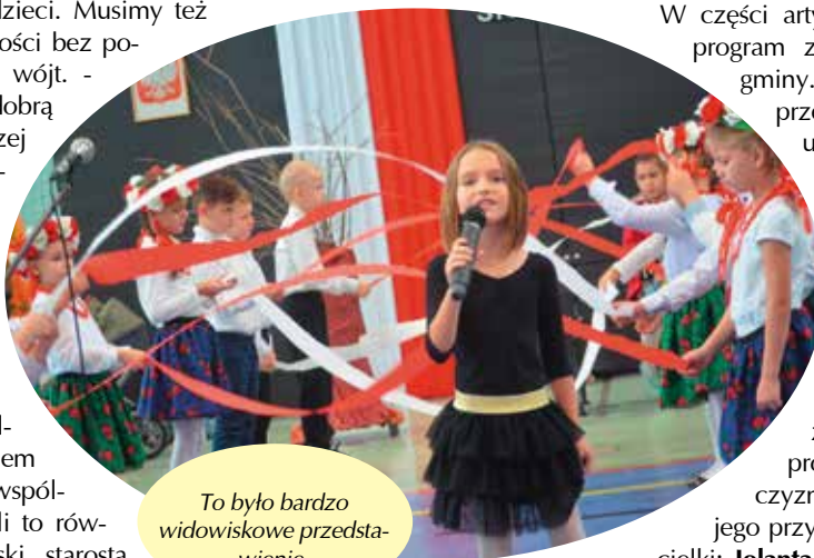
To było bardzo widowiskowe przedstawienie.