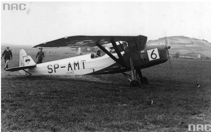
Narodowe Archiwum Cyfrowe, sygn. 1-5-1278

Samoloty odlatają z Masłowa już od 70 lat.