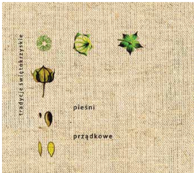
Tak prezentuje się okładka.