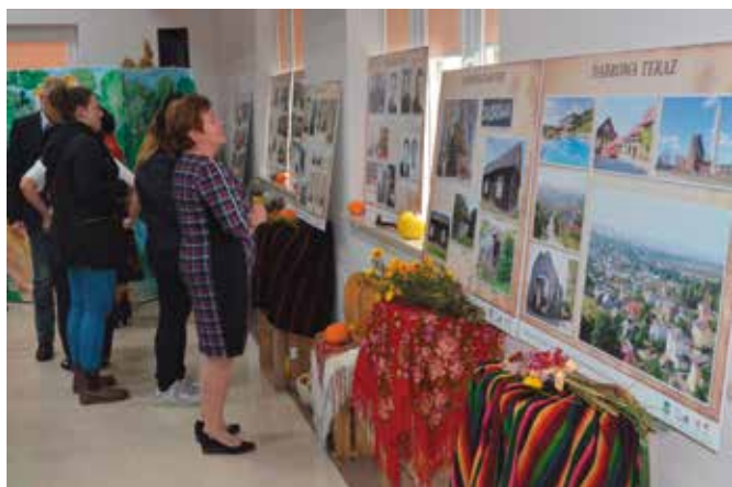
Wystawa zostanie na stałe umieszczona na ścianach świetlicy.