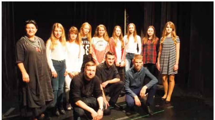
Zespół Teatru Kapitałnego z Mąchocic Kapitulnych na scenie „Kubusia”.