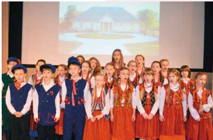
Czerwone Jagody bardzo podobały się warszawskiej publiczności.