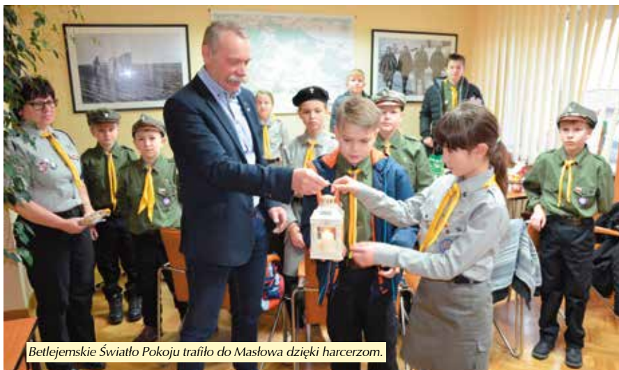
Betlejemskie Światło Pokoju trafiło do Masłowa dzięki harcerzom.