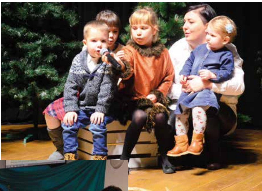
Na scenie kolędowały całe rodziny.