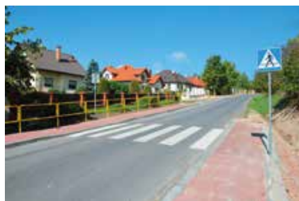
Dzięki świetnej współpracy ze Starostwem Powiatowym w Masłowie i Woli Kopcowej wybudowano nowe chodniki.

Wiele działa się również na drogach Gminy Masłów. Ekipy pojawiły się w miejscach, które wymagały niezwłocznej interwencji ze względu na ich stan pozostawiający wiele do życzenia. W ramach Narodowego Funduszu Przebudowy Dróg Lokalnych uzyskano pieniądze na przebudowę ul. Świerczyńskiej w Masłowie Pierwszym łącznie z rowami. W trakcie