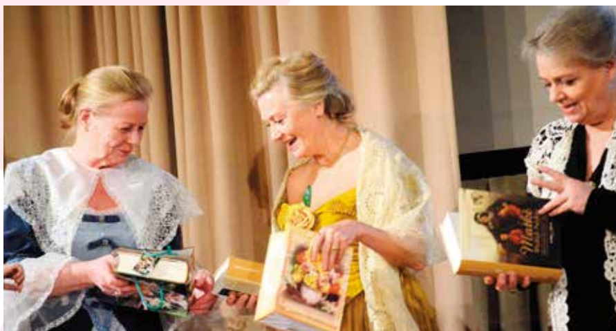
Aktorki Anna Seniuk, Anna Nehrebecka, Halina Rowicka czytały fragmenty książki „Matki Wielkich Polaków”.