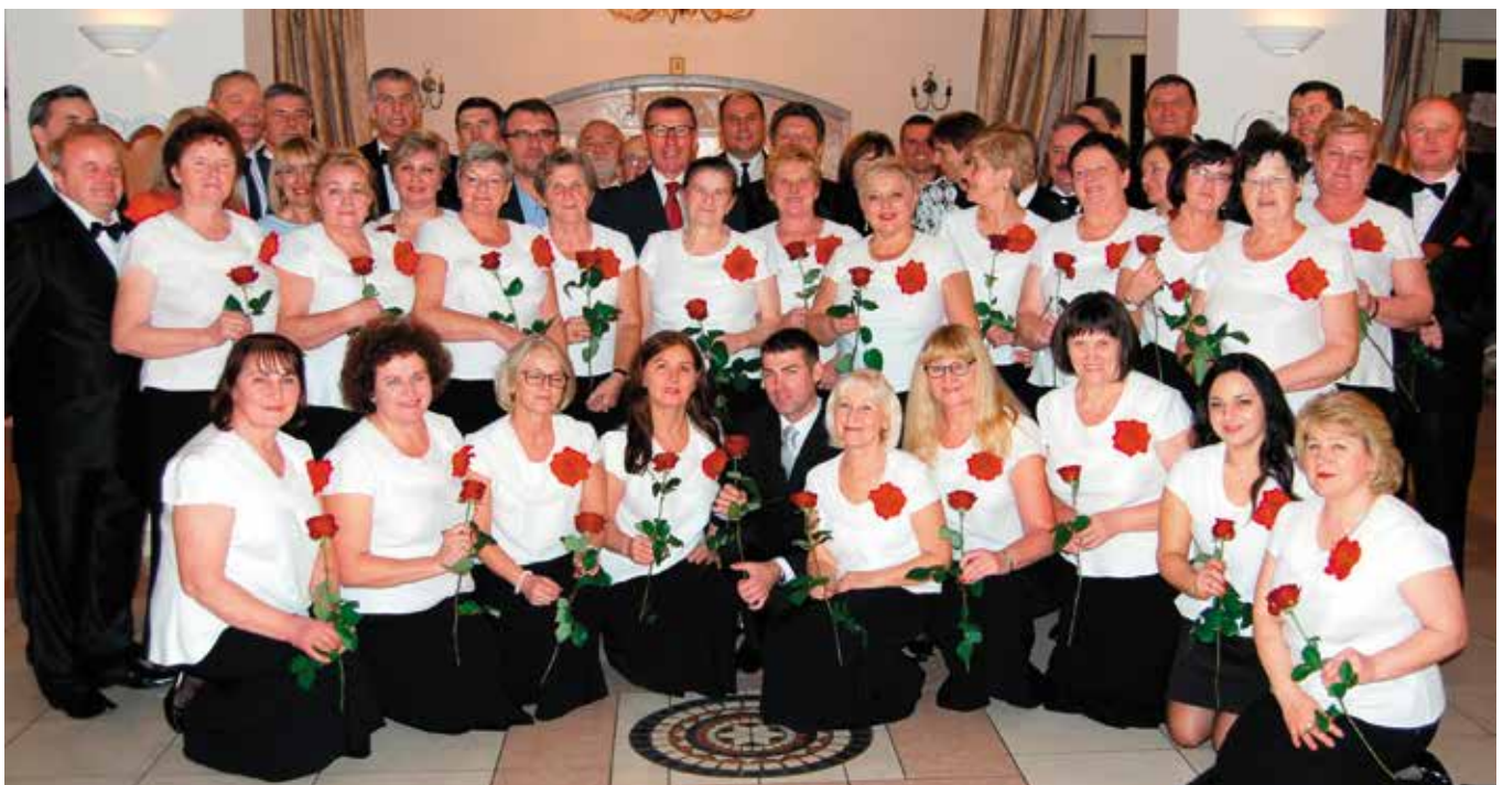
Pamiątkowe zdjęcie chórzystów i gości za kilka lat będzie miało sentymentalną wartość.