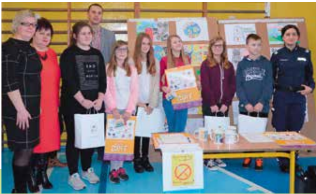
Nagrodzeni uczniowie z Zespołu Szkół w Mąchocicach Kapitulnych.