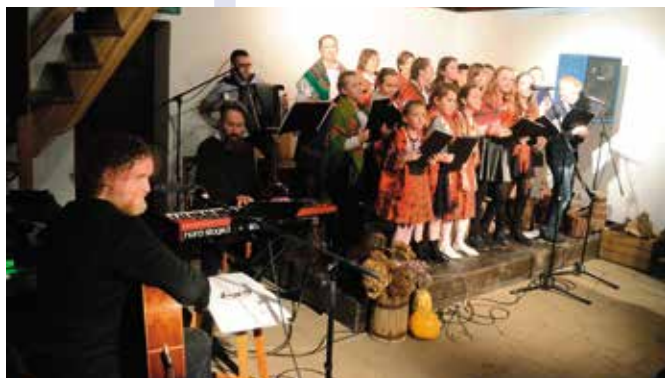
Na scenie w Marcinkowie śpiewało już wielu uznanych arystów, teraz przyszedł czas na naszych debiutantów.