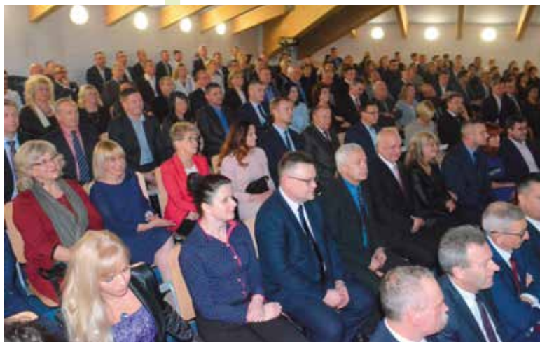
W Ciekotach spotkali się przyjaciele Stowarzyszenia Biegacz Świątokrzyski.

biegowe dla dzieci i młodzieży promujące zdrowy styl życia pod hasłem „O ząbki dbamy i w zawodach biegamy” w Mąchocicach - Scholasterii.