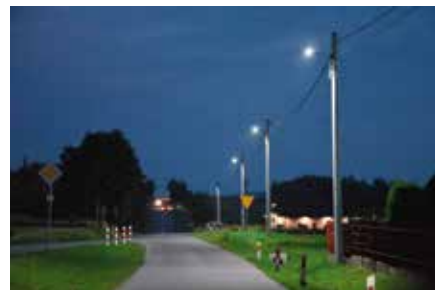
W przyszłym roku na terenie niemal całej gminy będą świecić LED-owe lampy.

w Woli Kopcowej i OSP w Brzezinkach w ramach dofinansowania z Urzędu Gminy i prowadzonej zbiórki. W mijającym roku po raz pierwszy przyznano Nagrodę Gospodarczą Gminy Masłów. To efekt podjęcia przez Radę Gminy, na wniosek wójta i Stowarzyszenia Przedsiębiorców Gminy Masłów, uchwały mającej na celu docenienie przedsiębiorców działających na terenie gminy. To jednak nie wszystko, bo radni