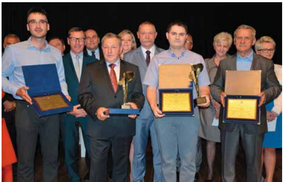
Tak było podczas tegorocznej gali wręczenia nagród.

Pierwsza edycja Nagrody Gospodarczej była okazją zarówno do nagrodzenia i wyróżnienia przedsiębiorców z naszej gminy oraz okazją dla integracji środowiska biznesowego. Jak podkreśliła Rada Gminy w uzasadnieniu uchwały nagroda ma na celu uhonorowanie tych przedsiębiorców, którzy wniesli wkład w rozwój społeczny i gospodarczy gminy Masłów, przyczyniając się do jej rozwoju oraz promocji przedsiębiorczości. Od początku stycznia będzie można zgłaszać kandydatury osób, które będą pretendować do edycji 2017. Co ważne zgłoszenia należy dostarczyć pocztą lub osobiście do sekretariatu Urzędu Gminy Masłów. Wszystkie niezbędne informacje, regulamin i formularze można znaleźć na stronie www.maslow.pl jak i otrzymać osobiście w sekretariacie. Warty podkreślenia jest także fakt, że Gmina Masłów pod względem ilości podmiotów gospodarczych w stosunku do ilości mieszkańców zajmuje czołowe miejsce w województwie świętokrzyskim, są to w przeważającej mierze osoby fizyczne prowadzący jednoosobową działalność gospodarczą. Na