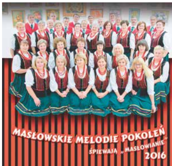
Tak wygląda okładka płyty „Masłowskie Melodie Pokoleń”, którą można zakupić u członków chóru.