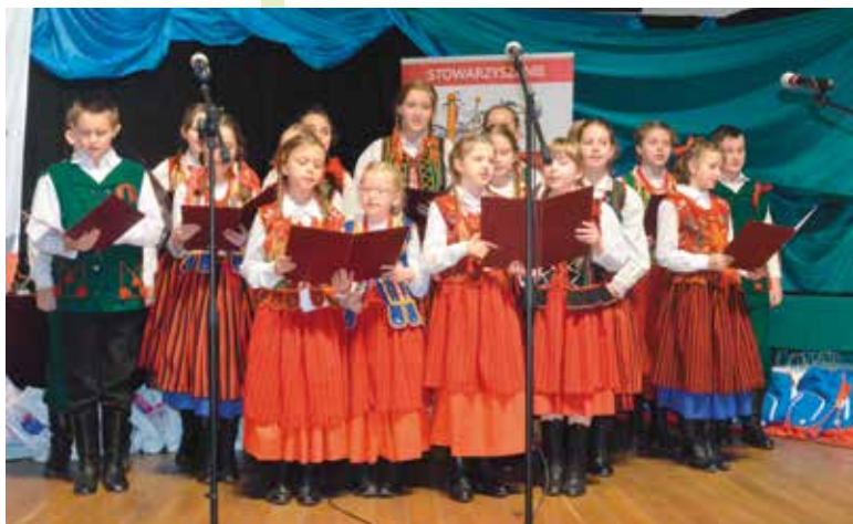
Kolędy zaśpiewały Czerwone Jagody.