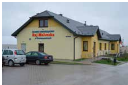
Młode mamy z gminy Masłów dzięki żłobkowi mogą wcześniej wrócić do pracy i nie martwić się o swoje pociechy.

W ciągu ostatnich lat zakończono wszystkie rozpoczęte budowy budynków użyteczności publicznej. W stanie surowym znajdowały się trzy ważne dla mieszkańców budynki. Po zakończeniu prac do budynku w Woli Kopcowej wprowadzili się strażacy z miejscowej jednostki OSP. W Dąbrowie otwarto świetlicę samorządową, która świetnie spełnia już swoją kulturalną funkcję. W Domaszowicach powstał Żłobek Samorządowy „Raj Maluszka”. Co ważne Gmina Masłów na uruchomienie żłobka jako jedna z czterech w województwie świętokrzyskim i 75. w kraju otrzymała dofinansowanie z Ministerstwa Pracy i Polityki Społecznej na start placówki, z której korzysta 20 maluchów. Obiektem, jaki powstawał od podstaw jest budynek szatniowo-sanitarny przy boisku w Brzezinkach. Po latach drużyna MSS Klonówka ma miejsce, w którym zawodnicy mogą się nie tylko przebrać, ale również wykapać po meczach. Gruntowną modernizację przeszedł budynek świetlicy wiejskiej w Barczy.