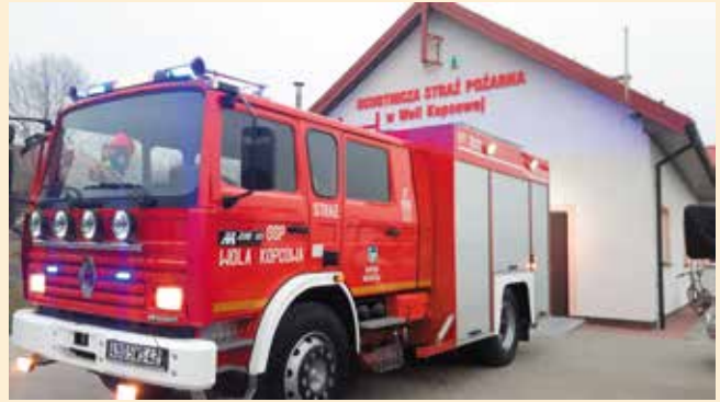
Nowy nabytek strażaków z Woli Kopcowej

Strażacy ochotnicy z Woli Kopcowej zakupili nowy wóz ratowniczo-gaśniczy marki Renault Midliner M210, zastąpił on obecne auto marki GLBA Lublin II. Druhowie z jednostki w Woli Kopcowej prowadzili społeczną zbiórkę na zakup wozu wśród mieszkańców, pozyskiwali środki od sponsorów oraz otrzymali dotację na jego zakup w wysokości 80 tys. zł z Urzędu Gminy. Nowy nabytek druhowi posiada m.in. zbiornik, który pomieści 3000 litrów wody, autopompę dwustopniową o wydajności 2000 l / min, lampy dalekosiężne z przodu auta. Kabina zmieści 8 osobową obsadę. W najbliższym czasie auto zostanie wyposażone w działko wodne i maszt oświetleniowy. Jest to drugi wóz wymieniony w tym roku przez strażaków z terenu naszej gminy. Na początku roku nowym wozem chwalili się druhowie z Ciekot. W przyszłym roku nowe wozy zaparkują w remizach w Masłowie i Brzezinkach.