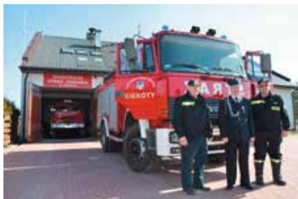
Druhowie z Ciekot dumnie prezentują swój nabytek. Już wkrótce nowe wozy zaparkują w remizach w Masłowie i Brzezinkach.

cach Kapitulnych. Trwa opracowywanie dokumentacji pod projekt budowy ścieżki rowerowej na przełomie Lubrzanki na trasie Mąchocice Kapitulne - Ciekoty oraz projekt zagospodarowania Lasu Wolskiego w Woli Kopcowej, nad zalewem w Cedzynie. Zostanie tam wybudowany parking, powstaną alejki pieszo-rowerowe i miejsca odpoczynku, place zabaw. Wszystko w zgodzie z ekologicznym stylem życia promującym szeroko pojętą ochronę środowiska. Na inwestycje w ramach ZIT KOF Gmina Masłów otrzyma ponad 8,5 miliona z unijnych pieniędzy.