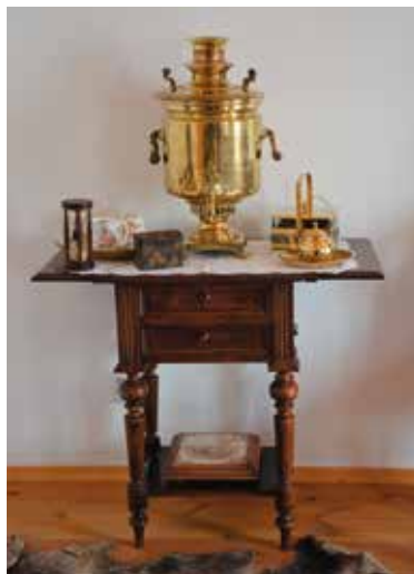
Zdjęcie stolika z samowarem i towarzyszącymi akcesoriami.