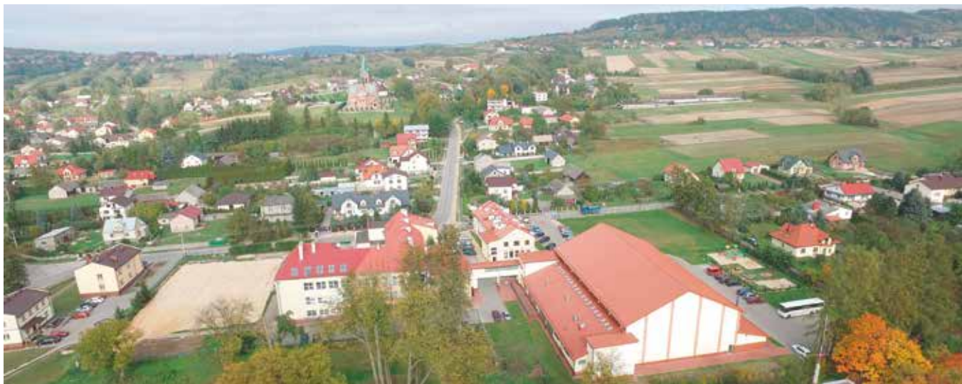
Rewitalizacja zmieni wygląd centrum Masłowa.

zdecydowali również o podjęciu uchwały pozwalającej na m.in. ulgi podatkowe dla przedsiębiorców. Wielkim powodzeniem od lat cieszy się realizacja funduszu sołectkiego, o którego wykorzystaniu decydują mieszkańcy sołectw. Na ten cel gmina przeznaczająca ok. 260 tys. zł. To właśnie z inicjatywy mieszkańców w tym roku w Masłowie został odsłonięty pomnik św. Jana Pawła II. Dzięki zaangażowaniu członków Komitetu Budowy Pomnika, wsparciu ze świętokrzyskich samorządów, Urzędu Gminy Masłów oraz właśnie mieszkańców Gminy Masłów w 25. rocznicę wizyty papieża Polaka w Masłowie mógł stanąć ważny obelisk. Nieustannie na wsparcie mogą liczyć sportowcy oraz zespoły oraz koła gospodyń działające na terenie gminy. Co ważne po wielu trudach w tym roku przyjęto studium, które jest dokumentem wyjściowym do sporządzenia planów zagospodarowania poszczególnych sołectw. W ponad 90 procentach spełnia on oczekiwania mieszkańców w temacie klasyfikacji gruntu.