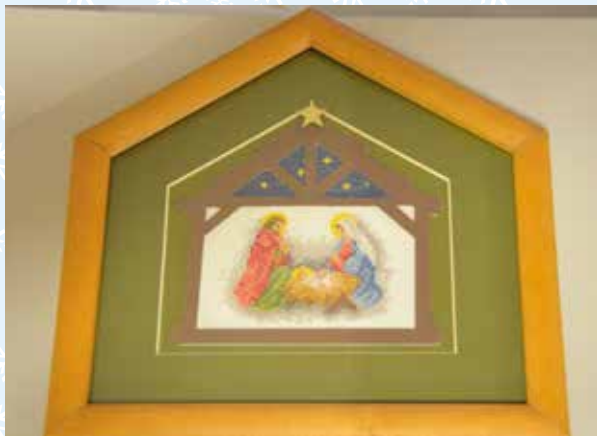
Szopka – haft z Dworku Stefana Żeromskiego