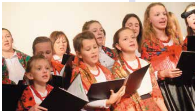
To pierwszy taki projekt w historii SP w Brzezinkach.