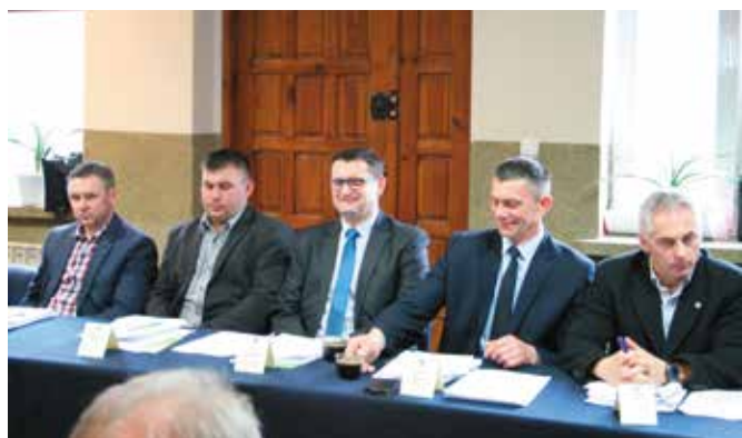
Ważnym punktem sesji było uchwalenie Programu opieki nad zwierzętami bezdomnymi oraz zapobiegania bezdomności zwierząt na terenie Gminy Masłów na 2017 rok.