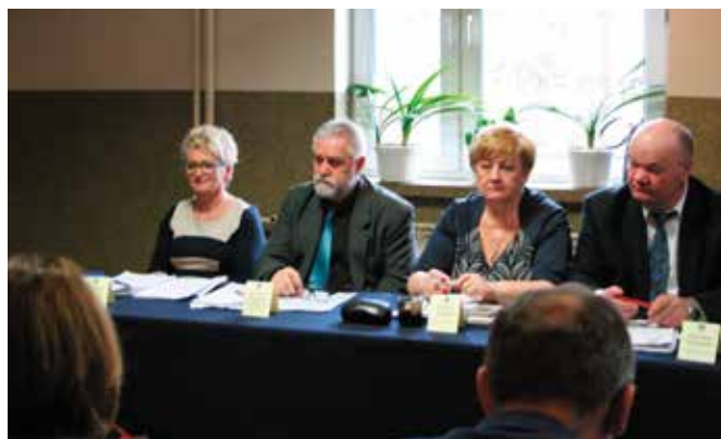
Jak podczas każdej sesji nie zabrakło wprowadzenia zmian w budżecie.

Ważnym punktem sesji było uchwalenie Programu opieki nad zwierzętami bezdomnymi oraz zapobiegania bezdomności zwierząt na terenie Gminy Masłów na 2017 rok. Obejmuje on: odławianie bezdomnych zwierząt, umieszczenie ich w schronisku oraz ich obowiązkową kastrację i sterylizację, opiekę nad wolno żyjącymi kotami, zapewnienie całodobowej opieki w przypadku zdarzeń drogowych, wskazanie gospodarstwa rolnego w celu zapewnienia miejsca dla zwierząt gospodarskich, które byłyby odebrane decyzją wójta Gminy Masłów. Po raz pierwszy po zmianie ustawy w styczniu 2017 r. radni zdecydowali o wprowadzeniu planu sterylizacji lub kastracji zwierząt, które posiadają swoich właścicieli. Oznacza to, że każdy właściciel może zgłosić się z wnioskiem do Urzędu