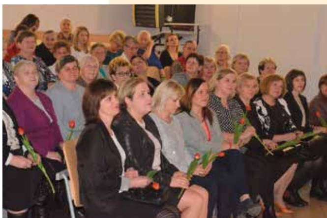
Na zaproszenie odpowiedziało wiele mieszkanki naszej gminy.