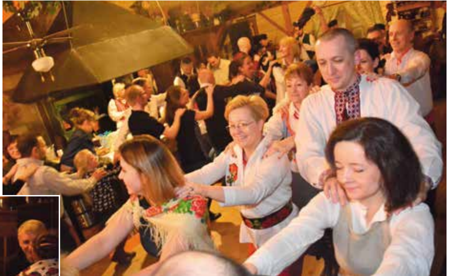
Ze względu na duże zainteresowanie zabawę zorganizowano w sobotę i niedzielę.

Świętokrzyskie poleczki, obertasy i walczyki królowały podczas sobotniego i niedzielного wieczoru. Gościom, którzy pojawili się w naszej gminie, na zakończenie karnawału przygrywała Kapela Ciekot.