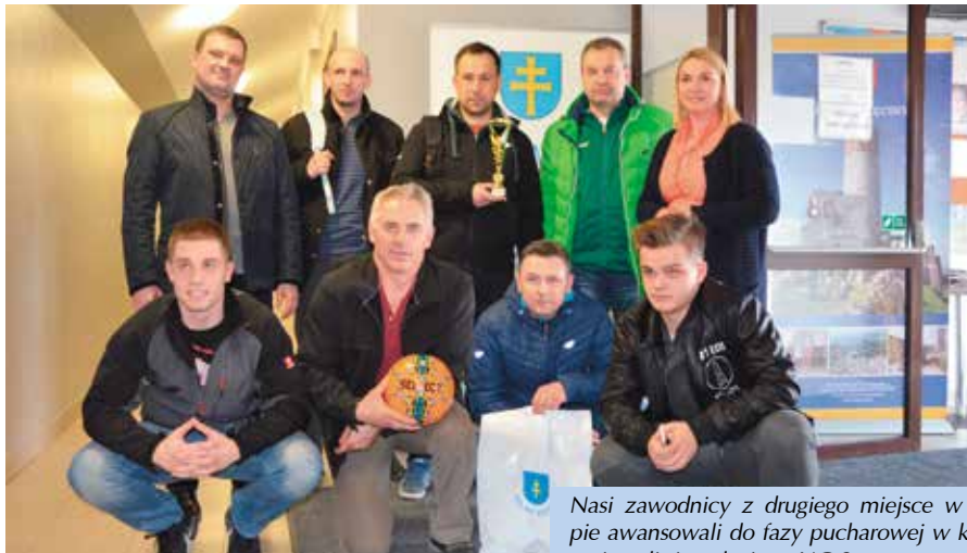
Nasi zawodnicy z drugiego miejsca w grupie awansowali do fazy pucharowej w której zmierzyli się z drużyną UG Strawczyn.

W regulaminowym czasie gry nie padły bramki i o losie drużyn zdecydował konkurs rzutów karnych w którym minimalnie lepsi okazali się zawodnicy ze Strawczyna, którzy jak się później okazało dotarli do finału. Puchar starosty kieleckiego zdobyła drużyna Komendy Miejskiej Państwowej Straży Pożarnej w Kielcach, która