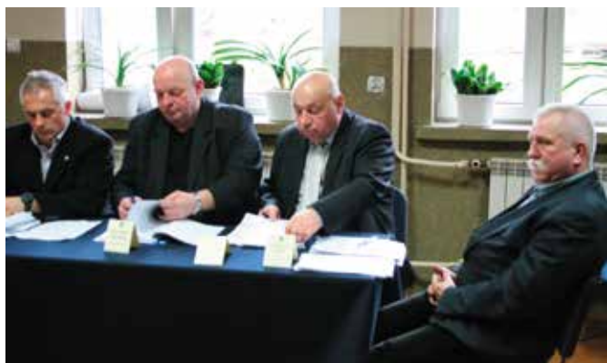
Radni podjęli również uchwałę w sprawie uchwalenia regulaminu naboru i weryfikacji wniosków w zakresie realizacji projektu: Odnawialne Źródła Energii dla mieszkańców Gminy Masłów.

Zespół Interdyscyplinarny zajmujący się problematyką przemocy miał wiele pracy. Przypomnijmy, że jego członkowie są powoływani zarządzeniem wójta będąc oddelegowanymi ze swoich jednostek macierzystych. W minionym roku odbyły się 122 spotkania. W 2016 roku zwiększyła się liczba zakładanych Niebieskich Kart zakładanych przez policję sprawcom przemocy domowej. W 2015 r. było ich 36, a w 2016 r. 41. W ramach programu antyprzemocowego współpracowano z Centrum Interwencji Kryzysowej w Kielcach i Powiatowym Centrum Pomocy Rodzinie. Z tych form skorzystało 31 osób, a dla 11 rodzin zostały przeprowadzone mediacje rodzinne. W programie edukacyjno-korekcyjnym dla sprawców przemocy domowej wzięły udział trzy osoby. Przedsta-