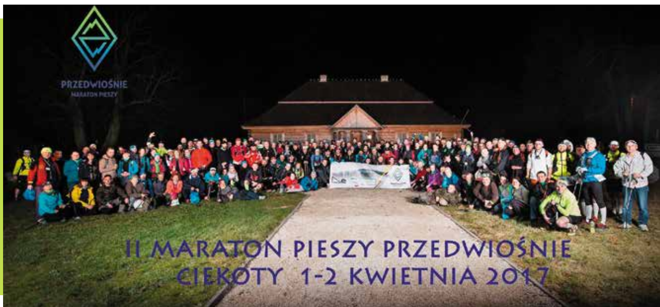
Pamiatkowe zdjęcie wszystkich uczestników przed wyruszeniem w trasę.