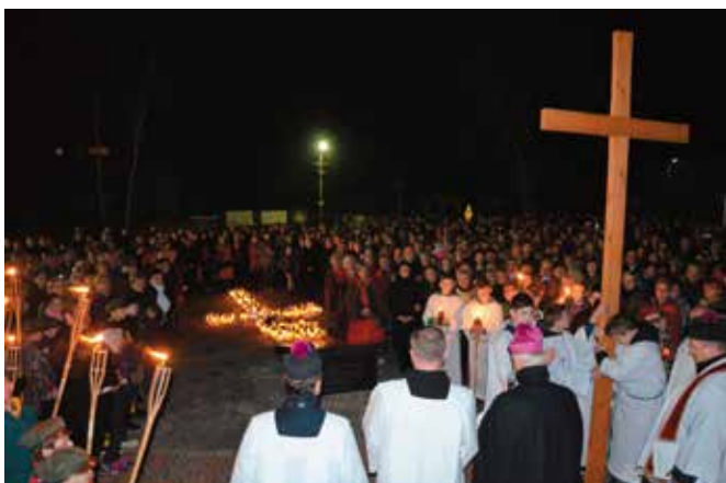
W uroczystościach w Masłowie wzięło udział mnóstwo osób nie tylko mieszkańców gminy, ale również wiele osób m.in. z Kielc i okolic.