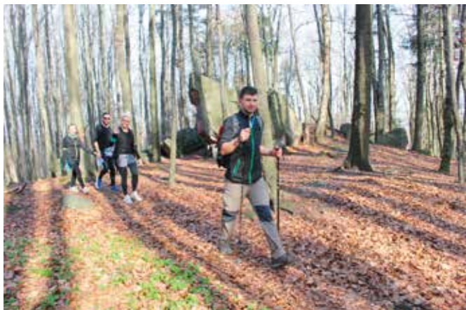
Trasa maratonu wiodła m.in. przez Puszcę Jodłową.

Przejsie maratonu wymagało od piechurów nie lada zaprawy. Na mecie pojawiło się 159 osób, które ukończyły trasę w wyznaczonym przez organizatorów czasie. Pierwszy piechur dotarł na metę po 8 godzinach, a ostatni po 20 godzinach. Co ważne