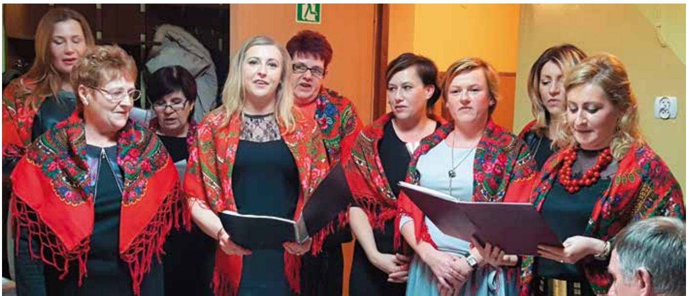
Na zakończenie każdego ze spotkań zaprezentowały się zespoły ludowe: KGW Brzezinki oraz Barczanki.