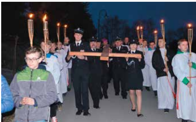
Krzyż nosło wielu mieszkańców naszej gminy m.in. strażacy.