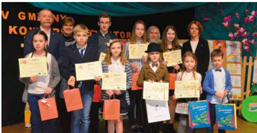
Laureaci IV Gminnego Konkursu Recytatorskiego w komplecie.