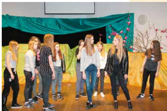
Spektakl „Sekret” zaprezentował Teatr Kapitałny.