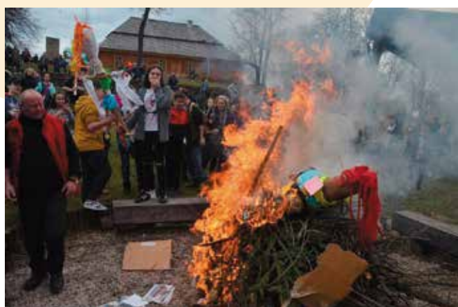
Na finał w ognisku w amfiteatrze spłonęły marzanny.