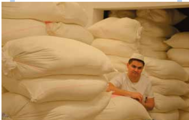
Do tego miejsca dostęp ma niewiele osób. Tak wygląda magazyn mąki.

Ostatnio bardzo modne jest być fit. Zauważa pan ten trend również w swojej piekarni?