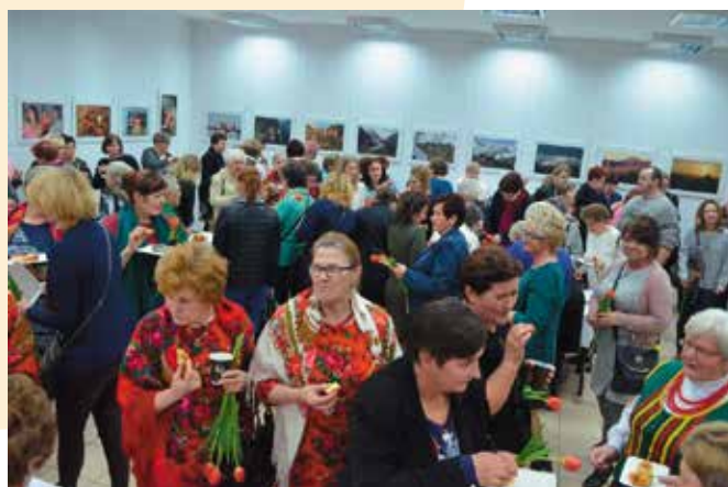
Po części artystycznej panie zaproszono na słodki poczęstunek.