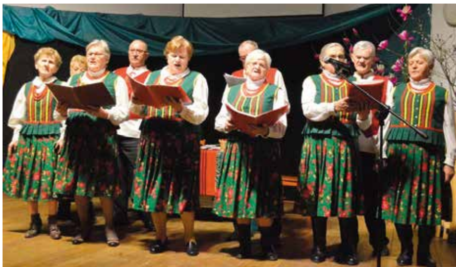
Z wielkim powodzeniem na scenę powrócił Klub Seniora z Masłowa.