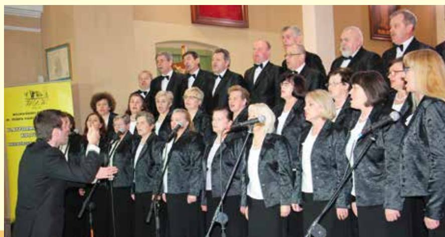
Chór Masłowianie i Golica podczas występów w Daleszycach