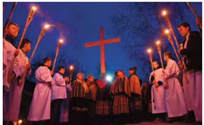
Masłowskiej drodze krzyżowej zawsze towarzyszy piękna oprawa.