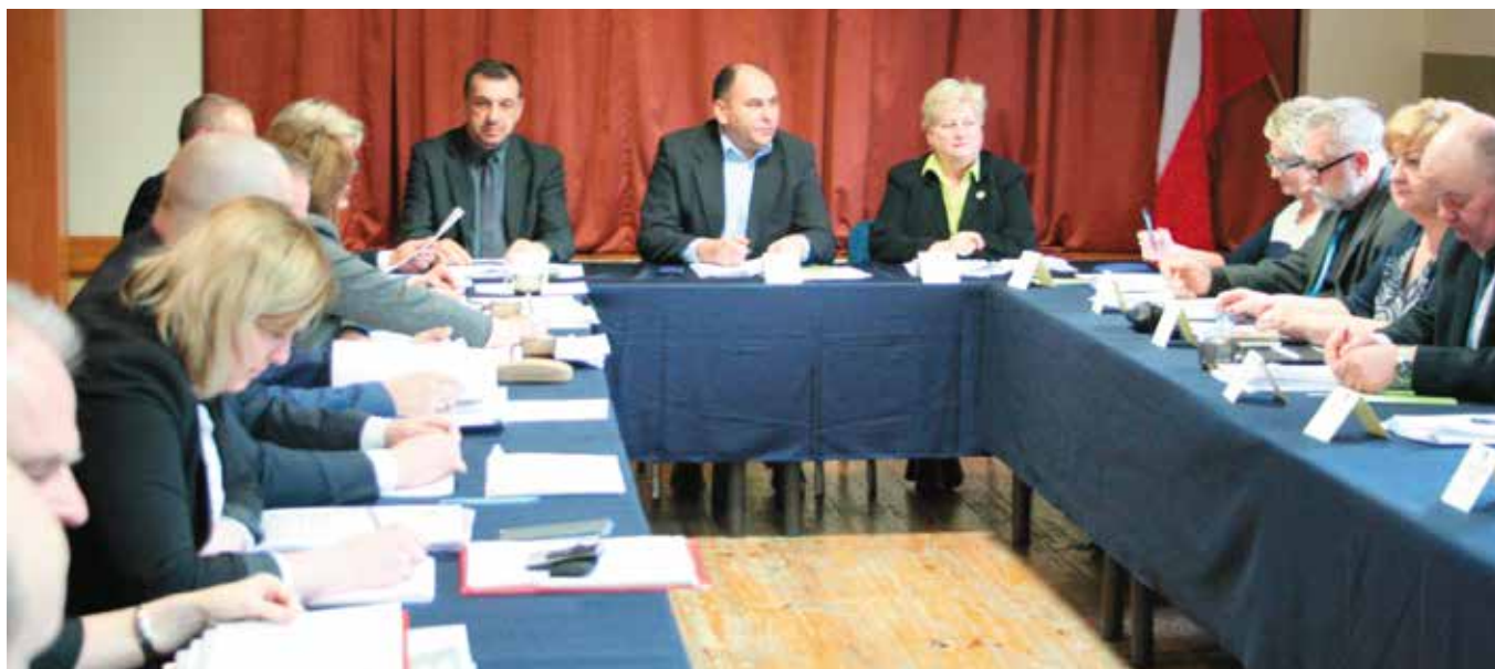
Posiedzenie Rady Gminy odbyło się w Gminnym Ośrodku Kultury i Sportu w Maślowie.

Istotną kwestią było podjęcie uchwały wprowadzającej zmiany dotyczące Planu Gospodarki Niskoemisyjnej dla Gminy Maślów na lata 2015 –2020 poprzez dodanie nowego zadania w zakresie odnawialnych źródeł energii. Projekt uchwały uzyskał pozytywną opinię Wojewódzkiej Stacji Sanitarno-Epidemiologicznej i Regio-