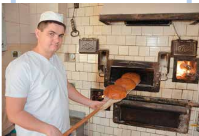
To z tego pieca wychodzi pieczywo znane w całym województwie świętokrzyskim.

U nas decyduje przede wszystkim przywiązanie do tradycji i niezmienny od lat smak. Naszym produktem, który zdobył wiele nagród i cieszy się niestłabnym powodzeniem klientów jest chleb mąchocki na zakwasie. Jego receptura jest niezmienna i od lat smakuje tak samo. Stawiamy na naturalną produkcję bez ulepszczeni, co jest doceniane przez klientów nie tylko z naszej gminy, ale również z Kielc czy Bodzentyna i Starachowic, którzy przyjeżdżają do nas na zakupy. O sukcesie decyduje też ekipa pracowników, z którymi tworzy się firmę. To ludzie są naszym bogactwem. Sam niewiele mógłbym zrobić. Jestem dumny, że udało nam się stworzyć grono zaufanych osób, dla których piekarnia jest czymś więcej niż zwykłym miejscem pracy.