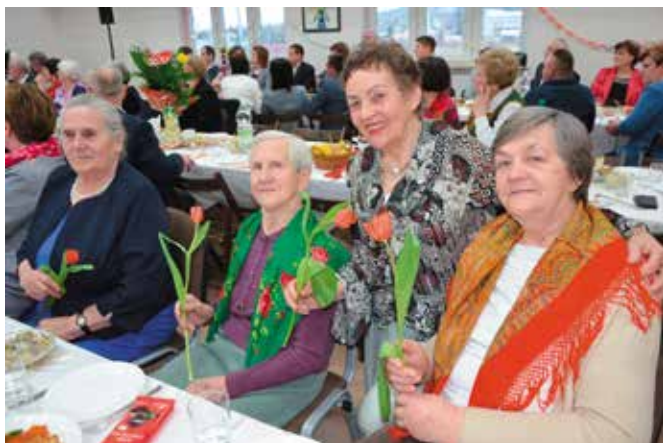
Panie cieszyły się ze wspólnego święta.