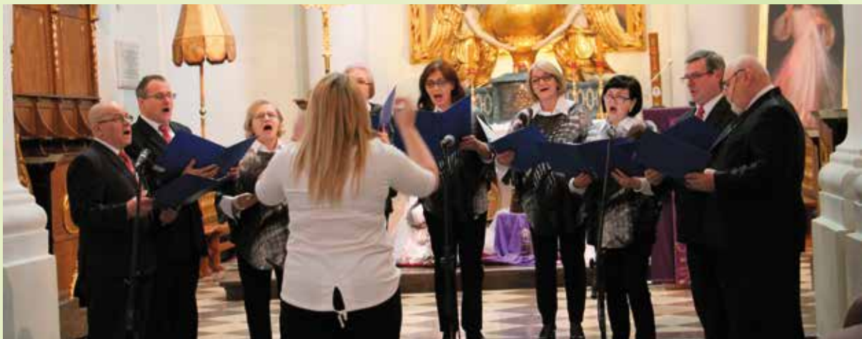
Golica powtórzyła swój sukces z ubiegłego roku.

Grupa Artystyczna Golica zajęła pierwsze miejsce w swojej kategorii IV Regionalnego Przeglądu Pieśni Pasyjnej i Pokutnej, który odbył się w klasztorze na Świętym Krzyżu.