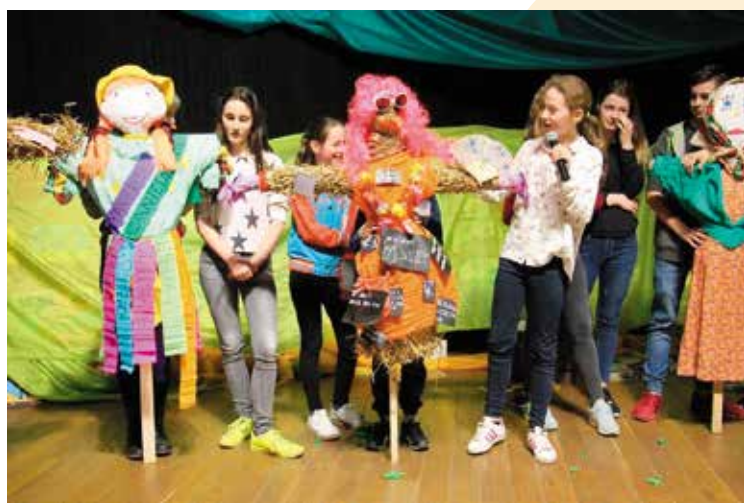
Uczniowie prezentowali swoje marzanny z hasłami profilaktycznymi.