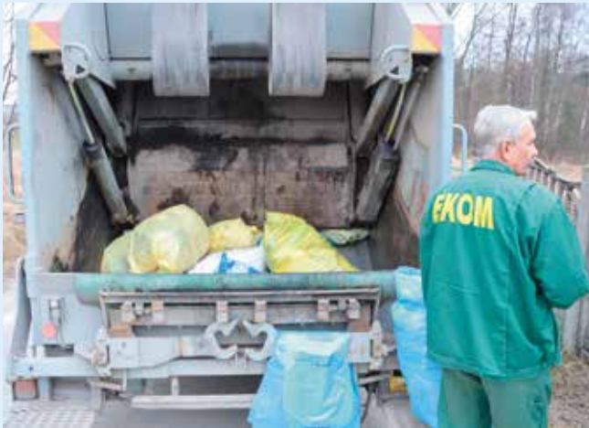
Pracownicy firmy odbierającej śmieci pojawiają na terenie gminy cyklicznie.

Urząd Gminy Masłów informuje, że firma EKOM zbierająca odpady komunalne na terenie gminy Masłów posiada samochody dwukomorowe, które są przystosowane do odbierania odpadów selektywnie zebranych.