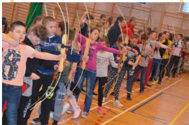
Do hali zjechali młodzi łucznicy.