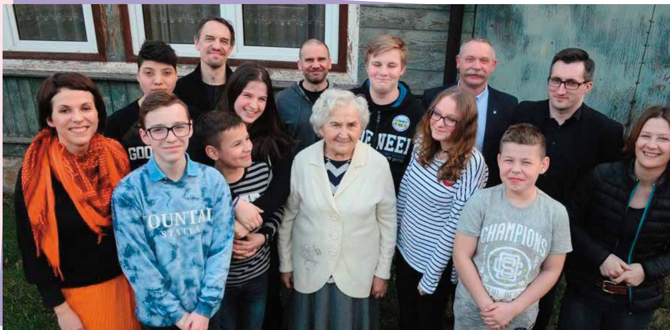
Twórcy „Smaragdowego miejsca” niemal w komplecie zjawili się na premierze w świetlicy osiedlowej w Wiśniówce.