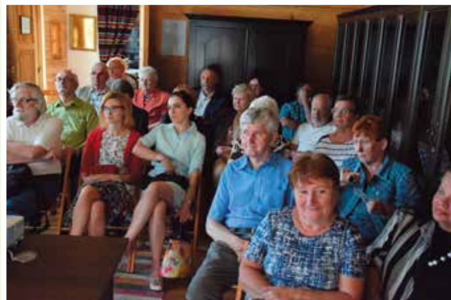
Spotkania „O Żeromskim od A do Ż” cieszą się od zawsze sporym zainteresowaniem.