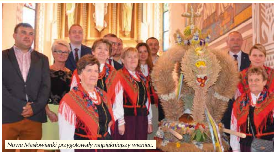
Nowe Masłowianki przygotowały najpiękniejszy wieniec.