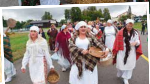
Grupa ze Skalmierza nadała szczególnie charakter korowodowi.