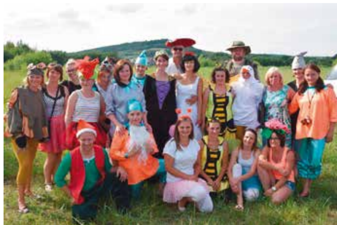
Rodzice dzieciaków z Woli Kopcowej zaprezentowali swoją wersję Królowy Śnieżki.