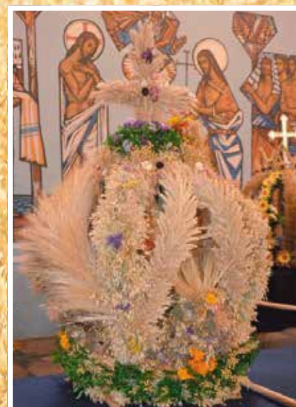
Masłowski Klub Seniora