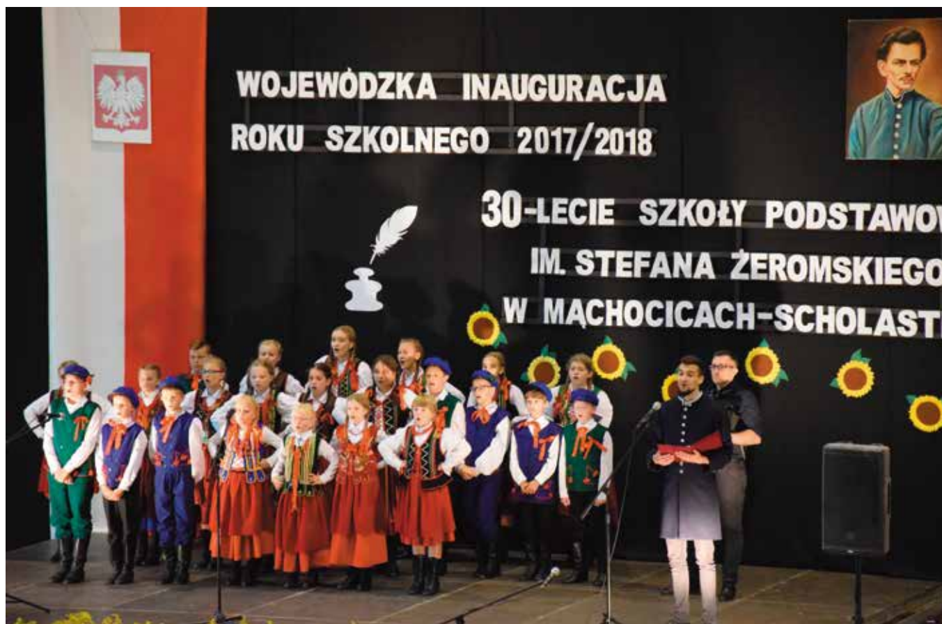
W widowisku „Ojczyzna duszy” wystąpiły Czerwone Jagody.