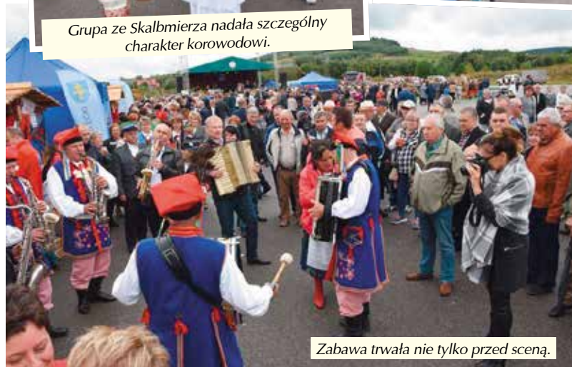
Zabawa trwała nie tylko przed sceną.