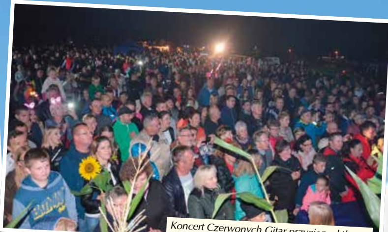
Koncert Czerwonych Gitar przyciągnął tłumy.