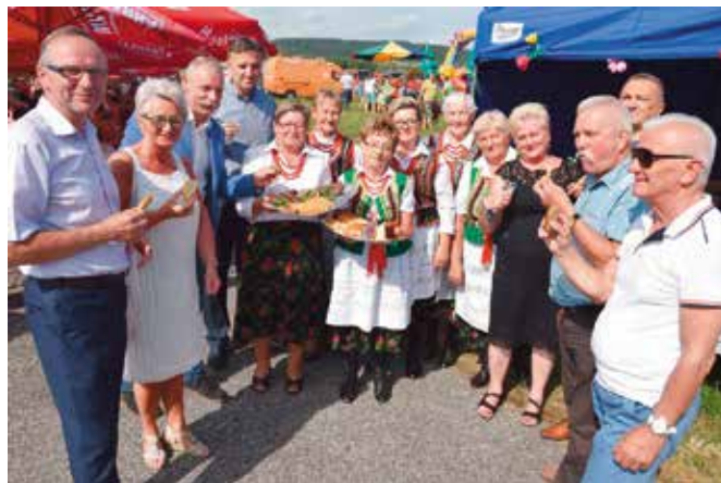
Nasi samorządowcy oraz goście próbowali potraw regionalnych serwowanych m.in. przez panie z zespołu Kopcowianki.