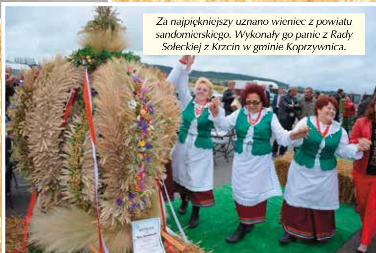
Za najpiękniejszy uznano wieniec z powiatu sandomierskiego. Wykonały go panie z Rady Sołeckiej z Krzcin w gminie Koprzywnica.