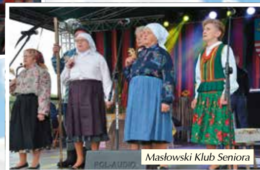
Masłowski Klub Seniora

Po emocjach konkursowych scena należała już do artystów inspirujących się w swojej twórczości muzyką ludową. W bloku „Estrada folkloru” wystąpiły najlepsze kapela i zespoły z województwa. Później już przyszedł czas na występy gospodarzy. Gminę Masłów reprezentowały zespoły: Klub Seniora z Masłowa, Kapela Ciekoty, ZPiT Ciekoty, Kopcowianki, Dą-