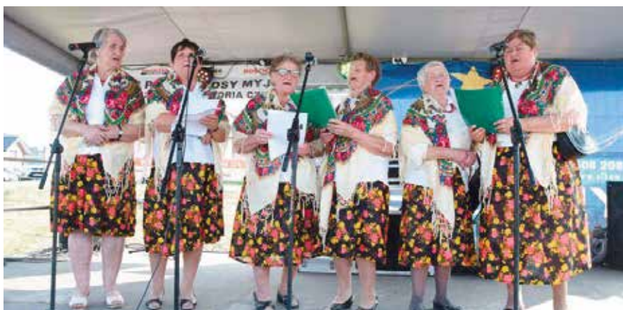
Na scenie było między pokoleniowo, wystąpiły Dolinianki Seniorki, Dolinianki i po raz pierwszy Dolinianeczki.

policjanci oraz KRUS, gdzie można było otrzymać ciekawe publikacje oraz foldery.