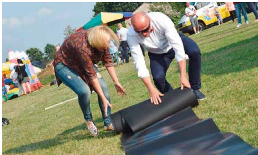
Nie brakowało ciekawych konkurencji m.in. zwijania asfaltu na czas.

Co ciekawe z festynu nikt nie wyszedł głodny. Oprócz tego, że przez cały czas trwania imprezy można było zjeść ziemniaka wprost z rozgrzanego ogniska, to o podniebienia uczestników pikniku zadbały Dolinianki. Na swoim stoisku serwowały regionalne potrawy oraz pyszne ciasta.