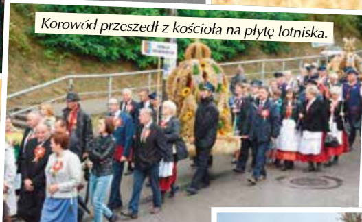
Korowód przeszedł z kościoła na płytę lotniska.