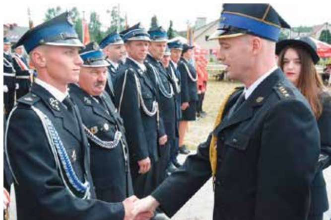
Podczas uroczystości wręczono medale zasłużonym strażakom.