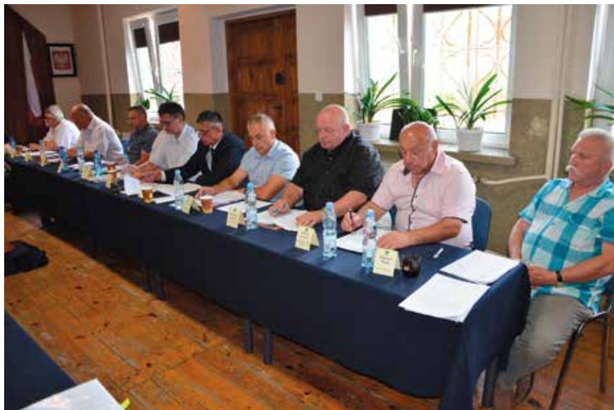
Radni zgodnie zagłosowali nad absolutorium dla wójta z tytułu wykonania budżetu za 2016 rok.

Radni jednogłośnie zagłosowali za absolutorium dla wójta Gminy Masłów za wykonanie budżetu za 2016 rok.