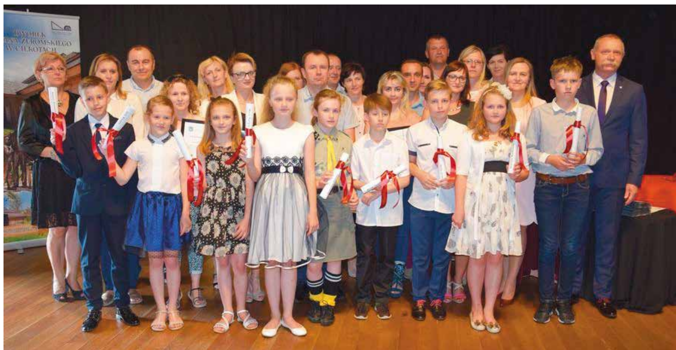
Szkoła Podstawowa im. Jana Pawła II w Masłowie miała najwięcej stypendystów.