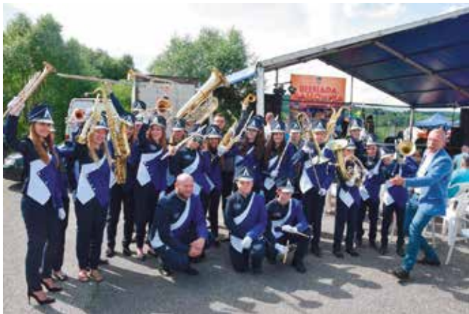
Biesiadę rozpoczęła Młodzieżowa Orkiestra Dęta z Masłowa.