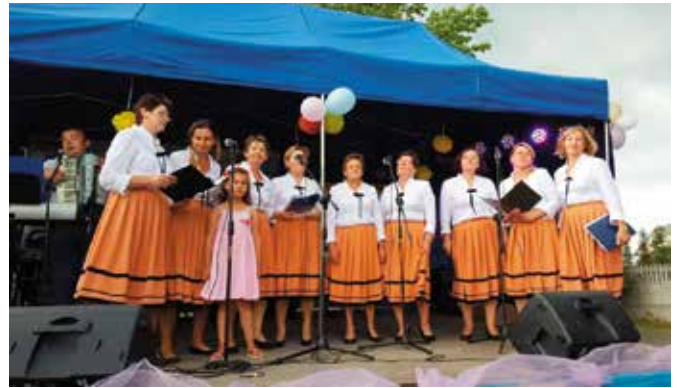
Nowe Maśłowianki nie tylko przygotowały festyn, ale również zaśpiewały.