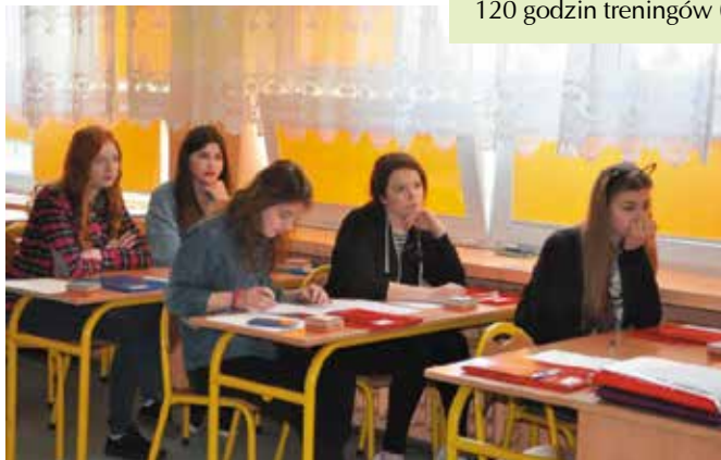
Poza treningami, systematycznie od lutego do czerwca, prowadzone były zajęcia kompensacyjne oraz zajęcia rozwijające umiejętności kluczowe, z matematyki/przyrody i języka angielskiego.

27 uczniów III klasy gimnazjum w Masłowie i Mącholicach Kapitulnych w wyniku przeprowadzonej rekrutacji objęto projektem, 24 laptopy, 4 tablice multimedialne, 10 słuchawek komputerowych i 1 kpl głośników; kupiono podczas trwania projektu 67,5 godzin to czas, w którym przeprowadzono diagnozę funkcjonalną wszystkich uczniów 150 godzin zajęć kompensacyjnych 180 godzin zajęć rozwijających 378 godzin tyle czasu przeznaczono na udzielenie wsparcia psychologicznego 120 godzin treningów (przedsiębiorczości, dorosłości i efektywnego uczenia się)