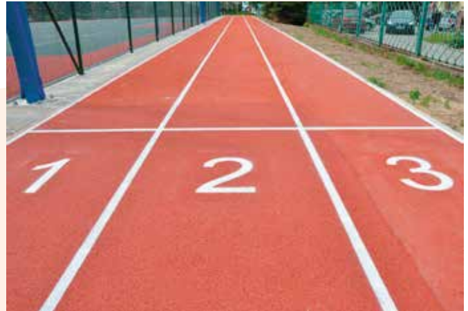
Przy boisku znajduje się bieżnia na której można trenować biegi sprinterskie oraz skok w dal.