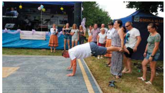
Wiele zabawy przyniosły zaskakujące konkurencje.