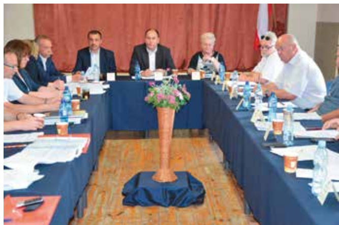
Radni spotkali się w GOKiS w Masłowie.

Jak na każdej sesji Rady Gminy wprowadzono zmiany w uchwale budżetowej gminy Masłów oraz Wieloletniej Prognozy Finansowej Gminy Masłów na lata 2017 – 2027. Jedne ze zmian dotyczących środków unijnych dotyczących refundacji kosztów