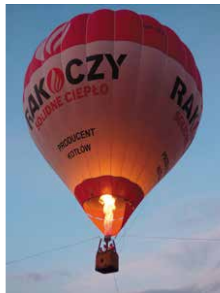
Można było wziąć udział w locie balonem.

Jak przystało na tradycję Biesiady Masłowskiej bardzo wiele działo się na scenie. W pierwszym bloku estradowym zaprezentowali się uzdolnieni mieszkańcy gminy Masłów. Imprezę otworzyła Młodzieżowa Orkiestra Dęta z Masłowa, która wystąpiła w swoich, pięknych nowych strojach zakupionych dzięki wsparciu funduszu sołectwiego. W wakacyjny klimat wprowadziły