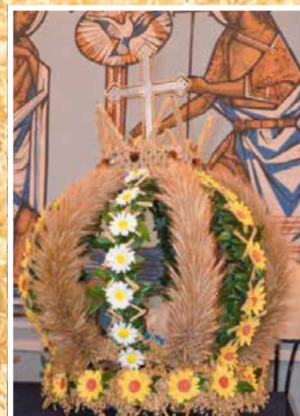
Zespół Pieśni i Tańca Ciekoty