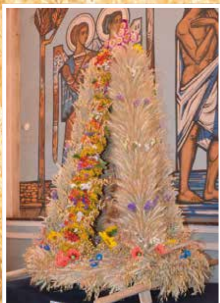
Lubrzanka z Mąchocic Kapitulnych