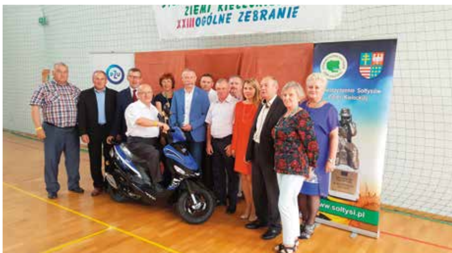
Nasza reprezentacja na Zjeździe Sołtysów Województwa Świętokrzyskiego w Wąchocku.