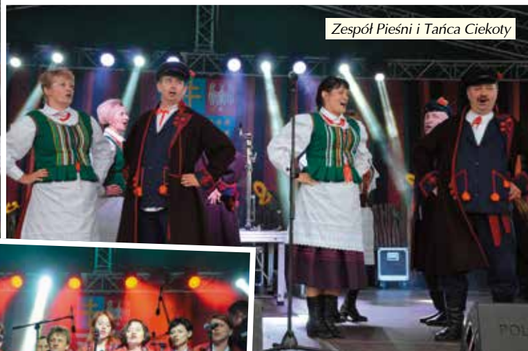
Zespół Pieśni i Tańca Ciekoty