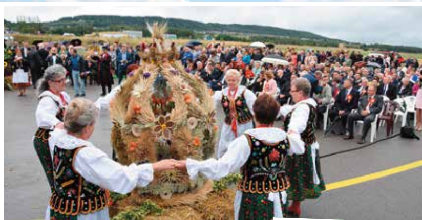
Każdy wieniec został obśpiewany, ale i obtańczony.