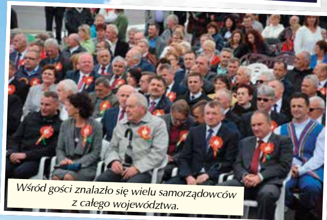
Wśród gości znalazło się wielu samorządowców z całego województwa.