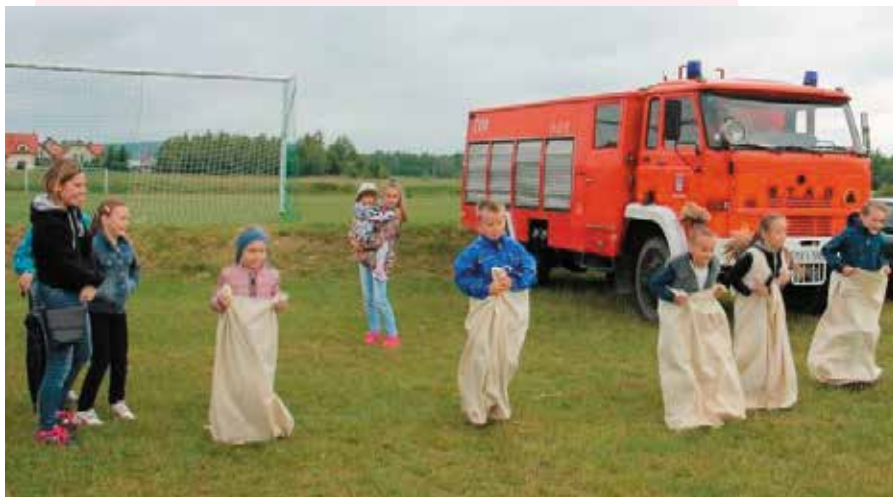
Podczas imprezy zorganizowano wiele ciekawych konkursów m.in. bieg w workach.