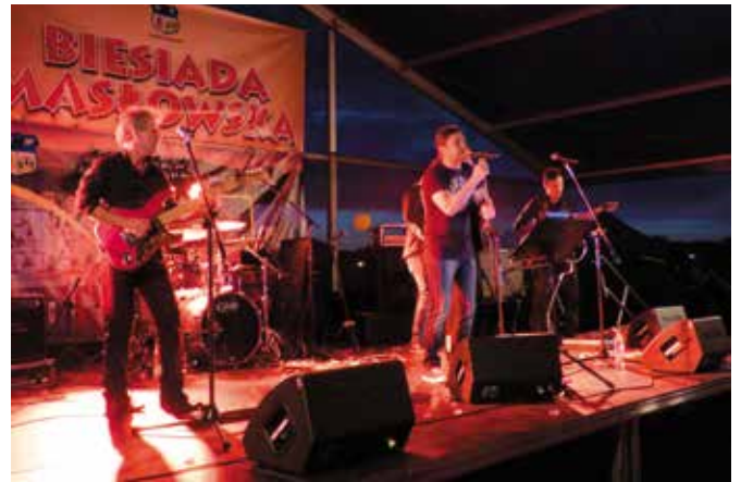
Gwiazdą wieczoru był zespół Sufler.