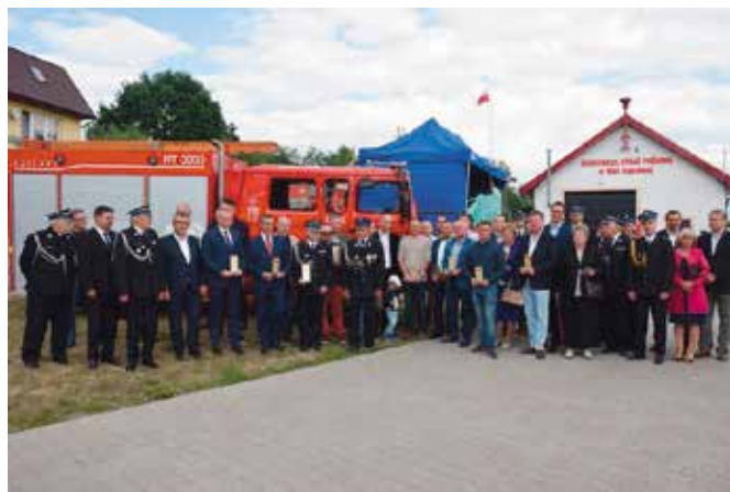
Na zakończenie uroczystości druhowie podziękowali wszystkim zaangażowanym w pomoc jednostce.