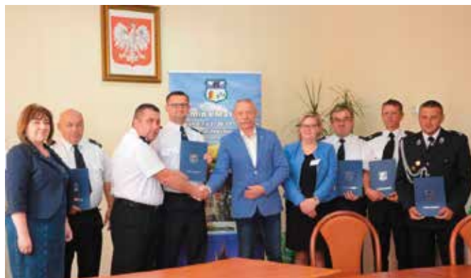
Umowy podpisali prezesi gminnych jednostek OSP.

Będzie pojawiać się na wszystkich materiałach promocyjnych