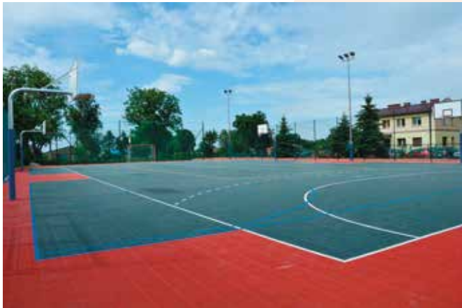
Tak prezentuje się nowy obiekt.

Budowa boiska to kolejny etap prac związanych z rewitalizacją centrum Masłowa i jednocześnie jedna z najbardziej wyczekiwanych inwestycji. Do tej pory brakowało w Masłowie boiska, na którym młodzież i dorośli mogliby pokopać piłkę, zagrać w siatkówkę czy koszykówkę. Mieszkańcy z sentymentem wspominali stare boisko mieszczące się naprzeciwko Urzędu Gminy, któremu wiele brakowało, a mimo to, przyciągało wielu miłośników sportu.