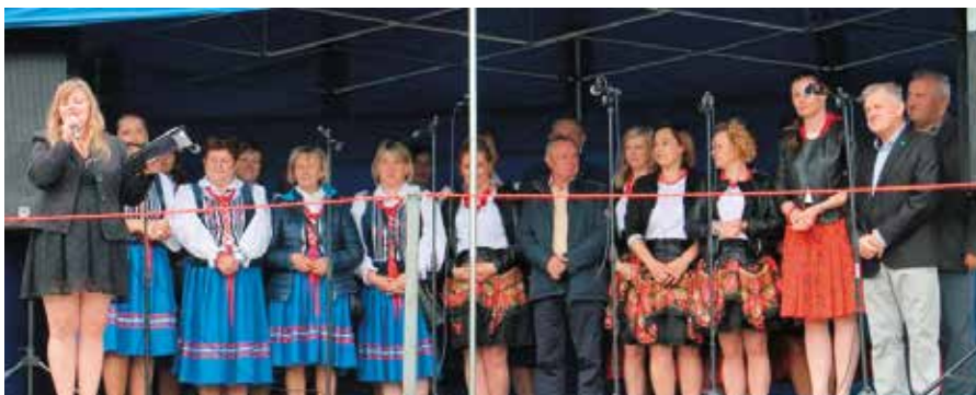
Festyn zorganizowano dzięki współpracy sołectw Barcza i Brzezinki.

Mnóstwo osób bawiło się w Brzezinkach na Pikniku Rodzinnym, który odbył się na miejscowym boisku.