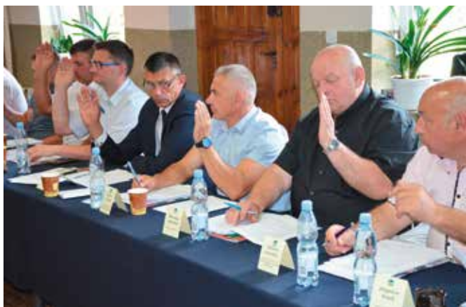
Jak na każdej sesji wprowadzano zmiany budżetowe.

Radni przyjęli projekt uchwał w sprawie zgody na przekazanie odcinka sieci wodociągowej oraz odcinka kanału sanitarnego w Domaszowicach wybudowanych przez prywatnego przedsiębiorcę. Oba odcinki zostaną przekazane w nieodpłatne użytkowanie przez Międzygminny Związek Wodociągów i Kanalizacji w Kielcach. Pozwoli to w przyszłości nowym mieszkańcom budującym domy w obrębie tej drogi na podłączenie do swoich posesji sieci wodociągowej i kanalizacyjnej. Wartość przekazanych odcinków wynosi ok. 200 tys. zł.