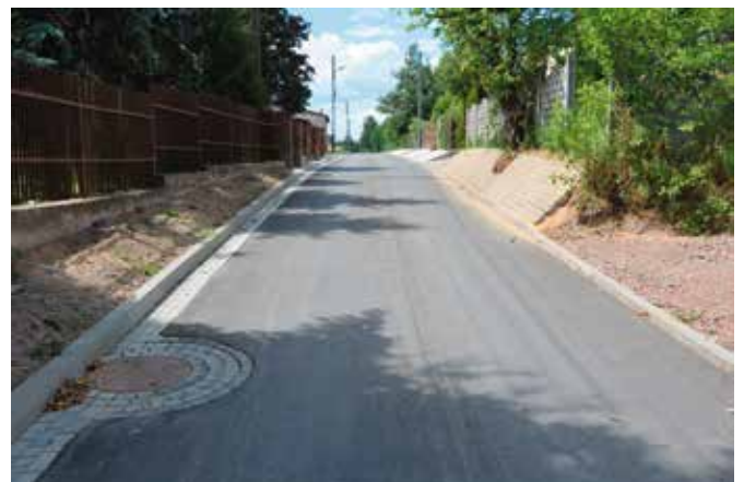
Inwestycja została współfinansowana z Programu Rozwoju Obszarów Wiejskich na lata 2014-2020.