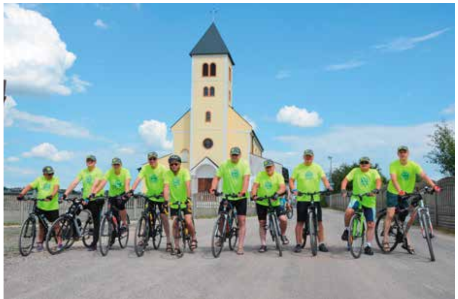
Nasi pątnicy tuż przed startem pielgrzymki.

Pielgrzymi planują pokonać ponad 800 km w zaledwie sześć dni odwiedzając po drodze takie miejsca jak: Łuków, Zamb-