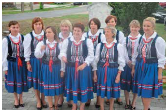
Brzezinianki na Węgrzech reprezentowały naszą gminę.