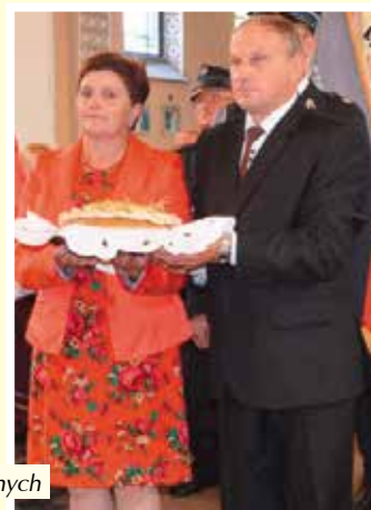
Starostowie Dożynek Gminnych