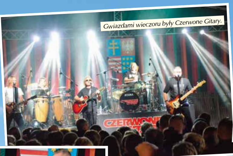
Gwiazdami wieczoru były Czerwone Gitary.