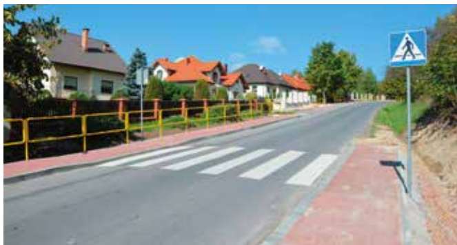
Dzięki świetnej współpracy ze Starostwem Powiatowym w Masłowie i Woli Kopcowej wybudowano nowe chodniki.

Wiele działa się również na drogach Gminy Masłów. Ekipy pojawiły się w miejscach, które wymagały niezwłocznej interwencji ze względu na ich stan pozostawiający wiele do życzenia. W ramach Narodowego Funduszu Przebudowy Dróg Lokalnych uzyskano pieniądze na przebudowę ul. Świerczyńskiej w Masłowie Pierwszym łącznie z rowami. Została zmodernizowana ul. Krajobrazowa w Masłowie Drugim, poprawiono stan dróg w Mąchocicach-Scholasterii i Barczy. Przebudowano drogi powiatowe w Masłowie Pierwszym,