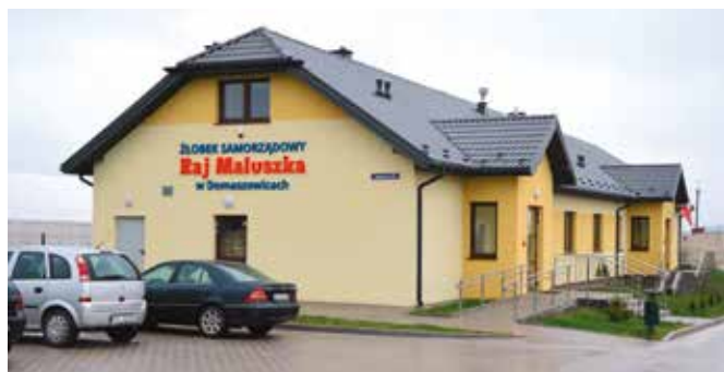
Młode mamy z gminy Masłów dzięki żłobkowi mogą wcześniej wrócić do pracy i nie martwić się o swoje pociechy.

W ciągu ostatnich lat zakończono wszystkie rozpoczęte budowy budynków użyteczności publicznej. W stanie surowym znajdowały się trzy ważne dla mieszkańców budynki. Po zakończeniu prac do budynku w Woli Kopcowej wprowadzili się strażacy z miejscowej jednostki OSP. W Dąbrowie otwarto świetlicę samorządową, która świetnie spełnia już swoją kulturalną funkcję. W Domaszowicach powstał Żłobek Samorządowy „Raj Maluszka”. Co ważne Gmina Masłów na uruchomienie żłobka jako jedna z czterech w województwie świętokrzyskim i 75-ciu w kraju otrzymała dofinansowanie z Ministerstwa Pracy i Polityki Społecznej na start placówki, z której korzysta 20 maluchów. Obiektem, jaki powstawał od podstaw jest budynek szatniowo-sanitarny przy boisku w Brzezinkach. Po latach drużyna MSS Klonówka ma miej-