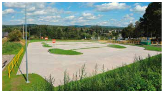
Budowa parkingu w Brzezinkach wpłynęła na poprawę bezpieczeństwa zarówno kierowców jak i osób korzystających z komunikacji autobusowej.

sportowe. Z nowego boiska można również korzystać po zmroku, dzięki zamontowaniu słupów oświetleniowych. Dodatkowo przy boisku znajduje się bieżnia na której można trenować biegi sprinterskie. Równie oczekiwana była budowa parkingu w Brzezinkach. Możliwa dzięki zamianie działek przez Urząd Gminy Masłów przy skrzyżowaniu dróg powiatowej i gminnej. Na placu oddanym do użytku jesienią znajdują się 54 regularne miejsca parkingowe, a docelowo miejsce może znaleźć na nim około 70 aut. Cały teren został oświetlony czterema dużymi lampami, które oświetlą całość miejsc parkingowych oraz przylegającą do nich zatokę autobusową wybudowaną jednocześnie z parkingiem. Co ważne, inwestycja znacząco wpłynie na poprawę bezpieczeństwa zarówno osób korzystających z parkingu jak i z komunikacji autobusowej.