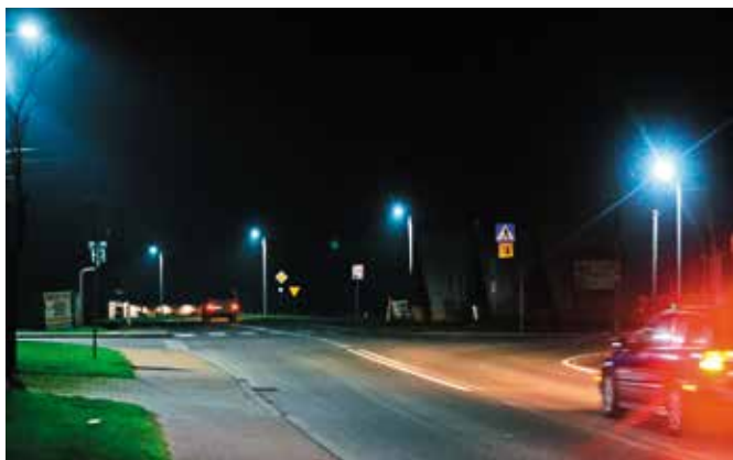
Zamontowanie nowego ledowego oświetlenia oznacza oszczędności w budżecie Gminy Masłów.

Jest jaśniej, bezpieczniej i oszczędniej. Gmina Masłów oświetlona jest całą dobę, na czym w żaden sposób nie cierpi budżet. Kilka tygodni temu zakończyła się realizacja pierwszej inwestycji możliwej dzięki finansowemu wsparciu w ramach Zintegrowanych Inwestycji Terytorialnych na terenie Kieleckiego Obszaru Funkcjonalnego (ZIT KOF) z Regionalnego Programu Operacyjnego Województwa Świętokrzyskiego na lata 2014 – 2020. Przygotowania do inwestycji rozpoczęły się już w ubiegłym roku.