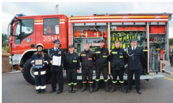
Średni samochód ratowniczo-gaśniczy Iveco Eurocargo 150EW został zakupiony dla OSP Masłów.

Duże znaczenie mają działania na rzecz zapewniania bezpieczeństwa, co oznacza, że na pomoc samorządu Gminy Masłów mogą liczyć jednostki OSP. Podczas Dożynek Wojewódzkich, jakie odbyły się na lotnisku w Masłowie, druhowie z jednostki OSP Masłów uroczystie odebrali nowy wóz bojowy. Średni samochód ra-