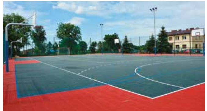
W centrum Masłowa wybudowano wielofunkcyjne boisko ze sztuczną nawierzchnią.

Za nami dwie ważne i oczekiwane inwestycje. Na przełomie czerwca i lipca 2017 roku do użytku zostało oddane boisko wielofunkcyjne w Masłowie. Nawierzchnia boiska składa się z płyt polipropylenowych, które umożliwiają grę w różne dyscypliny