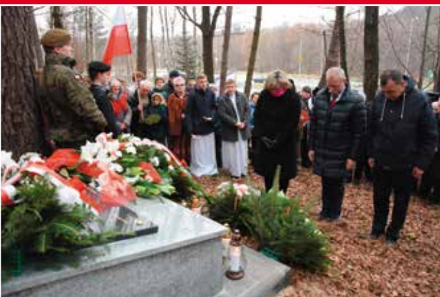
Na zakończenie uroczystości złożono kwiaty.