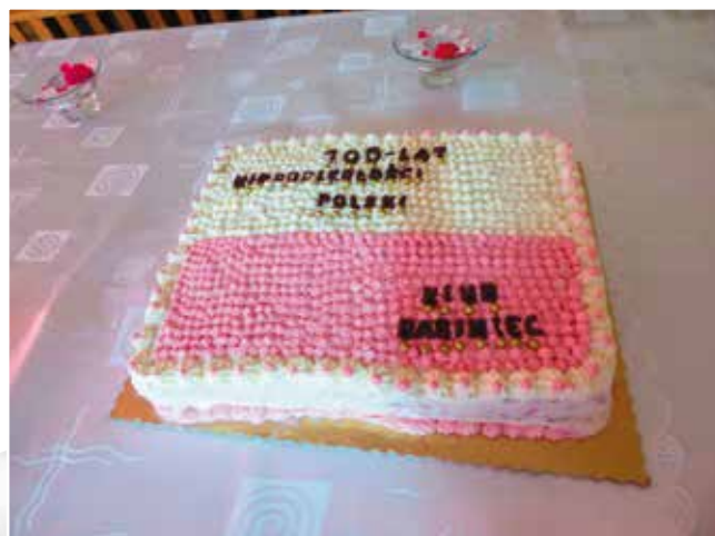
Słodki tort podzielono wśród wszystkich.