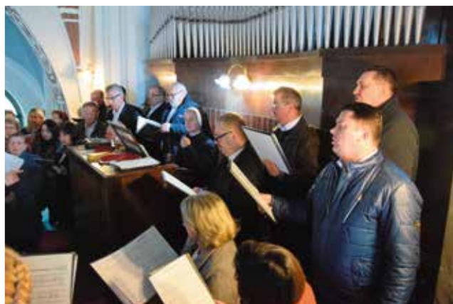
O oprawę liturgii zadbał Chór Masłowianie.