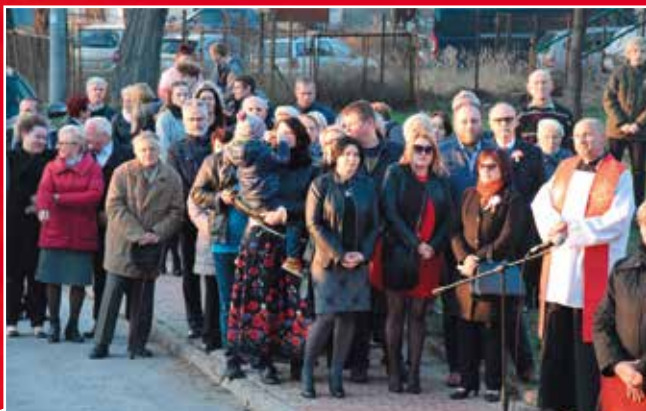
Uczestnicy spotkania przed pomnikiem.