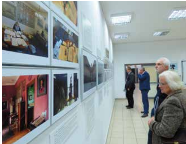
Wystawę można oglądać do 5 grudnia.

Wystawa powstała dzięki dofinansowaniu Ministra Kultury i Dziedzictwa Narodowego ze środków Funduszu Promocji Kultu-