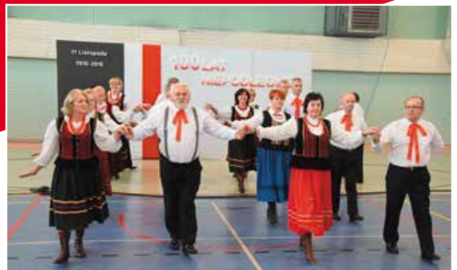
Poloneza odtarńczyli członkowie Chóru Masłowianie, Grupy Artystycznej Golica oraz Zespołu Pieśni i Tańca Ciekoty.