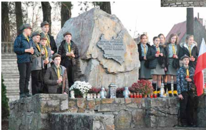
Wartę pełnili harcerze z 47 DH "Iskra" z Masłowa.