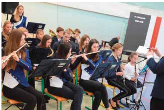
Młodzieżowa Orkiestra Dęta