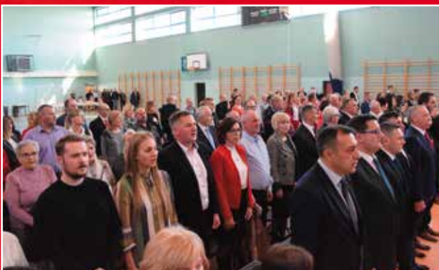
W samo południe odśpiewano „Mazurka Dąbrowskiego”.