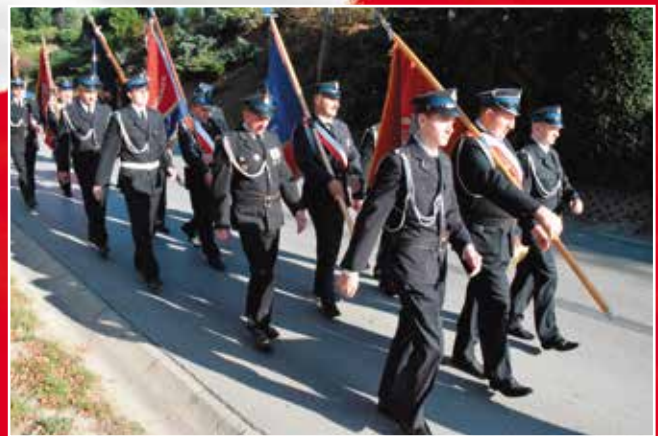
Pocztę sztandarową w drodze na uroczystości.