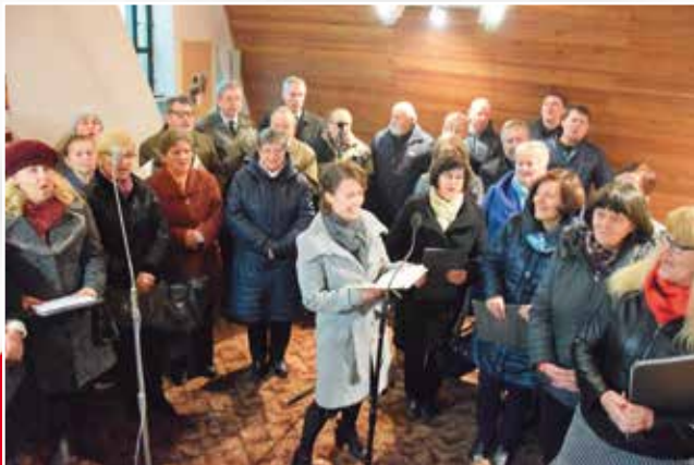
Podczas mszy świętej zaśpiewał Chór Masłowianie.