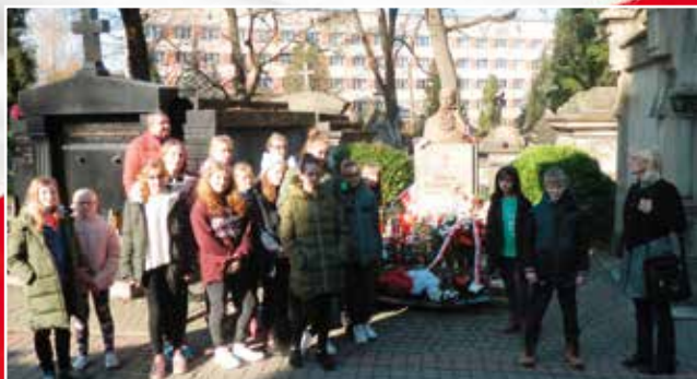
Nasza młodzież przed grobem Marii Konopnickiej na Cmentarzu Łyczakowskim we Lwowie.

Dużym przeżyciem było również zwiedzanie Zbraża, Dubna i Wiśniowca.