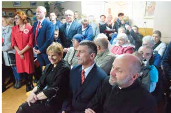
Uczestnicy spotkania w świetlicy.