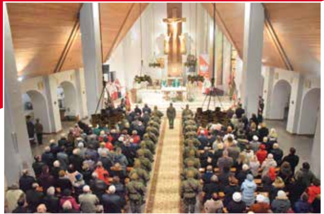
Uroczystości rozpoczęła msza święta odprawiona w kościele NMP Matki Kościoła w Dąbrowie.