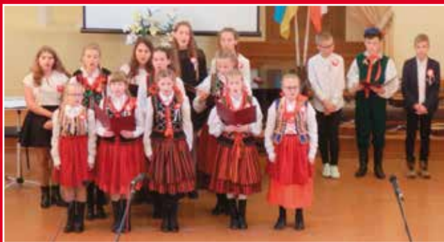
Czerwone Jagody zaśpiewały w Krzemieńcu podczas patriotycznego koncertu.