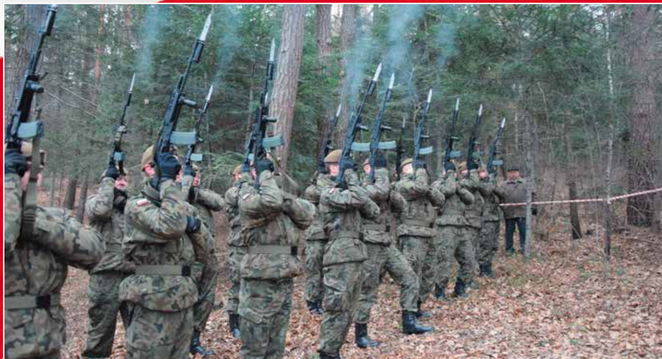
10. Brygada Żołnierzy Obrony Terytorialnej oddała salwę honorową.

Po modlitwie uroczystość przeniosła się na skraj Białej Góry, kilkaset metrów od kościoła. Przypomnijmy, że z ideą budowy pomnika do Gminy Masłów wyszła Grupa Inicjatywna