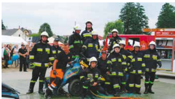
Druhowie spisali się na medal!

Na scenie wystąpiły m.in. Koło Gospodyń Wiejskich Kopcowianki z Woli Kopcowej. Na koniec na wszystkich czekała dyskoteka pod gwiazdami.