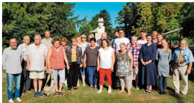
Masłowska delegacja z gospodarzami spotkania.