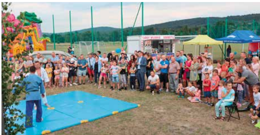
Pokazy karate cieszyły się wielkim zainteresowaniem.

Piękna pogoda i mnóstwo atrakcji sprawiły, że przybyli goście świetnie się bawili. Każdy z uczestników pikniku znalazł coś dla siebie. Były występy zespołów folklorystycznych m.in. KGW „Brzeziniarki” i KGW „Lubrzanki”. Zagrał niezawodny jak zawsze zespół country „Andrzej i Przyjaciele”. Prawdziwy tłum ściągnął pod scenę pokaz judo, były również pokazy pierwszej pomocy i modelarstwa. Dzieciaki mogły zwiedzić wóz strażacki i policyjny oraz poznać bliżej pracę tych jednostek. Najwięk-