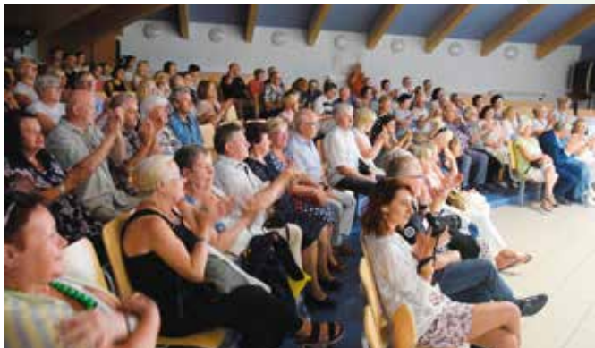
Na świętowanie imienin pisarza przyszło mnóstwo osób.