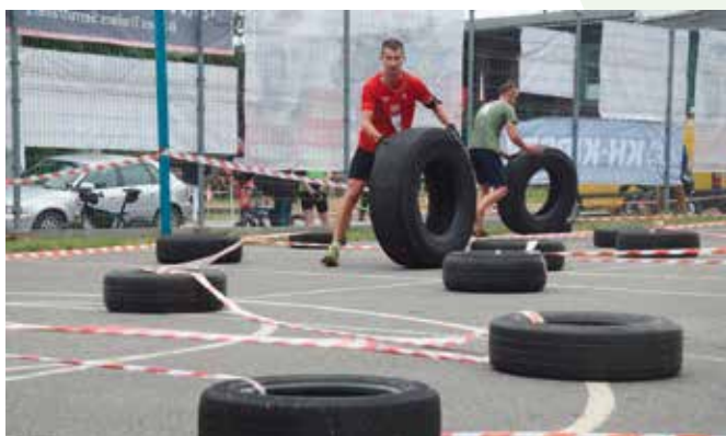
Zawodnicy musieli sobie poradzić ze slalomem z wielkimi oponami.