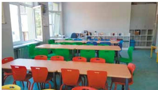
Remont przesył sale w szkole w Mąchociach Kapitulnych.

Szkoła Podstawowa im. Stefana Żeromskiego w Mąchociach-Scholasterii również objęta jest termomodernizacją. Prace trwają przy hali sportowej. W budynku szkolnym prowadzony jest remont mieszkania nauczycielskiego. Kolejne zadania planowane przez szkołę to korekta ustawienia ogrodzenia działki szkolnej i wyposażenie kuchni szkolnej z 80% udziałem środków pozyskanych z zewnątrz (MPIPS) w ramach programu „Posiłek w szkole i w domu”) oraz zakup pomocy dydaktycznych w ramach środków z rezerwy 0,4% Ministra Edukacji Narodowej. Ponadto zakupione zostały już książki do biblioteki szkolnej, w ramach Narodowego Programu Rozwoju Czytelnictwa. Od 1 września rozpocznie naukę 149 uczniów w klasach I-VIII i 60 dzieci w oddziałach przedszkolnych. Łącznie do szkoły przyjdzie 209 osób, co oznacza, że zwiększy się liczba uczniów o 11 osób. Kadra zatrudniona w szkole stanowi łącznie 37 osób.