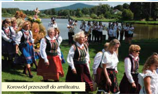
Korowód przeszedł do amfiteatru.