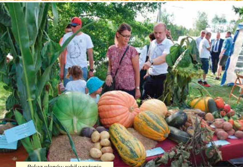
Pokaz plonów robił wrażenie.