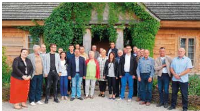
Ostatnim punktem było zwiedzenie dworku w Ciekotach.

Na trasie znalazły się m.in. szkoły, żłobek, PSZOK, świetlice, pomnik na Białej Górze. Ważnym elementem wyjazdu było również sprawdzenie stanu dróg. Zarówno tych, które zostały zmodernizowane oraz tych, które na to jeszcze czekają. W czasie spotkania plenernego omawiano problemy i zagadnienia z zakresu oświetlenia ulicznego, kanalizacji, przebudowy dróg, ścieżki rowerowej, rozbudowy niektórych świetlic, modernizacji placówek oświatowych, oraz wiele innych.