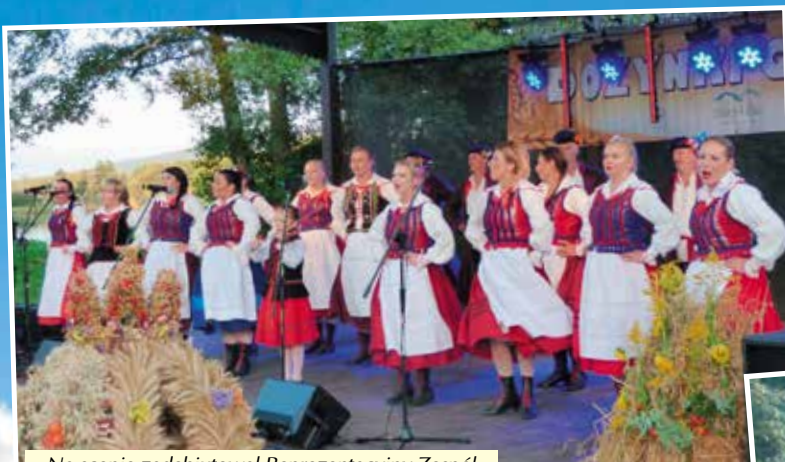
Na scenie zadebiutował Reprezentacyjny Zespół Pieśni i Tańca "Żeromszczyzna".