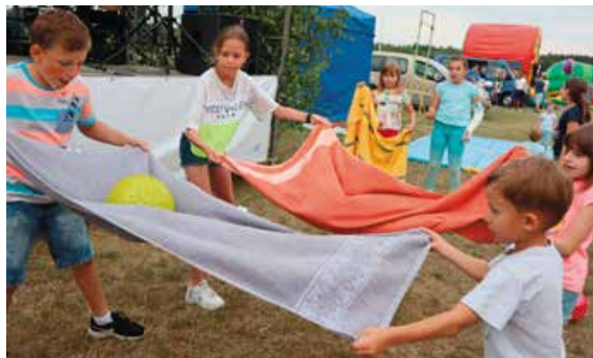
Na dzieci czekało wiele atrakcji i konkursów.