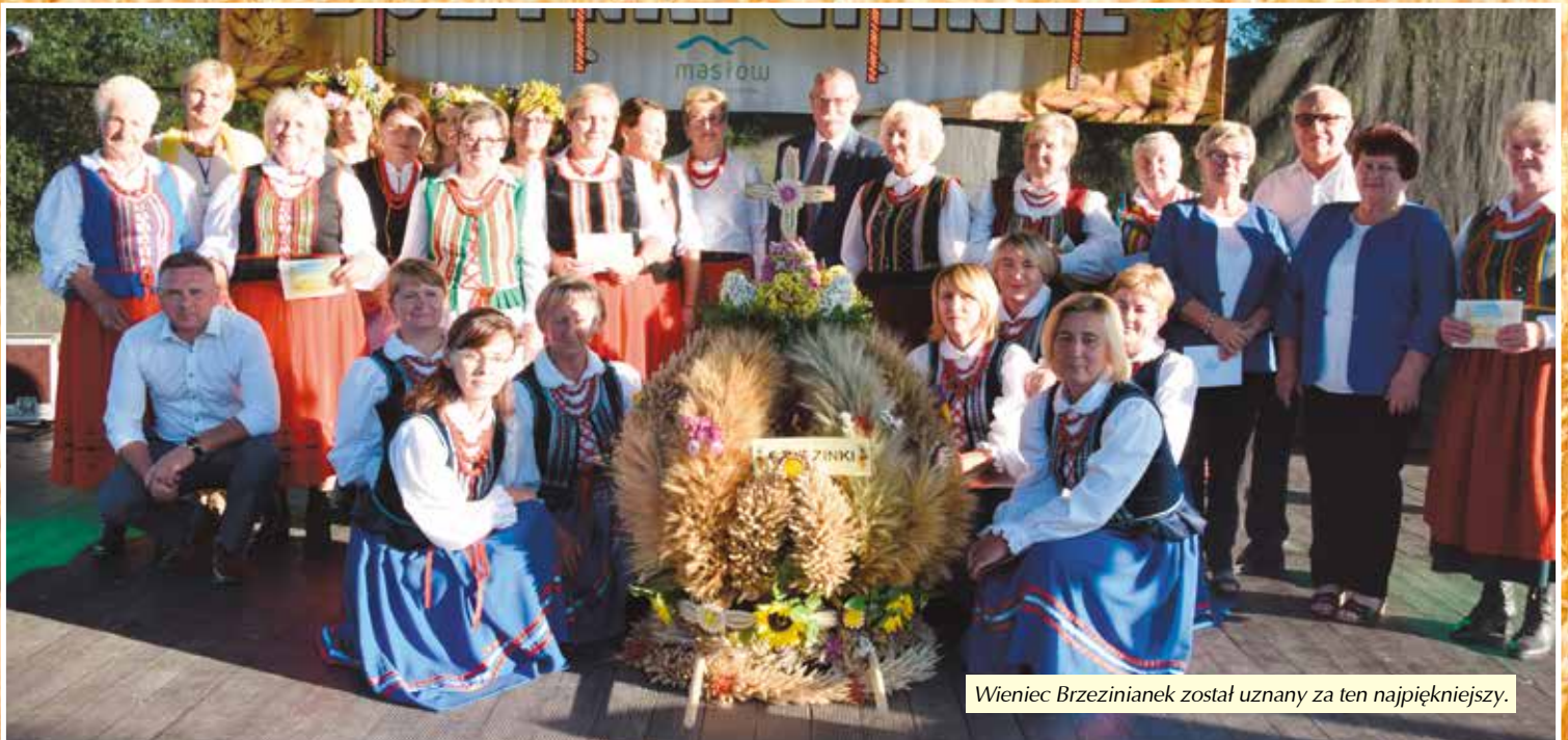
Wieniec Brzezinianek został uznany za ten najpiękniejszy.