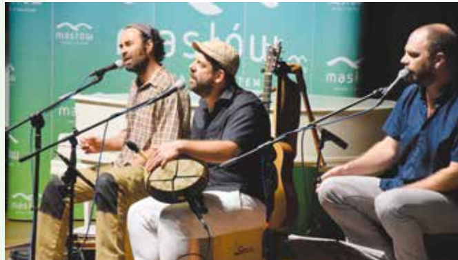
Trio Le Groupe du Coin dało znakomity koncert.