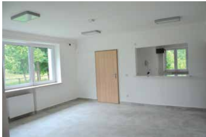
W ramach remontu wymieniono posadzkę.