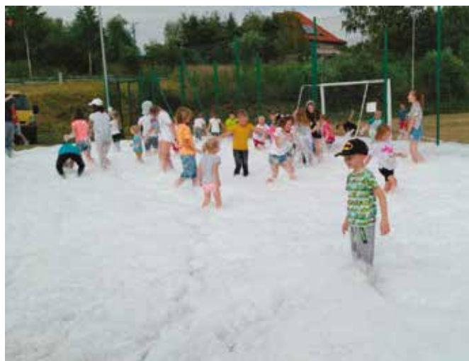
Zabawa w pianie była świetna.

Dużym zainteresowaniem cieszyło się stoisko z pierwszą pomocą, gdzie można było oglądać sprzęt do ratownictwa oraz zdobyć podstawową wiedzę z zakresu kwalifikowanej pierwszej pomocy. Zaprezentowano również pokaz cięcia auta z udziałem OSP Wola Kopcowa. Można było także obejrzeć strażacki sprzęt historyczny oraz ten używany współcześnie. Na wszystkich czekał również poczęstunek.