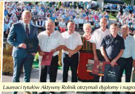
Laureaci tytułów Aktywny Rolnik otrzymali dyplomy i nagrody