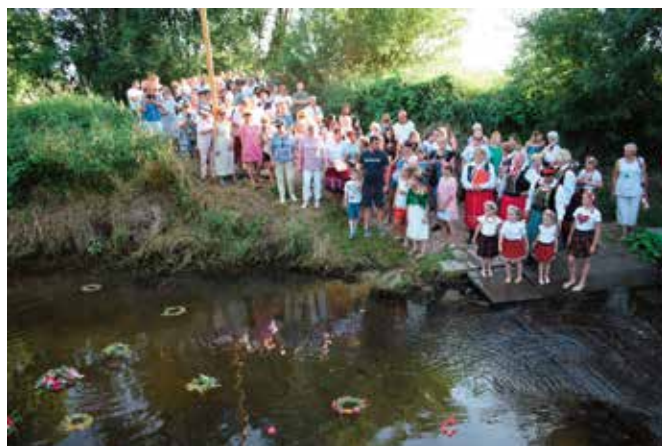
Wydarzenie nad brzeg rzeki przyciągnęło mnóstwo osób.

Po przywitaniu wszystkich gości i sponsorów odbyły się pierwsze występy, po których uroczysty korowód udał się nad rzekę puszczać wianki. Niejednej pani (nie wiadomo dlaczego!) pojawiły się w tym momencie łzy w oczach:) Następnie wszyscy przybyli w tym dniu na „mąchockie błonia” mogli skosztować pyszności przyrządzonych przez nasze KGW, a także zjeść smaczną kielbaskę serwowaną przez druhow z OSP Mąchoć Kapitulne.