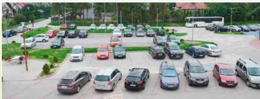
Tak wygląda parking przy Urzędzie Gminy po przebudowie.

To duże udogodnienie dla klientów Urzędu Gminy, sportowców korzystających z hali oraz rodziców odwożących dzieci do szkoły. Parking właśnie został oddany kierowcom. Rozbudowa objęła przygotowanie ok. 50 miejsc parkingowych dla samochodów osobowych oraz 5 na autokary. Powstały również miejsca dla niepełnosprawnych oraz tych, którzy do urzędu przyjadą na rowerach. Stoi też nowoczesny interaktywny słup oświetleniowy, który został zlokalizowany obok miejsca ze stolikiem i krzesłami, gdzie będzie można np. wypełnić niezbędne dokumenty. Nowe miejsca parkingowe mają zapewnić kom-