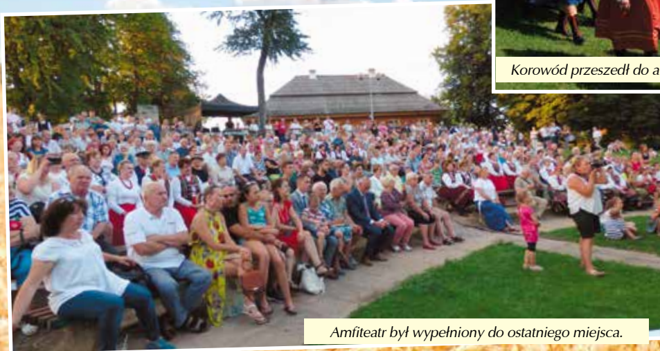
Amfiteatr był wypełniony do ostatniego miejsca.