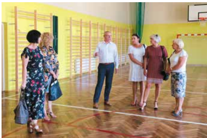
Objazd obejmował wszystkie szkoły.

Spotkanie osób odpowiedzialnych za funkcjonowanie oświaty w gminie Masłów rozpoczęło podsumowanie pracy szkół w roku 2018/2019. Dokonano tego na podstawie analizy wyników nauczania przygotowanej w skali gminy oraz szczegółowych danych przedstawionych przez dyrektorów. Wspólnie szukano rozwiązań i wyciągano wnioski do lepszej pracy w nowym roku szkolnym. W okresie wakacji przeprowadzono niezbędne działania do funkcjonowania szkół. Wybrano m.in. firmę świadczącą usługi dowozu dzieci do szkół, czy dostawcy oleju grzewczego. W placówkach były również przeprowadzone prace remontowe oraz potrzebne zakupy.