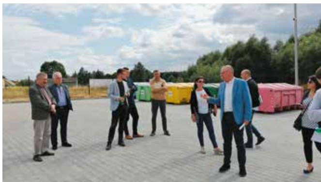
Na terenie PSZOK-u w Dąbrowie.