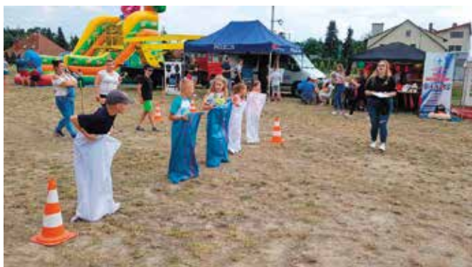
Bieg w workach wyłonił najlepszych.