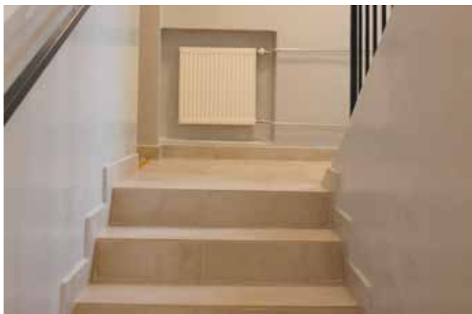
Wyremontowano klatkę schodową.