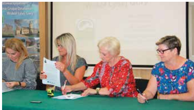
Dzięki podpisanym umowom część z wydarzeń już mogła się odbyć.

Umowy powierzenia grantów dotyczyły przedsięwzięć: I.1.3 Systemy i narzędzia promocji i/lub sprzedaży oferty produktów,