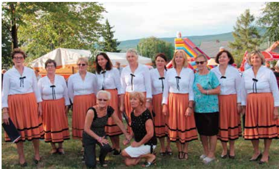
Nowe Masłowianki były gospodyniami festynu.