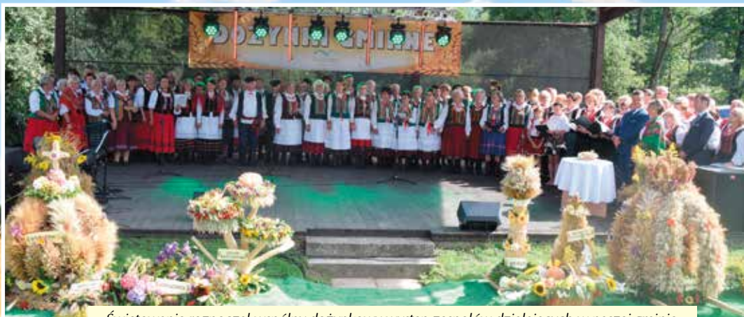
Świętowanie rozpoczęła wspólny dożynkowy występ zespołów działających w naszej gminie.