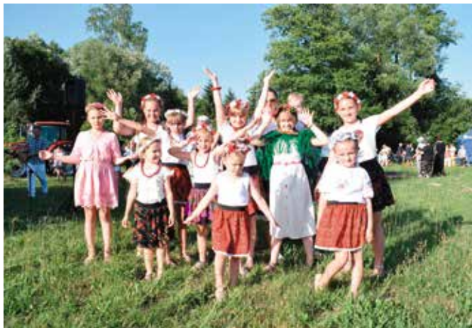
To było międzypokoleniowe święto.

Konkursom, grom i zabawom nie było końca. Nawet komary nie były nam straszne i muzyka serwowana przez DJ-a płynęła