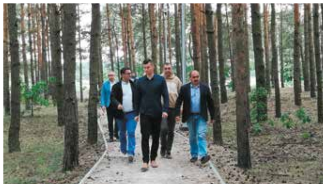
Spacer nowymi alejkami w Lesie Wolskim.