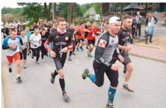
Jedną z konkurencji był bieg.