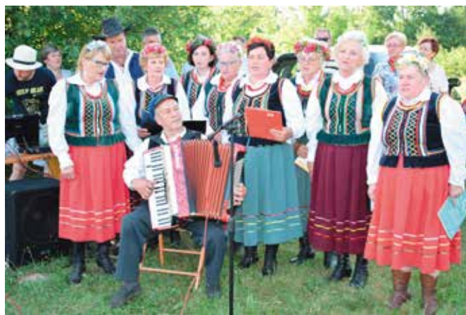
Zaśpiewały panie z KGW Lubrzanka.

z głośników jeszcze długo po zapadnięciu zmroku. Dziękujemy wszystkim, którzy przyczynili się do organizacji naszego wydarzenia. Dziękujemy sponsorom i dziękujemy Wam za tak liczne przybycie. Organizatorami wydarzenia było Stowarzyszenie -Wspólnie dla Tradycji, Koło Gospodyń Wiejskich Lubrzanka, Radni, Sołtys i Rada Sołecka Mąchocic Kapitulnych oraz Ochotnicza Straż Pożarna z Mąchocic Kapitulnych