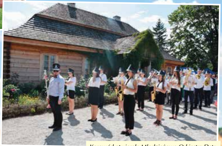
Korowód otwierała Młodzieżowa Orkiestra Dęta.

Mieszkańcy gminy Masłów dziękowali za plony podczas Dożynek Gminnych, które odbyły się w amfiteatrze na Żeromszczyźnie w Ciekotach. Po raz pierwszy przyznano honorowe tytuły Aktywny Rolnik, które trafiły do wyróżniających się w pracy na roli.