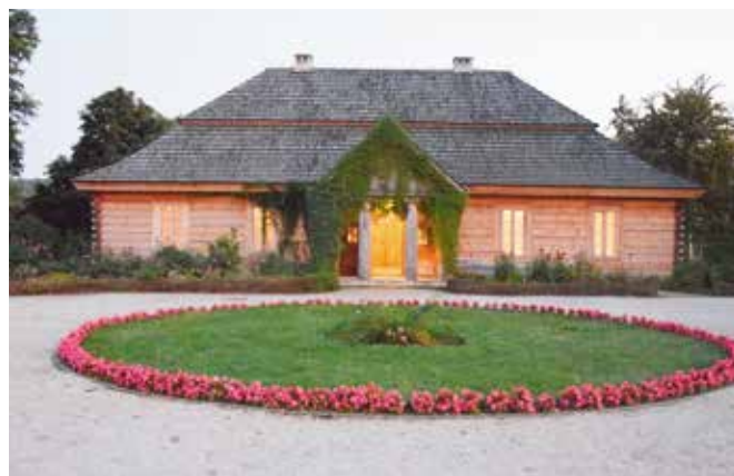
Dworek Stefana Żeromskiego w Ciekotach jest często odwiedzany przez turystów.

To dla nas bardzo dobre wiadomości. Co roku podejmujemy szereg działań, by turyści czuli się u nas jak najlepiej i wybierali naszą gminę jako miejsce noclegowe, a tych o zróżnicowanej klasie ciągle przybywa – komentuje wójt Tomasz Łato . - Dysponujemy świetnie oznakowanymi szlakami turystycznymi, z których można podziwiać najpiękniejsze widoki Gór Świętokrzyskich. Przed, po lub w trakcie spacerów zapraszamy do odwiedzenia Ciekot z dworkiem Stefana Żeromskiego, by choć na kilka chwil przenieść się do czasów, kiedy pisarz spędzał tu swoje młodość