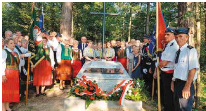
Pamiątkowe zdjęcie uczestników spotkania pod pomnikiem.