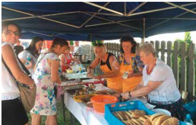
Można było spróbować 20 rodzajów ciast!