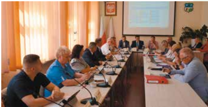
Najważniejszą sprawą rozstrzygniętą na sesji była sprawa o opiekę medyczną.

Sesja odbyła się w miniony czwartek w sali samorządowej Urzędu Gminy Małków. Najważniejszą uchwałą było wyrażenie zgody na dalszy wynajem budynków ośrodków zdrowia w Mąchocicach Kapitulnych i Małkowie na okres sześciu lat. Prowadzona będzie w nich działalność w zakresie ochrony zdrowia przez Centrum Medyczne „Zdrowie”, które od 1 sierpnia tego roku przejmuje obsługę pacjentów z terenu naszej gminy. Taki okres czasu został uznany za słuszny ze względu na długoletnią strategię rozwoju firmy, plany ubiegania się o środki unijne oraz rozszerzenie zakresu usług medycznych dostosowanych do oczekiwań mieszkańców.