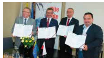
Umowa podpisana. Prace już są na kolejnym etapie.

Podpisana umowa obejmuje budowę kanału sanitarnego w sołectwie Mąchocice-Scholasteria. Przetarg wygrało Przedsiębiorstwo Robót Inżynieryjno-Budowlanych HYDROCOMPLEX z Buska-Zdroju. Wynagrodzenie wyniesie brutto 2 433 605,70 zł (netto 1 978 541,22 PLN).