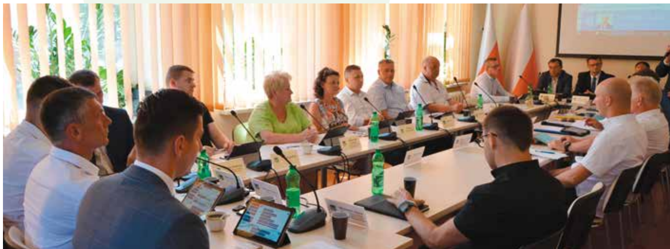
Sesję rozpoczęła debata nad raportem o stanie gminy Masłów za 2018 rok.

Radni zdecydowali o zaciągnięciu pożyczki w Wojewódzkim Funduszu Ochrony Środowiska i Gospodarki Wodnej w Kielcach na dofinansowanie zadania polegającego na wymianie źródeł ciepła w budynkach mieszkalnych. Wyrażono zgodę na przyjęcie darowizny dwóch działek w Domaszowicach, które zostaną wykorzystane pod poszerzenie drogi gminnej (ul. Pogodna). Radni wyrazili zgodę na wydzierżawienie części działki nr 154/2 o powierzchni 0,6984 ha położonej w Masłowie Pierwszym, obok przepompowni. Była to kontynuacja dzierżawy.