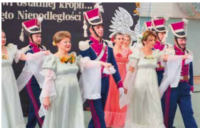
To był drugi występ Żeromszczyzny.