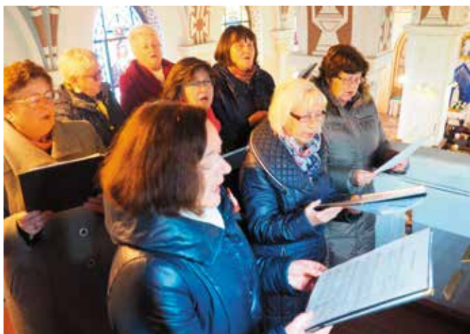
Podczas liturgii zaśpiewał Chór Małowanie.