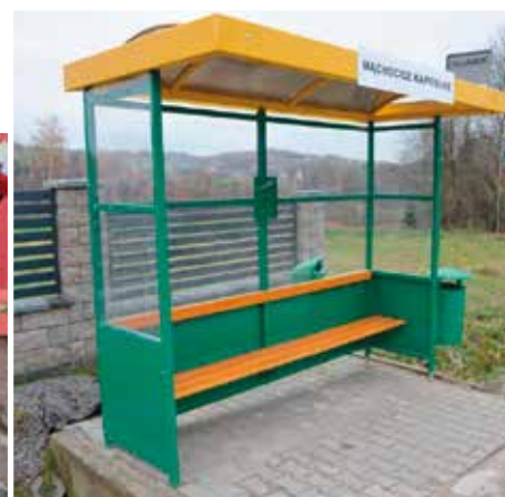
Ul. Górna – Mącholicie Kapitulne