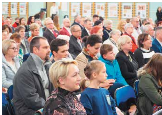
W uroczystościach wzięło udział wielu mieszkańców.