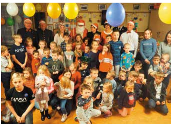
Pamiątkowa fotka z Mikołajem i pomocnikami w Wiśniówce.