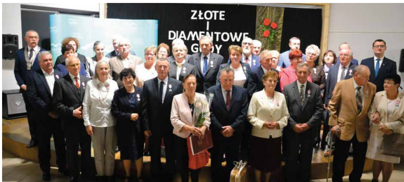
Odnaczeni pozowali do zdjęcia na scenie „Szklanego Domu”.