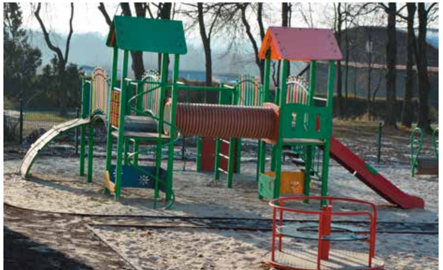
Do dyspozycji dzieci będą zjeżdżalnie i mała karuzela.

Dobrą wiadomością jest także to, że tuż przy placu zabaw dla najmłodszych powstała również ogrodzona siłownia zewnętrzna dla dorosłych. Zainteresowani ruchem na świeżym powietrzu będą mogli