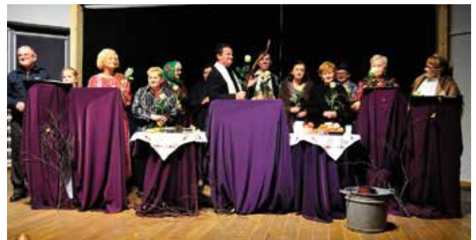
Grupa Lubrzanka została nagrodzona głośnymi brawami.