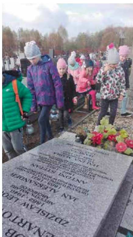
Uczniowie z Masłowa i Woli Kopcowej odwiedzili grób rodziny Lenartowiczów na cmentarzu w Masłowie.