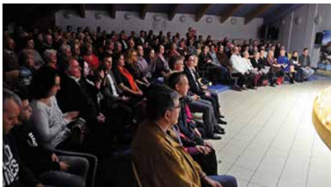
Premierę obejrzał komplet publiczności.