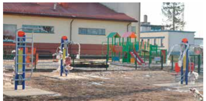
Dorośli będą mogli skorzystać z siłowni napowietrznej.