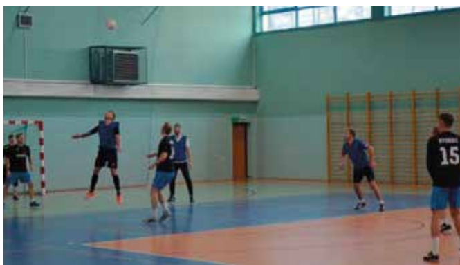
Rywalizacja była zacięta.