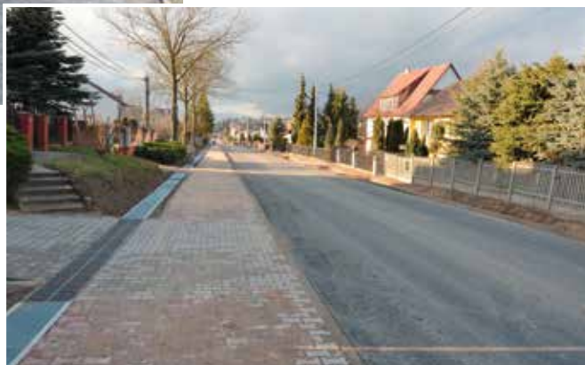
Część prac przy ul. Krajobrazowej została już wykonana.

Całość inwestycji wyniesie ponad 4 mln zł, 50 % wydatków będzie pochodzić z budżetu państwa natomiast pozostała część po połowie z budżetów Gminy Masłów i Powiatu Kieleckiego.