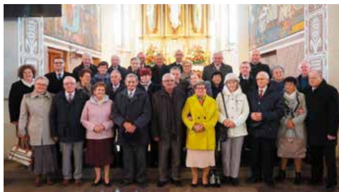
Tradycyjne już zdjęcie przez ołtarzem masłowskiego kościoła wszystkich jubilatów oraz zaproszonych gości.