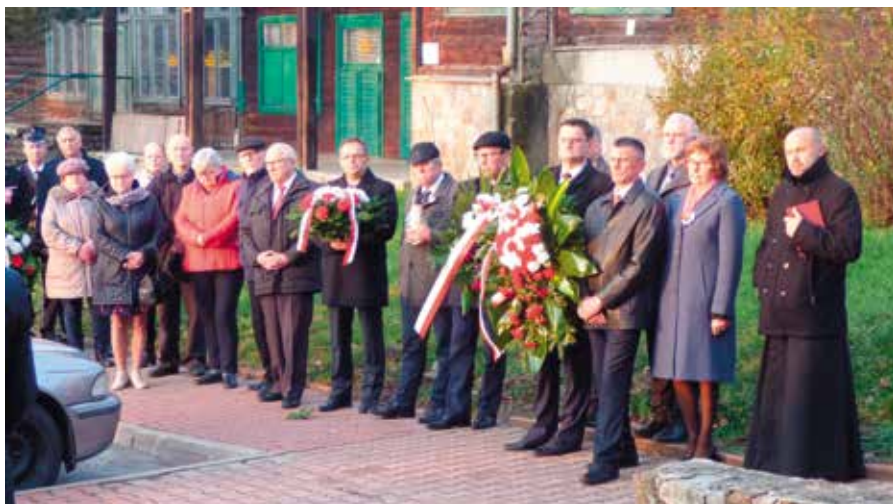
Delegacje przed pomnikiem.