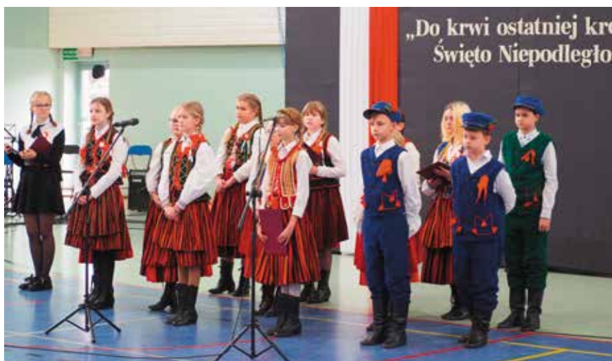
Czerwone Jagody ze Szkoły Podstawowej im. Stefana Żeromskiego w Mącholicach-Scholasterii.