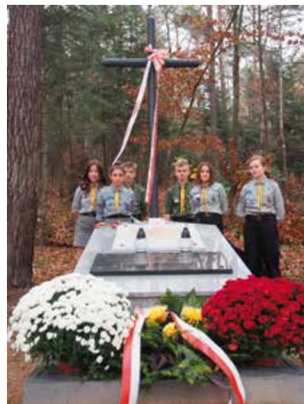
Harcerze z Masłowa przed pomnikiem w Dąbrowie.