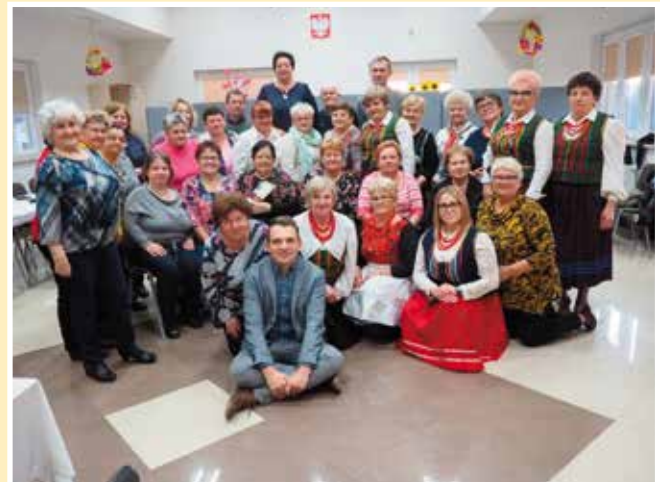
Pamiątkowe zdjęcie uczestników spotkania.