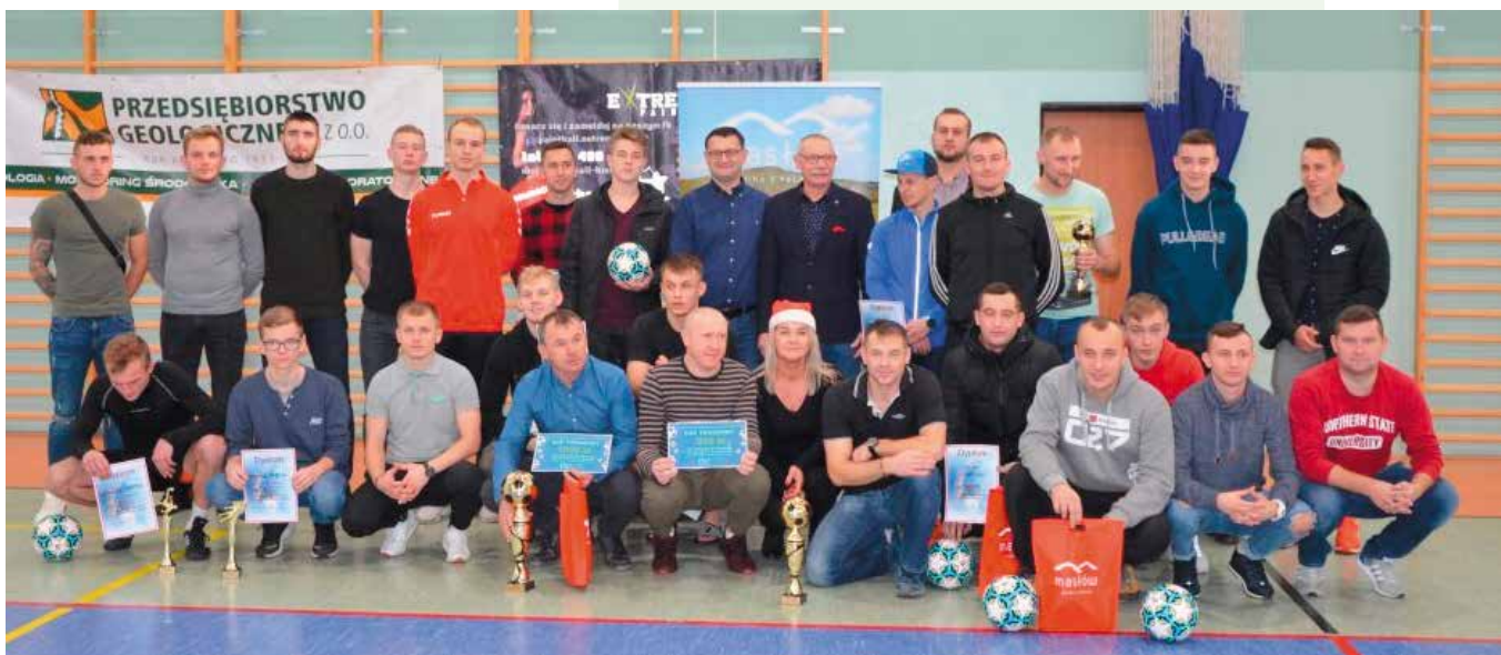
Pamiątkowe zdjęcie na finał turnieju.