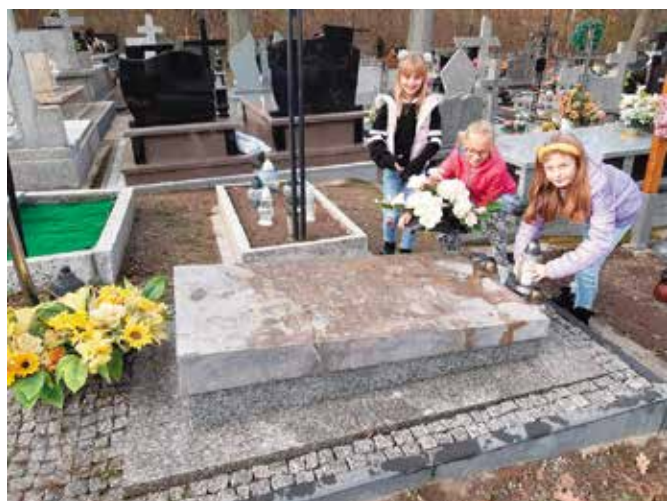
Uczniowie z Mąchocic Kapitulnych przed grobem babki Marii Skłodowskiej-Curie w Leszczynach.