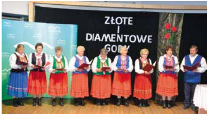
Na scenie Domaszowianki.