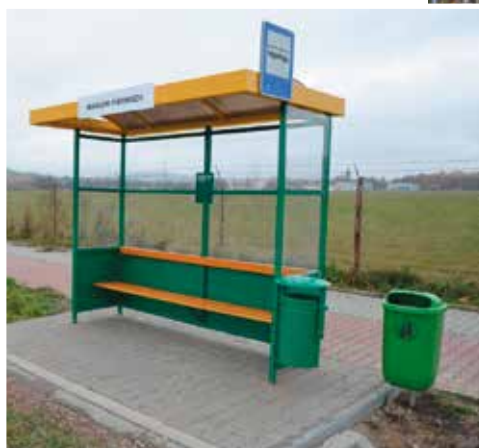
Ul. Lotnicza – Masłów Pierwszy