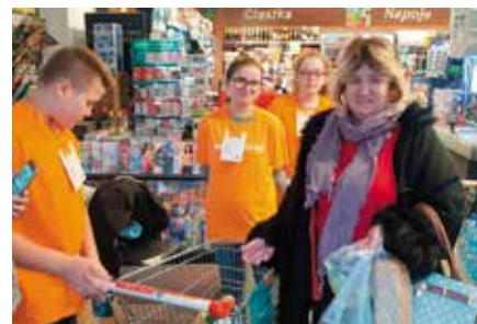
Wolontariusze z Masłowa spisali się na medal.

Przedświąteczna zbiórka żywności powoli staje się już tradycją. Dzięki niej osoby potrzebujące otrzymują niezbędne dla nich wsparcie w tym pięknym, ale jednocześnie trudnym finansowo okresie tuż przed świętami. Po raz kolejny klienci marketu SPAR w Masłowie Pierwszym podczas swoich codziennych zakupów mogli podzielić się produktami żywnościowymi, które trafią dla osób najbardziej potrzebujących. W zbiórce czynnie uczestniczyli uczniowie ze szkoły podstawowej w Masłowie Pierwszym, działający w Szkolnym