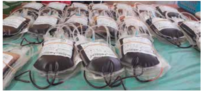
W tym roku odbyły się dwie akcje, podczas których udało się zebrać blisko 30 litrów krwi.

Jest to wspólna inicjatywa sołtysa i radnego ale ogromnie w działaniach wspierają ich druhowie z miejscowej jednostki OSP. Zapewniają odpowiednie zaplecze dla lekarza i pielęgniarek i co najważniejsze oddają krew. Szczególne podziękowania należą się jednak wszystkim, którzy przychodzą, by podzielić się częścią siebie. To