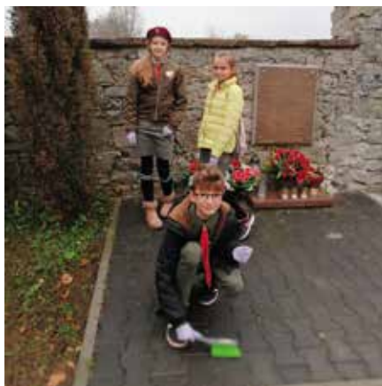
Harcerze z Mąchocic-Scholasterii przed tablicą pamiątkową rodziców Stefana Żeromskiego na cmentarzu w Leszczynach.