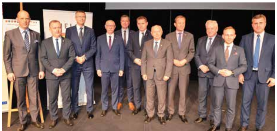
Wszyscy władze z Kieleckiego Obszaru Funkcjonalnego deklarują wspólne działania na rzecz czystego powietrza.

Mając na uwadze pogłębianie wiedzy wśród społeczności lokalnych na temat źródeł zanieczyszczenia powietrza, zorganizowano „Dzień Czystego Powietrza”. W ramach otwarcia Gminy KOF (Kieleckiego Obszaru Funkcjonalnego) podpisały deklarację na rzecz ochrony powietrza przed zanieczyszczeniami. Dodatkowo zaplanowano również szereg działań edukacyjno-informacyjnych dla dzieci i młodzieży.