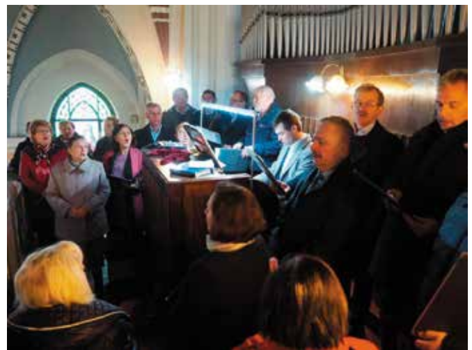
Podczas mszy świętej zaśpiewał Chór Małowianie.