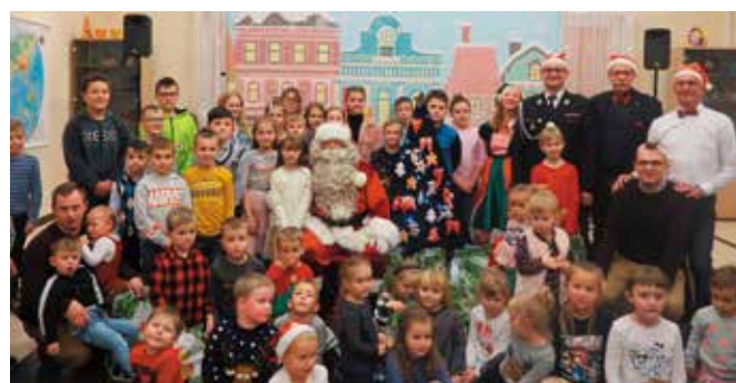
Dzieciaki i goście pozowali z Mikołajem w Dolinie Marczakowej.