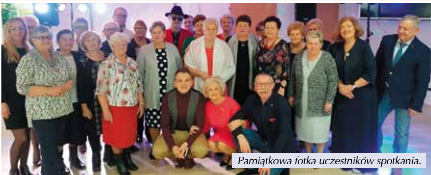
Pamiątkowa fotka uczestników spotkania.