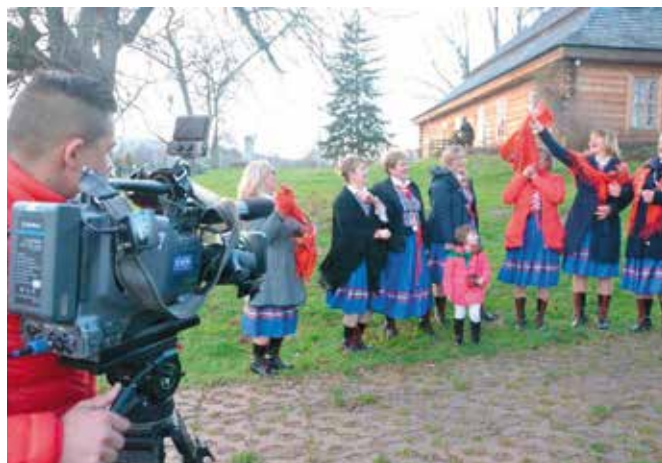
Wideo promowano na antenach TVP.