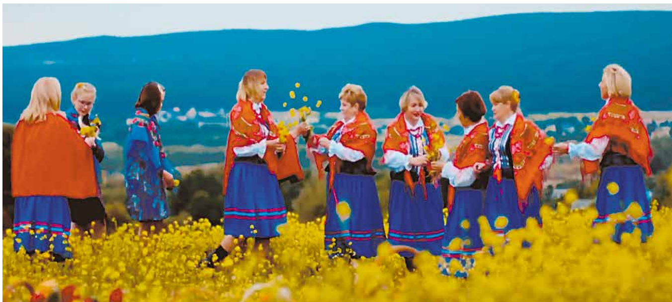
Kadr z teledysku „Gaiczek zielony”.

Teledysk ludowej grupy Brzezinianki do piosenki „Gaiczek zielony” odtworzono już w serwisie You Tube ponad 2,5 tysiąca razy. To debiutancki klip zespołu działającego przy Centrum Edukacji i Kultury „Szklany Dom” w Ciekotach, w gminie Masłów.