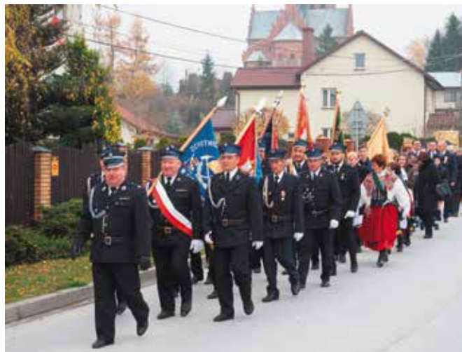
Strażacy poprowadzili przemarsz do hali sportowej.