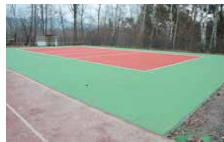
Prace potrwać do końca tego roku.

publiczne” Regionalnego Programu Operacyjnego Województwa Świętokrzyskiego na lata 2014-2020.