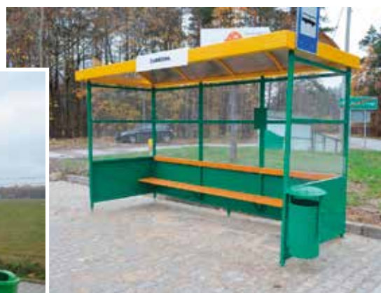
Ul. Leśna pętla - Dąbrowa