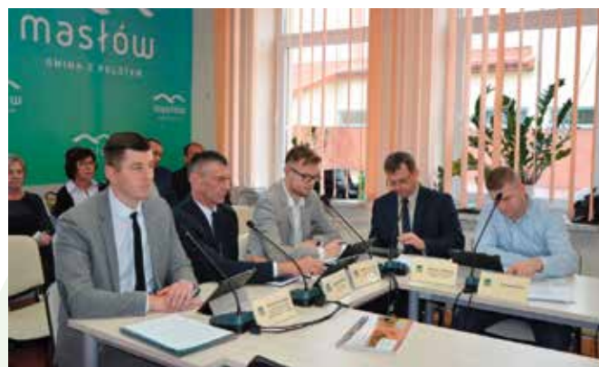
Rada Gminy zebrała się już po raz 13. w tej kadencji.

Rada Gminy uporządkowała uchwały dotyczące udzielania wsparcia finansowego na szereg zadań dla Powiatu Kieleckiego. Wśród nich były zadania drogowe m.in. umocnienie rowu odwadniającego drogę powiatową w Domaszowicach. Zmieniono czas