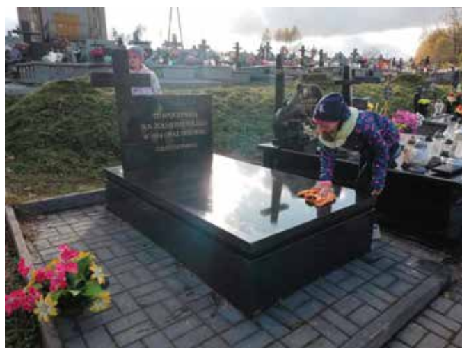
Harcerze z Brzezinek porządkowali groby żołnierzy na miejscowym cmentarzu.