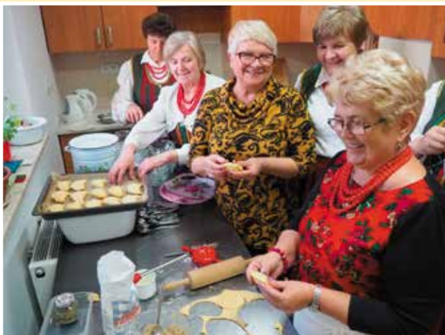
Centrum wydarzeń była kuchnia!