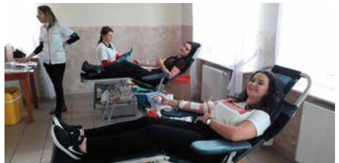
Chęć pomagania i uśmiech to klucz powodzenia tej akcji.