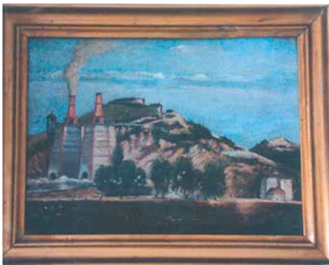
Wapiennik w Kadzielni. (1903 r.)