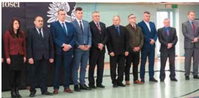
...oraz radnych oraz sołtysów, którzy przyjęli zaproszenie na obchody.