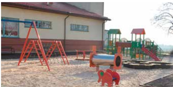
Będzie to doskonałe miejsce zabaw dla najmłodszych mieszkańców.