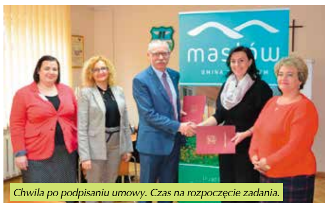
Chwila po podpisaniu umowy. Czas na rozpoczęcie zadania.

Zadanie realizowane w ramach projektu pn. „Rozwój infrastruktury szkolnej w Mącholicach Kapitulnych”. Projekt współfinansowany z Europejskiego Funduszu Rozwoju Regionalnego w ramach działania 7.4 „Rozwój infrastruktury edukacyjnej i szkoleniowej” oś 7 „Sprawne usługi publiczne”, Regionalnego Progra-