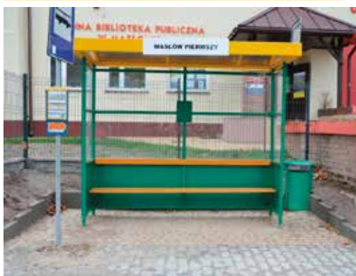
Ul. Ks. J. Marszałka – Masłów Pierwszy