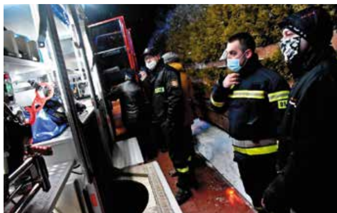
Każdy chętny mógł zapoznać się ze sprzętem, jaki posiada wóz.