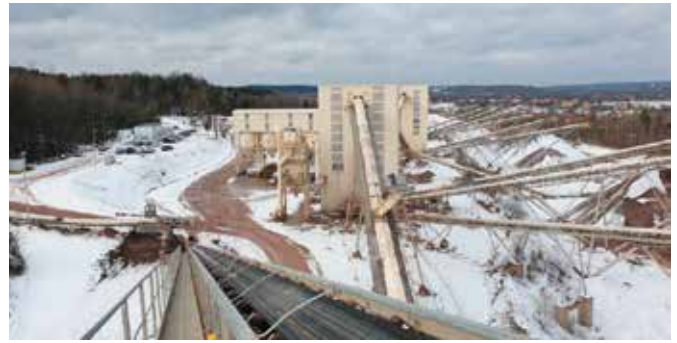
Okres zimowy to we wszystkich kopalniach Eurovia czas remontów i przeglądu instalacji.

Okres zimowy to we wszystkich kopalniach Eurovia czas remontów i przeglądu instalacji. Wtedy właśnie wszystkie siły i dostępne zasoby angażowane są w usprawnianie elementów zakładów przerobczych oraz realizację zaplanowanych inwestycji, w tym także inwestycji pro-środowiskowych.