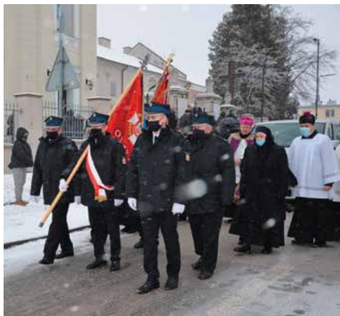
Kondukt otwierali druhowie z gminy Masłów.