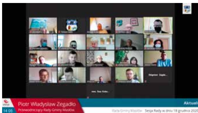
Radni obradowali zdalnie.

dowy oświetlenia zostaną przygotowane dla: ul. Panoramicznej w Masłowie Drugim, ul. Spokojnej w Masłowie Pierwszym.