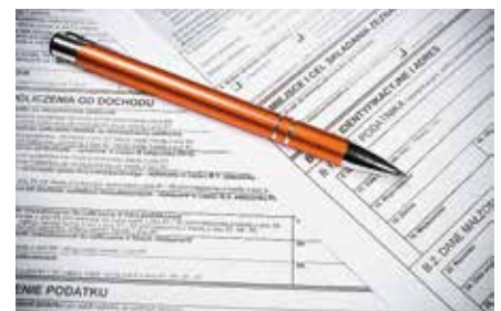
Twoje podatki wrócą do Ciebie, jeśli w zeznaniu podatkowym wskażesz, jako miejsce zamieszkania gminę Masłów.

Należy pamiętać, żeby o zmianie urzędu skarbowego powiadomić pracodawcę.