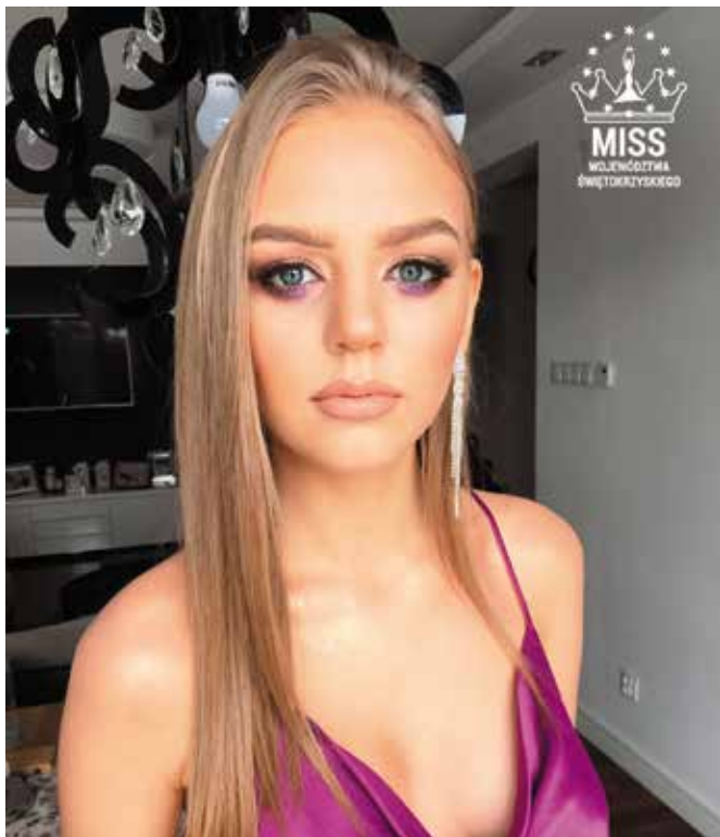
Jak przyznaje nasza miss z sesji zdjęciowych czerpie wiele radości.

nie wiem, co dokładnie przyniesie przyszłość choć za kilka lat widzę się bardziej na studiach prawniczych niż na wybiegu.