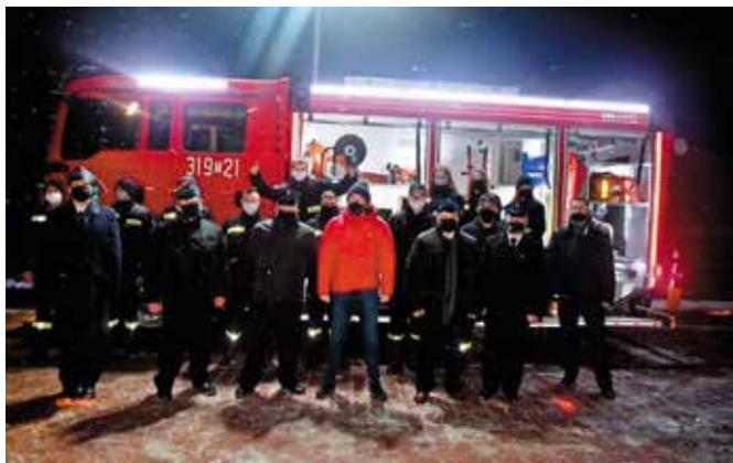
Pamiętkowe zdjęcie zakończyło oficjalną część powitania.

To już drugi w ciągu ostatnich miesięcy nowy wóz strażacki, który trafił do gminy Masłów. Do jednostki OSP Ciekoty przyjechał średni wóz ratowniczo-gaśniczy. Druhowie, mieszkańcy, goście witali go szpalerem płonących rac i wystrzałami fajerwerków!