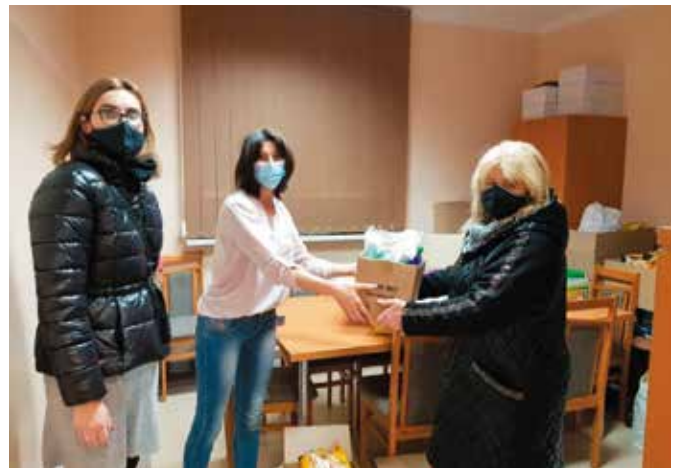
Pod koniec roku GOPS zorganizował dwie zbiórki żywności.

- Bardzo serdecznie dziękujemy wszystkim za wsparcie naszej akcji „Pomocnicy św. Mikołaja” bo to dzięki Wam my mogli-