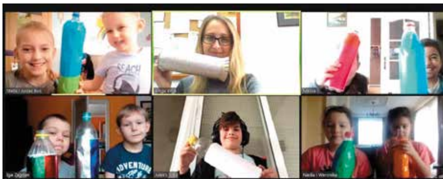
To były pierwsze takie ferie w historii świetlic i „Szklanego Domu”.

Na wszystkich czekały podróże po krajach związanych z kultowymi bajkami: po Japonii, Nowej Zelandii i Finlandii.