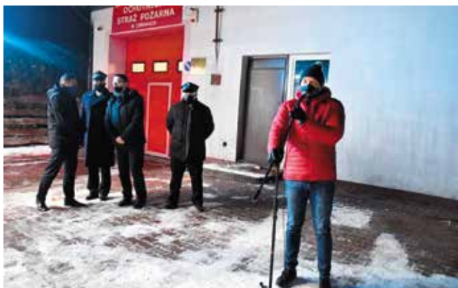
Powitanie wozu odbyło się przed ciekocką remizą.