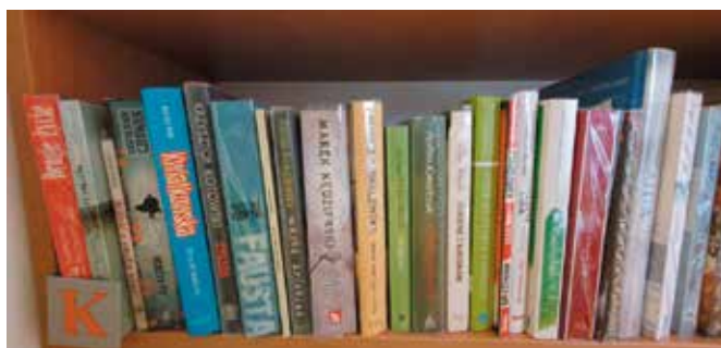
Lubisz wypożyczać i czytać książki? Ten konkurs jest dla Ciebie!

Celami konkursu są: promocja czytelnictwa, podnoszenie kultury czytelniczej, zainteresowanie i zachęcenie mieszkańców gminy Masłów do korzystania ze zbiorów biblioteki publicznej. Konkurs skierowany jest do wszystkich czytelników naszej biblioteki. Uczestnikami konkursu są wszyscy czytelnicy należący do: Gminnej Biblioteki Publicznej w Masłowie, Filii Bibliotecznej w Wiśniówce i Filii Bibliotecznej w Mąchocicach Kapitulnych. Jeżeli czytelnik nie wyraża zgody na udział w konkursie, powinien zgłosić ten fakt bibliotekarzowi. Ocenie konkursowej podlegają: aktywność czytelnicza uczestników konkursu, której wyrazem jest liczba wypożyczonych książek, terminowość oddawania książek przez czytelnika, dbałość czytelnika o wypożyczone książki. Komisja konkursowa wyłoni Najlepszego Czytelnika roku 2021 w trzech kategoriach: Najlepszy Czytelnik - dziecko do lat 10, Najlepszy