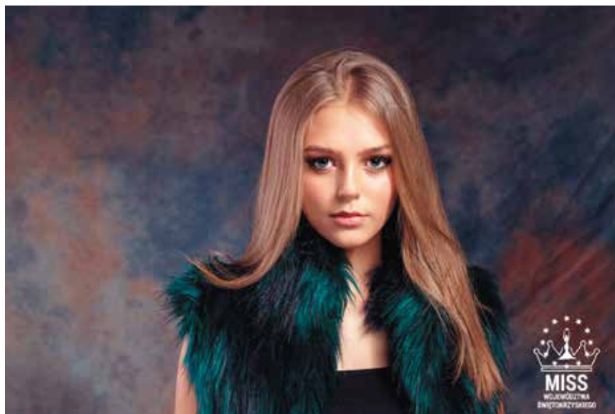
Jest wiele pięknych miejsc w gminie Małków, które warto odwiedzić – mówi nasza miss.

Posiadanie takiego tytułu to szczególny zaszczyt, ale czy wymagam od siebie więcej niż dotychczas? Raczej nie, staram się być taka jak wcześniej, pozytywna, pomocna, punktualna i zawsze uśmiechnięta.