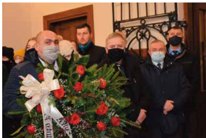
Samorządowa delegacja z gminy Masłów.