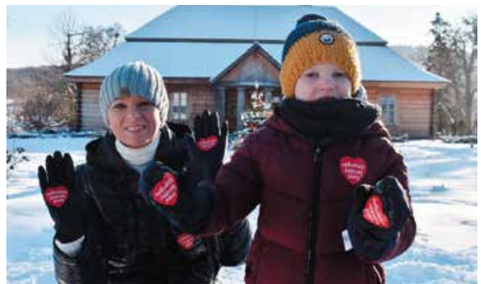
Pomagali mali i duzi.