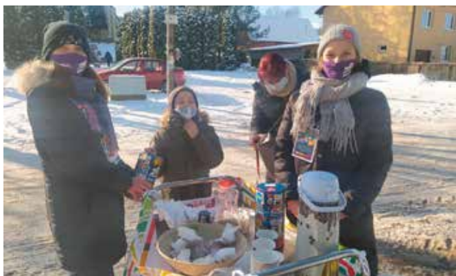
Przed szkołą w Brzezinkach wolontariusze serwowali kawę, herbatę oraz ciasteczka, pierniczki na wynos.

Wolontariusze kwestowali również przy szkole w Brzezinkach, która po raz drugi była współorganizatorem Finału. Nauczyciele i rodzice wolontariuszy przygotowali dla wszystkich wspierających orkiestrę herbatę na wynos oraz pierniczki, babeczki i ciasteczka, które rozdawane były przy zachowaniu reżimu sanitarnego.