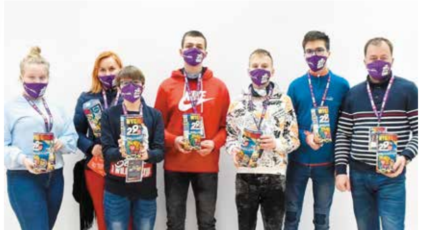
Wolontariuszom przyświecała chęć pomocy.