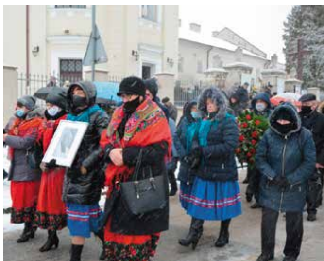
W uroczystościach wzięły udział delegacje zespołów z terenu parafii Brzezinki.