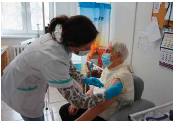
Pierwsi seniorzy w gminie Masłów już zaszczepieni.

Więcej informacji na temat szczepień przeciw COVID-19 znajduje się na stronie https://www.gov.pl/web/szczepimysie oraz pod numerem 989 to numer bezpłatnej, całodobowej infolinii Narodowego Programu Szczepień przeciw COVID-19.