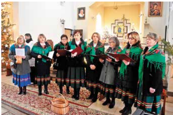
Brzezinianki kolędowały w swojej parafii.