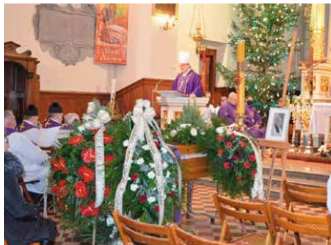
Mszę świętą nad trumną księdza kanonika odprawił biskup Andrzej Kaleta.

Zmarł 22 stycznia 2021 r. w Busku - Zdroju.