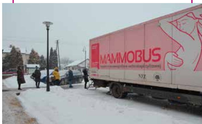
Przed mammobusem ustawiała się kolejka.

Program skierowany był do kobiet w wieku od 50 do 69 roku życia, które w okresie ostatnich dwóch lat nie korzystały z bezpłatnej mammografii. Paniom spoza wspomnianej grupy wiekowej oferowano odpłatne badanie. Akcja profilaktyczna spotkała się z dużym zainteresowaniem, ponieważ do badania przystąpiło 30 mieszkank naszej gminy. Badania profilaktyczne to najskuteczniejsza forma wykrycia stanów chorobowych we wczesnym stadium rozwoju, co pozwala podjąć skuteczną terapię i daje szansę powrotu do zdrowia.