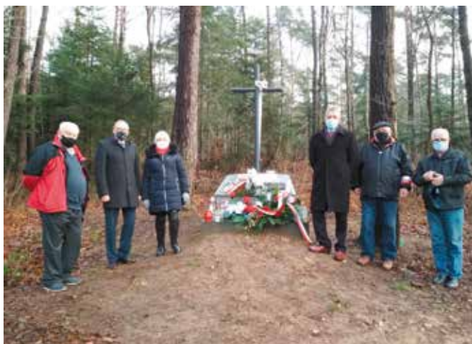
Delegacja przed pomnikiem na zboczu Białej Góry.

W rocznicę mordu niemieckiego na członkach Organizacji Orła Białego, złożono kwiaty i zapalono znicze pod pomnikiem w Dąbrowie na Białej Górze oraz na grobie polskich patriotów na cmentarzu partyzanckim w Kielcach.