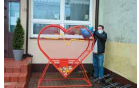
Pierwsze nakrętki trafiły do serca na początku lutego.

Do pojemnika można wrzucać plastikowe nakrętki, bez względu na kształt czy