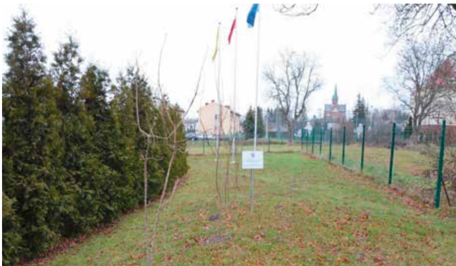
Rośliny rosną m.in. w centrum Masłowa.

W ramach projektu gmina Masłów otrzymała 15 drzew miododajnych i 20 krzewów miododajnych, które zostały nasadzone: