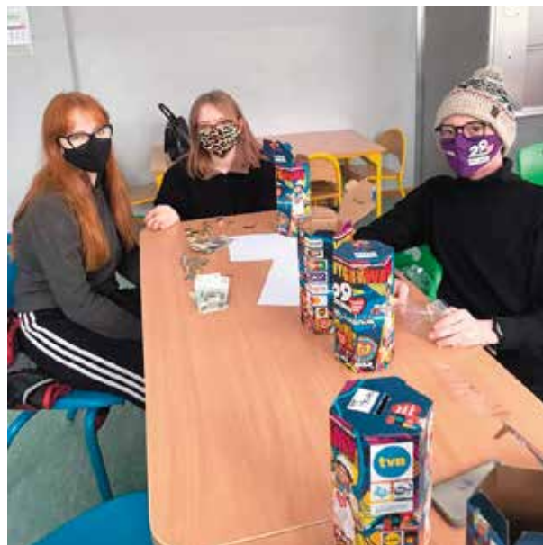
Liczenie zebranych pieniędzy.

Wolontariusze zarejestrowani byli w sztabie działającym przy „Echu Dnia” w Kielcach. Szkoła uczestniczyła w WOŚP 15 raz. Do puszek 13 wolontariuszy – uczniów szkoły wrzucono dokładnie 8282,83 zł.