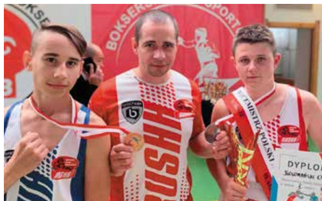
W gronie wychowanków klubu Rushh są wielokrotni medaliści najważniejszych imprez krajowych, jak również z powodzeniem startujący poza granicami kraju.