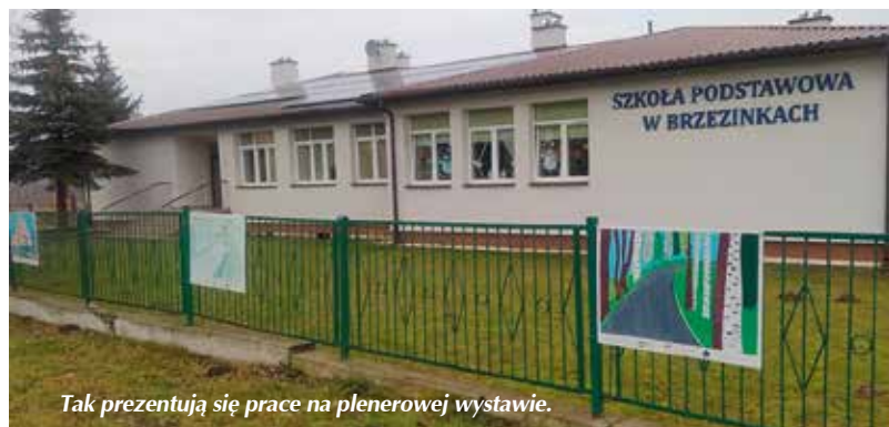
Tak prezentują się prace na plenerowej wystawie.