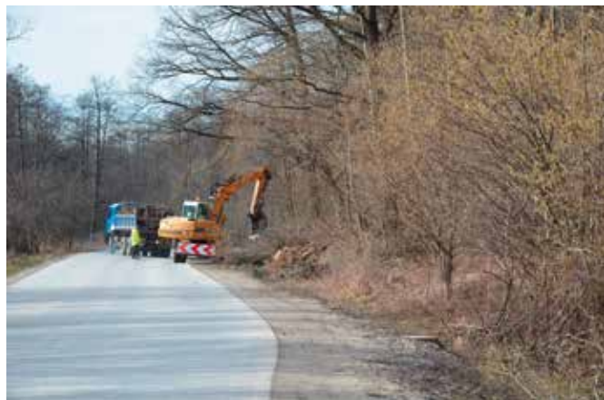
Rozpoczęła się wycinka drzew pod kolejny etap budowy ścieżki rowerowej.

Na prawie 2 mln. zł oszacowano inwestycję, w ramach której przewidziano budowę chodnika o długości około 1300 m i szerokości 2 m łączącego miejscowości Wola Kopcowa i Domaszowice. Na odcinku 150 metrów bieżących zaplanowano chodnik dwustronny, obsługujący przystanek autobusowy oraz cztery oznakowane przejścia dla pieszych. W projekcie znalazł się również przydrożny, otwarty rów odwadniający, częściowo umocniony oraz rów kryty w rejonie włączenia się do ul. Świętokrzyskiej. Powstały przepusty pod drogą, zjazdy do posesji, utwardzone będzie również pobocze.