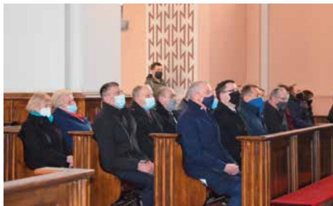
Wszyscy wzięli udział w modlitwie.