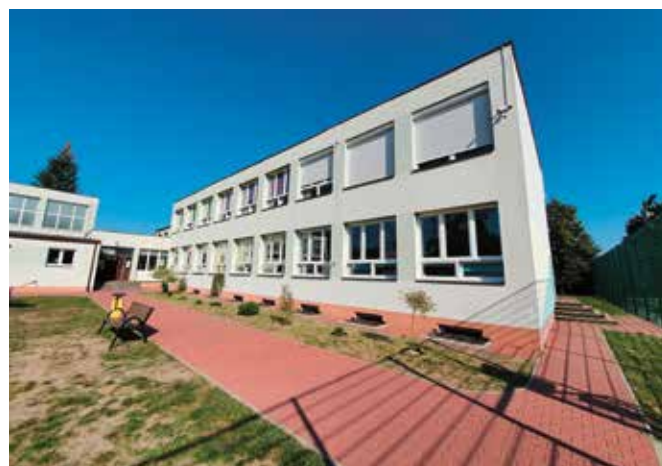
Wykonanie projektu termomodernizacji budynku szkoły w Mąchocicach Kapitulnych zlecono celem pozyskania funduszy zewnętrznych.