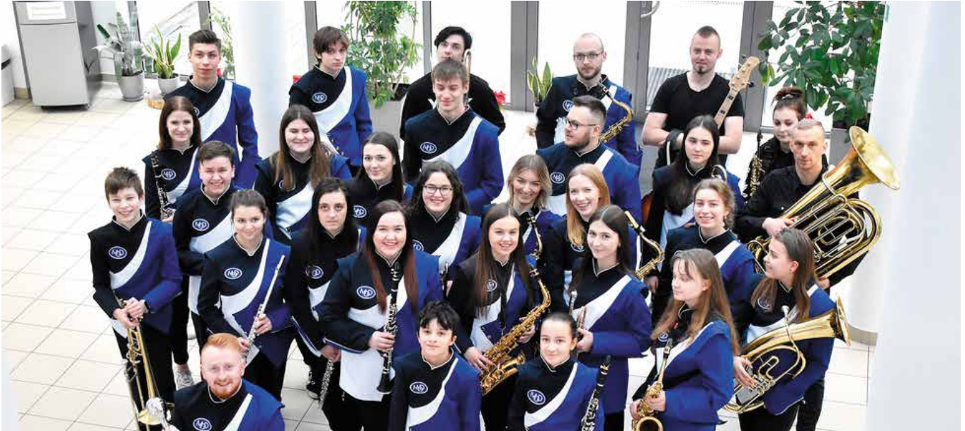
Młodzieżowa Orkiestra Dęta nagrała płytę, a muzycy wzięli udział w sesji zdjęciowej.

Młodzieżowa Orkiestra Dęta z Masłowa stanęła przed nie lada wyzwaniem. Młodzi muzycy nagrali materiały na pierwszą płytę z koncertowym repertuarem.