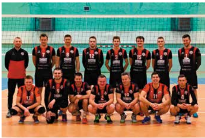
Rozgrywki siatkarskie odbywają się niestety bez udziału publiczności co jest wymogiem Świętokrzyskiego Związku Piłki Siatkowej w czasie pandemii.

Mimo ograniczeń związanych z pandemią COVID-19, siatkarze MSS rozgrywają mecze w IV lidze świętokrzyskiej. Niedawno zakończyli zmagania w swojej grupie.