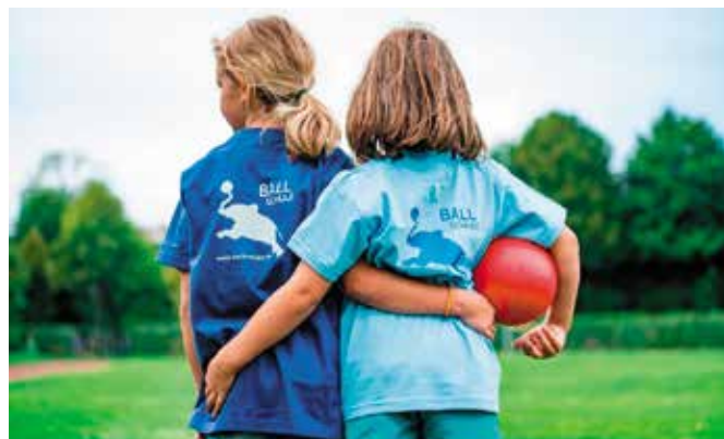
Od wczesnych lat życia należy dbać o aktywność fizyczną dziecka.

Więcej informacji można uzyskać u trenerów drużyny: Mariusz Wiktorowski - 784 082 039 Krzysztof Lemański - 534 667 422