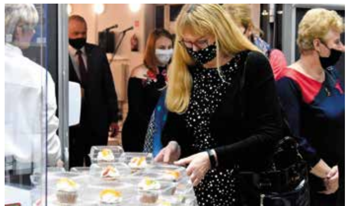
Dla pań na wynos przygotowano słodkie babeczki.