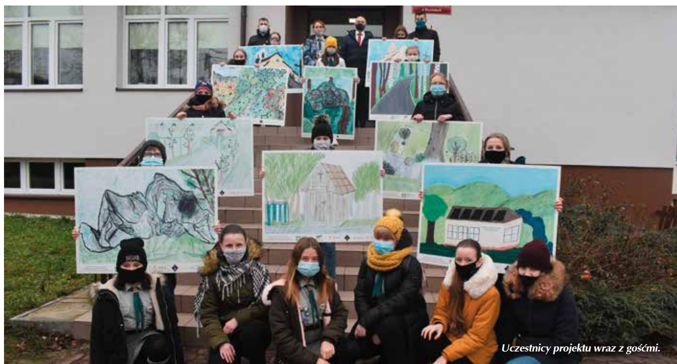
Uczestnicy projektu wraz z gośćmi.