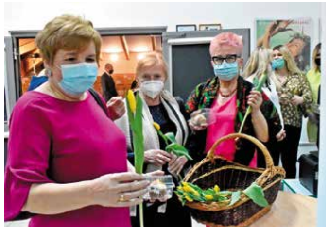
Wśród uczestniczek spotkania były panie z zespołu Dąbrowianki.