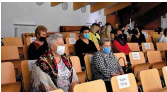
Zgodnie z obowiązującymi zasadami bezpieczeństwa w sali widowiskowej w „Szklanym Domu” została udostępniona połowa miejsc.