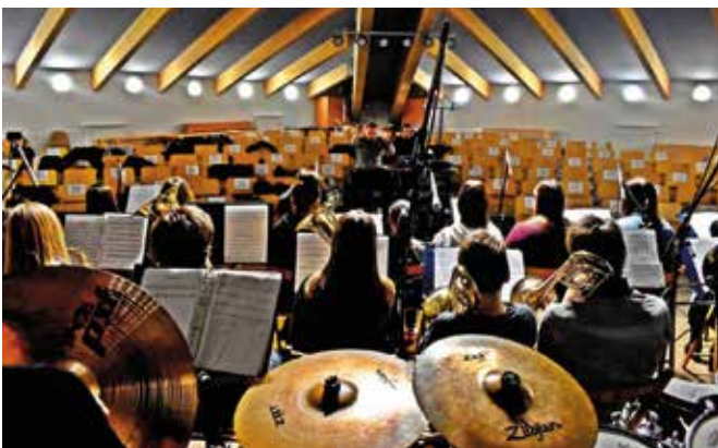
Nagranie odbyło się w sali widowiskowej „Szklanego Domu”.