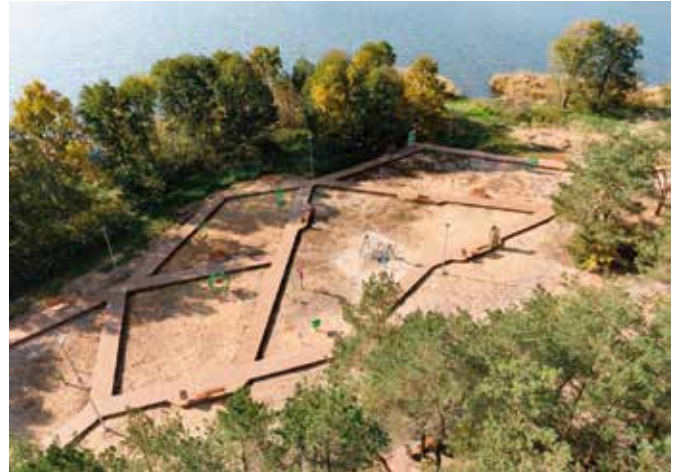
Las Wolski to jedno z najczęściej wybieranych miejsc spacerowych w regionie.

- Z niepokojem przyjmuję kolejne zgłoszenia dotyczące uszkodzeń urządzeń i sprzętu w Lesie Wolskim. Ekipy naprawcze starają się na bieżąco je usuwać. Beztroskie zabawy, które są przyczyną dokonanych zniszczeń generują dodatkowe, zbędne koszty. Zamontowany monitoring nie obejmuje wszystkich zakątków lasu - mówi wójt Tomasz Łato . - Zagospodarowaliśmy to miejsce