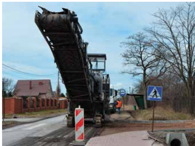
Prace końcowe przy drodze powiatowej.

Trzeci etap budowy ścieżki obejmuje odcinek wiodący od CEiK „Szkłany Dom” do Wilkowa (długość 570 mb – w gm. Masłów i 780 mb w gm. Bodzentyn). W ramach prac zaplanowano: poszerzenie jezdni, wykonanie ścieżki rowerowej, wykonanie kładki dla pieszych i rowerów (na terenie gminy Bodzentyn), budowę kanału technologicznego. Planowany koszt zadania to niemal