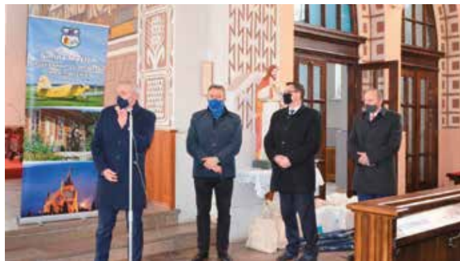
Krótką oficjalną część odbyła się tuż po mszy świętej.

Podczas spotkania sołtysom wręczono podziękowania od samorządu gminy Masłów oraz list gratulacyjny od marszałka An-