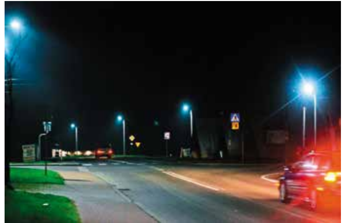
Od końca 2017 roku lampy w gminie Masłów świecą całą noc, jest to efektem realizacji dużej inwestycji oświetleniowej.

Od końca 2017 roku lampy w gminie Masłów świecą całą noc, jest to efektem realizacji dużej inwestycji oświetleniowej. Przypomnijmy, że dzięki projektowi w ramach Zintegrowanych Inwestycji Terytorialnych na terenie Kieleckiego Obszaru Funkcjonalnego (ZIT KOF) z Regionalnego Programu Operacyjnego Województwa Świętokrzyskiego na lata 2014 - 2020 w gminie Masłów wymieniono 1076 szt. opraw na LED, dowieszono 119 opraw na istniejących liniach, zmodernizowano 73 punkty sterujące oświetleniem oraz zamontowano układy kompensacji mocy i zabezpieczenia przeciwprzepięciowe. Dzięki tej inwestycji zyskaliśmy no-