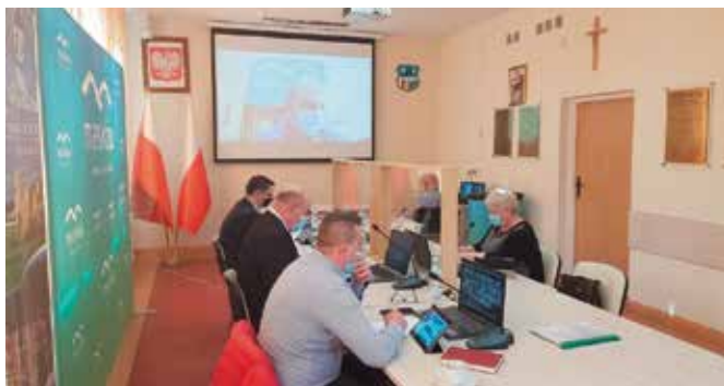
Sesja odbyła się w trybie hybrydowym. Część radnych znajdowała się w sali konferencyjnej...

To już kolejna sesja, która odbyła się z wykorzystaniem środków porozumiewania się na odległość w zdalnym trybie obradowania. Radni zdecydowali m.in. o współpracy z Powiatem Kieleckim na opracowanie dokumentacji projektowej dla trzech zadań inwestycyjnych.