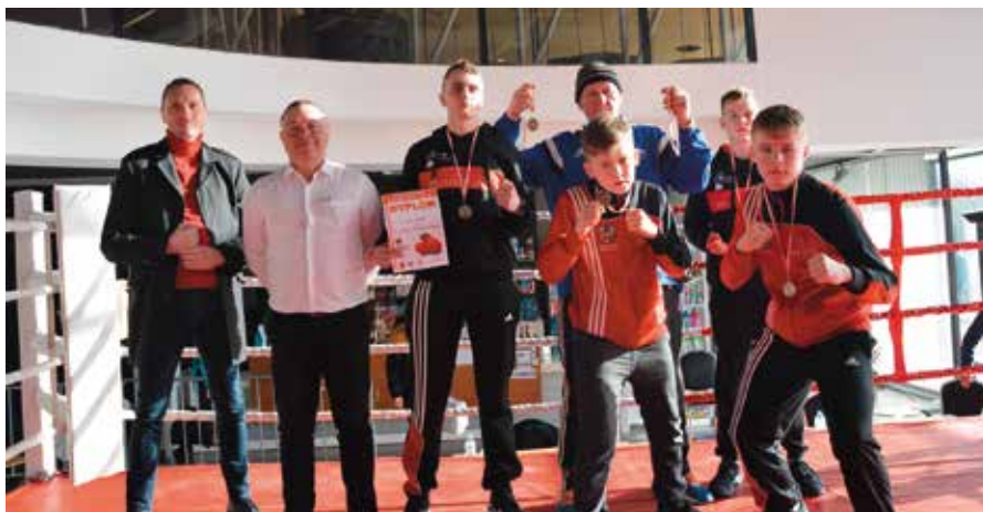
Tak było na mistrzostwach w Skarżysku-Kamiennej.