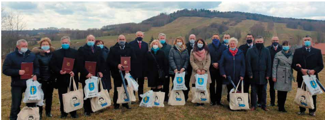
Sołtysi wraz z gośćmi okolicznościowego spotkania pozwolili do pamiątkowego zdjęcia.