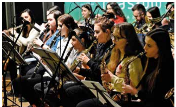
Muzycy podczas sesji nagraniowej.