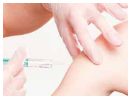
Szczepionki przyjęli chętni nauczyciele.

- Zdecydowana większość pracowników żłobka i nauczycieli z terenu naszej gminy zadeklarowała chęć przystąpienia do szczepienia, bo około 65%. Wśród niezgłoszonych są też pracownicy powyżej 60. roku życia, którzy na szczepienie mu-