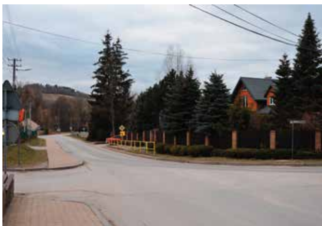
Na odcinku ul. Jana Pawła II przesunięty zostanie chodnik i poszerzona droga.