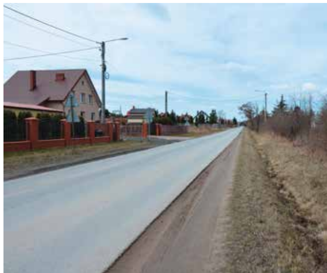
Na odcinku drogi powiatowej 0312 T powstanie brakujący chodnik.

termin realizacji - 6 miesięcy od podpisania umowy szacowany koszt zadania to 20 tys. zł