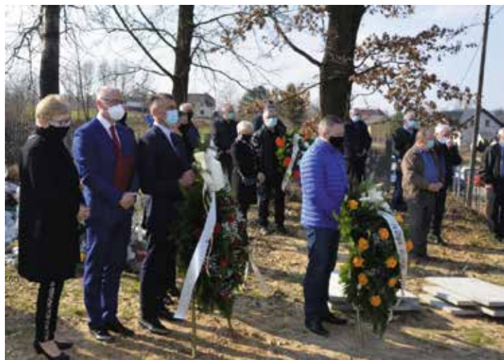
Zmarłego żegnali przedstawiciele samorządu gminy Masłów.