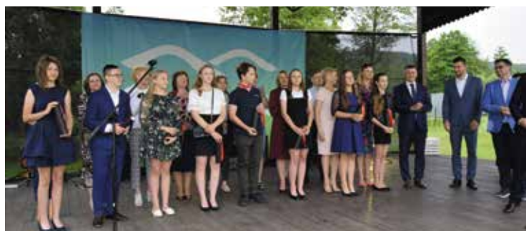
Stypendyści ze Szkoły Podstawowej w Brzezinkach.