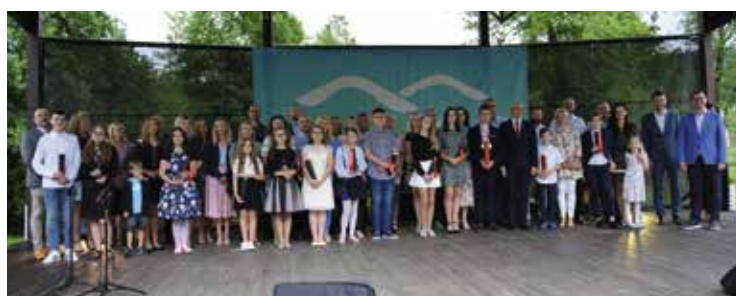
Stypendyści ze Szkoły Podstawowej im. Stefana Żeromskiego w Mąchocicach-Scholasterii.

Stypendia są realizacją „Lokalnego Programu wspierania uzdolnionych dzieci i młodzieży zamieszkałych w Gminie Masłów”. Warunkiem otrzymania stypendium jest: uzyskanie najlepszych wyników w nauce: od klasy IV do VI szkoły podstawowej – minimum 5,6 ze średniej z ocen; dla klas VII i VIII szkoły podstawowej - minimum 5,3; oraz ocenę wzorową z zachowania, lub zdobycie tytułu laureata lub finalisty wojewódzkiego konkursu przedmiotowego organizowanego przez Świętokrzyskiego Kuratora Oświaty. Programem są objęci uczniowie szkół podstawowych, dla których organem prowadzącym jest gmina Masłów oraz mieszkańcy uczęszczający do szkół podstawowych poza obszarem gminy Masłów, zgodnie z ustalonymi obwodami szkolnymi.