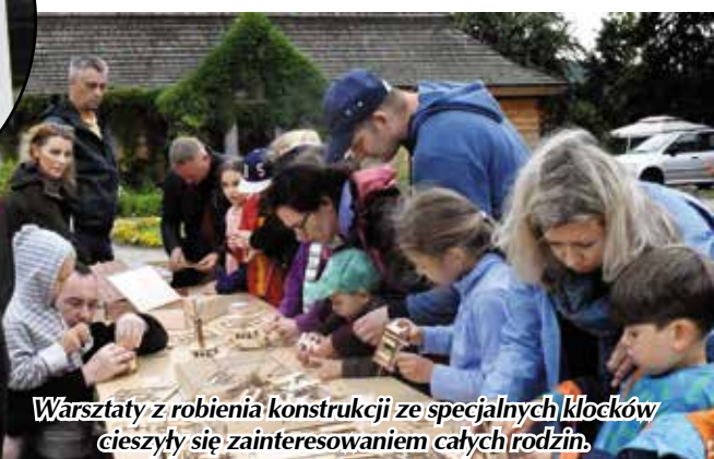
Warsztaty z robienia konstrukcji ze specjalnych klocków cieszyły się zainteresowaniem całych rodzin.