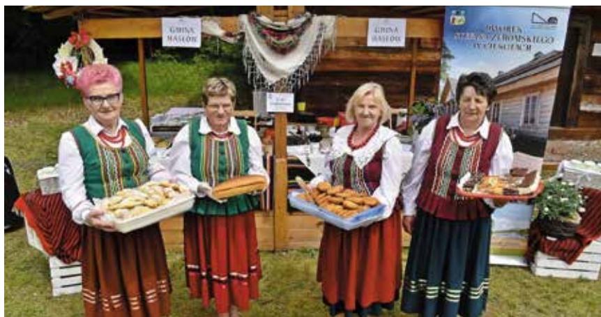
Dąbrowianki bardzo szybko sprzedały swoje pyszne smakołyki.