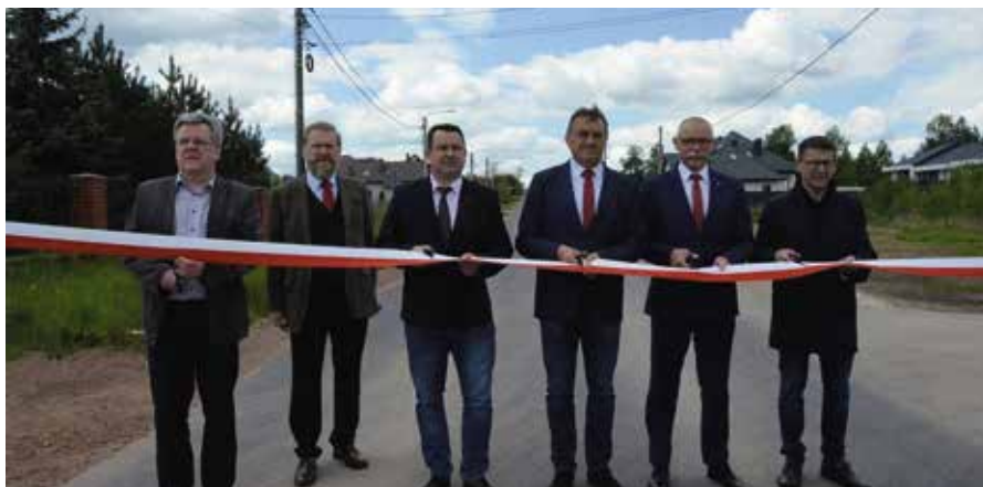
Wstęga została oficjalnie przecięta.

To inwestycja drogowa, która znacznie podniesie bezpieczeństwo pieszych i kierowców. W Woli Kopcowej z udziałem władz powiatu i gminy uroczystie oddano do użytku nowy chodnik.