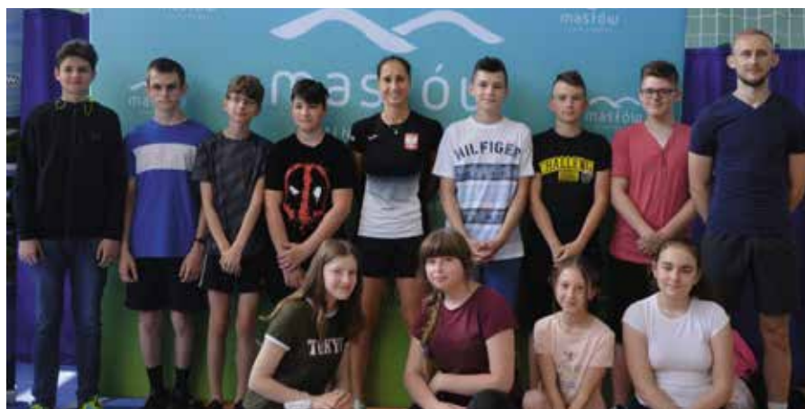
Był też czas na wspólne zdjęcia.