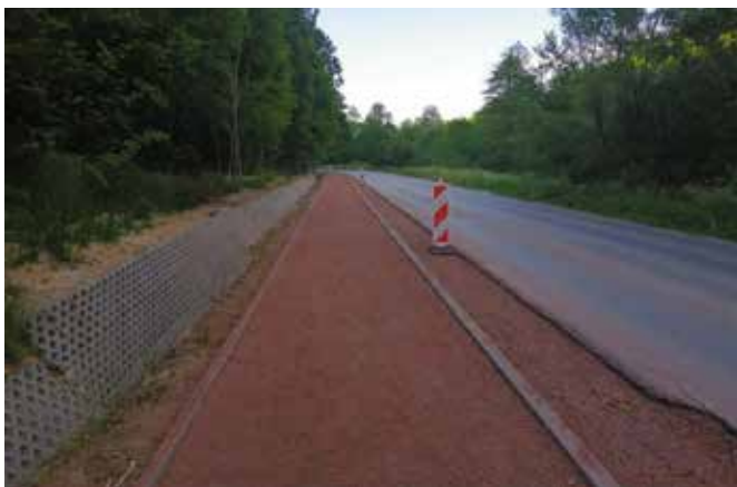
Ścieżka powstaje w szybkim tempie.