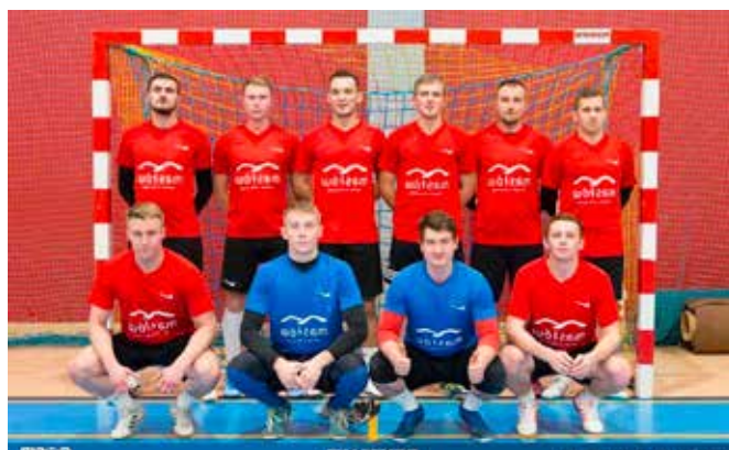
Tak prezentuje się drużyna MSS „Klonówka” Masłów.

tos Stąporków 0-2 (0-2) oraz Polanie Pierzchnica 6-2 (2-0) zapewniły drużynie utrzymanie się w klasie A.