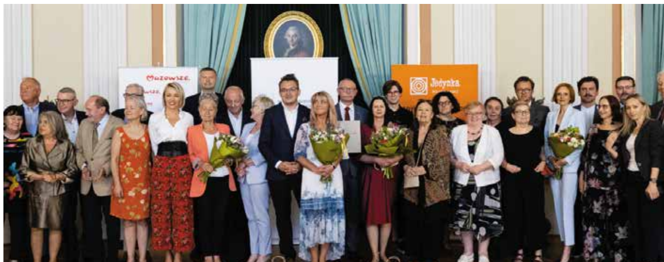
Wydarzenie odbyło się na Zamku Królewskim w Warszawie.