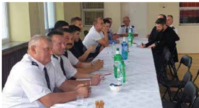
Druhowie OSP w Brzezinkach podczas zebrania sprawozdawczo-wyborczego.