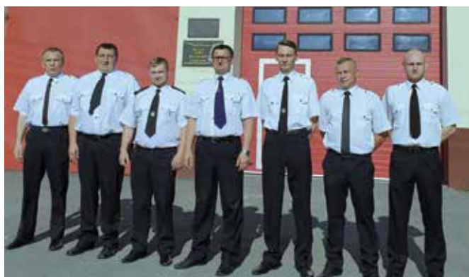
Nowy zarząd jednostki OSP Masłów.