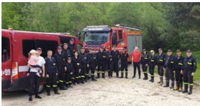
Ekipa zaangażowana w akcję sprzątania spisała się znakomicie.