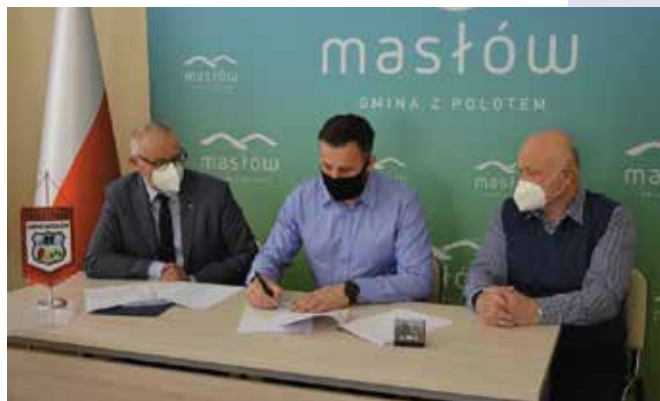
Ulice w Woli Kopcowej zostaną przebudowane ponieważ jest już na nich wykonana infrastruktura wodociągowa i kanalizacyjna.

Przedmiotem kolejnej z podpisanych umów jest opracowanie projektów technicznych przebudowy drogi gminnej w Wiśniówce i ulicy Radosławskiej w Ciekotach oraz przygotowanie projektu budowy drogi manewrowej po północnej części kaplicy w Woli Kop-