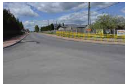
Chodnik łączy dwa sołectwa.

Całkowity koszt realizacji zadania to około 1 943 000 z czego 50% zapłacił Fundusz Dróg Samorządowych, 25% Powiat Kielecki i 25% Gmina Masłów (gmina Masłów w 2020 roku zapłaciła 189 380,00, a w 2021 roku 138 314,49). Prace zakończyły się 30 kwietnia 2021 roku.