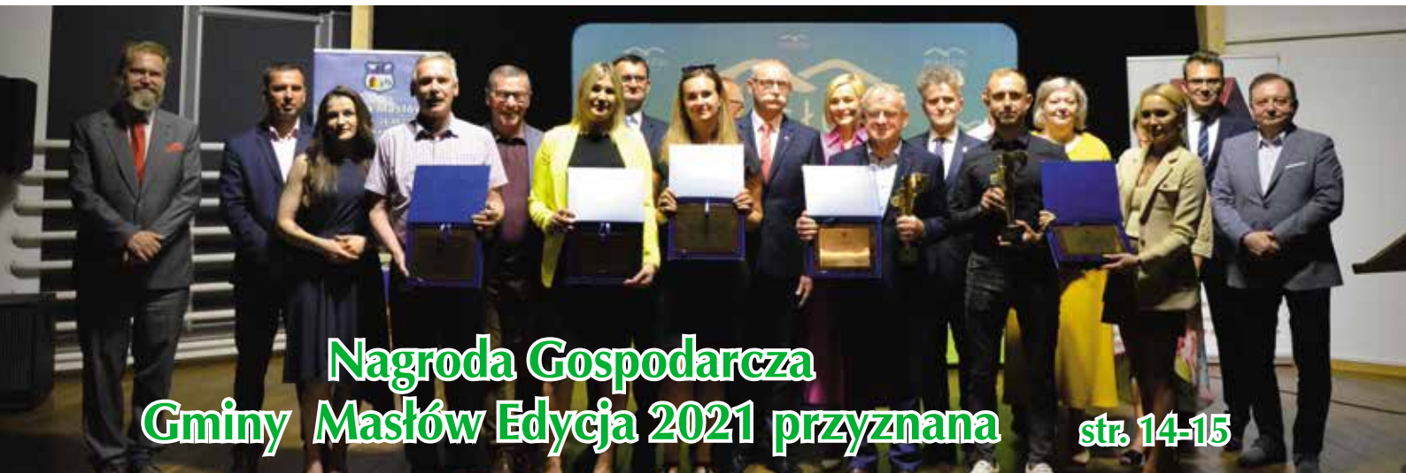
Nagroda Gospodarcza Gminy Masłów Edycja 2021 przyznana