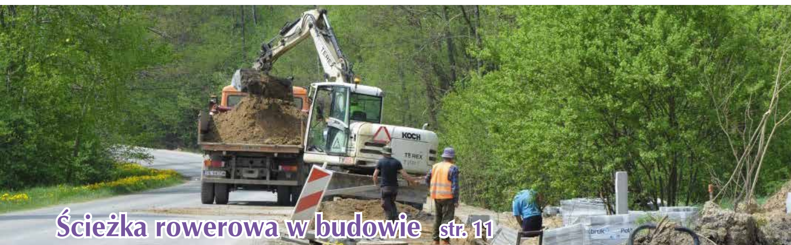
Ścieżka rowerowa w budowie