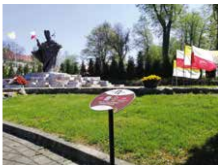
Pomnik św. Jana Pawła II w Masłowie.