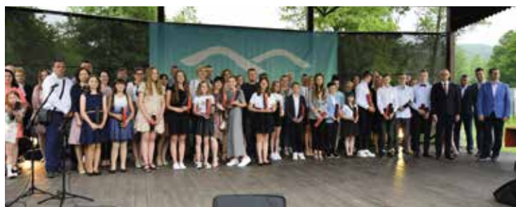
Stypendyści ze Szkoły Podstawowej im. Jana Pawła II w Masłowie Pierwszym.