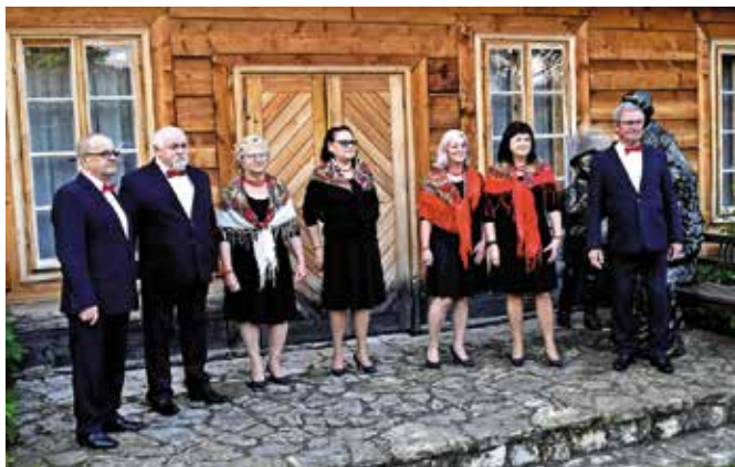
Grupa Artystyczna Golica