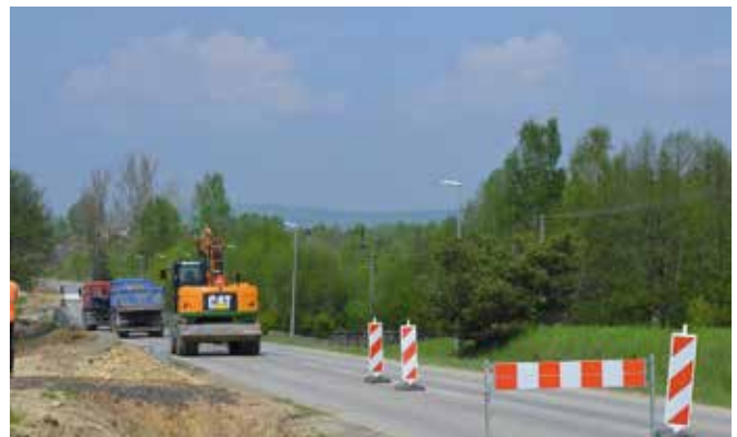
Prace będą trwać do października tego roku.

Ziemne roboty przygotowawcze trwają również na odcinku Ciekoty – Święta Katarzyna, który ma zostać ukończony do końca 2022 roku. Tu zakres prac obejmie poszerzenie drogi, budowę