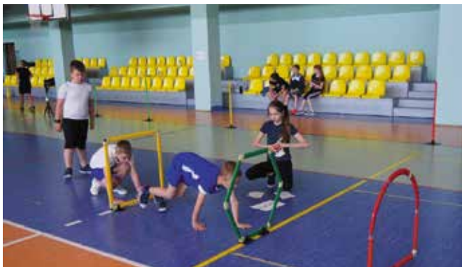
Nie zabrakło konkurencji sprawnościowych.