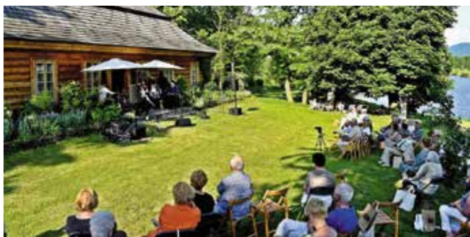
Spotkanie odbyło się przed ciekockim dworkiem.