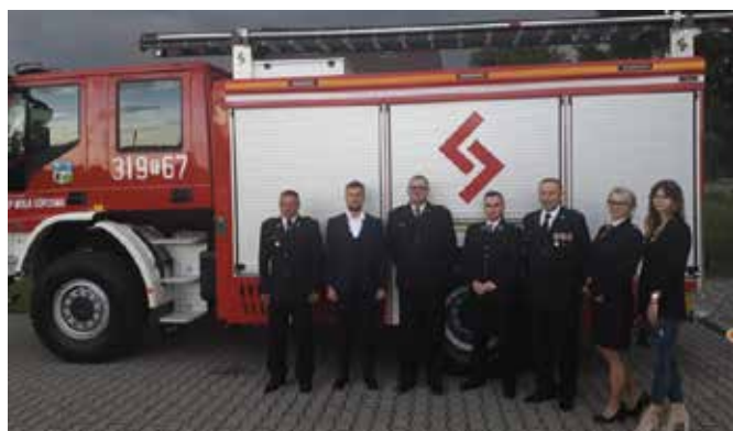
Nowy zarząd jednostki OSP w Woli Kopcowej.