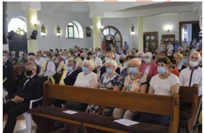
Wierni z parafii w Domaszowicach licznie przybyli na jubileusz.