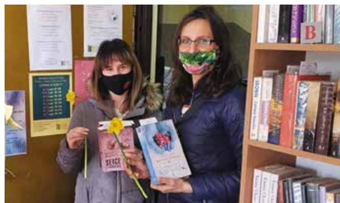
Czytelnicy przy wejściu do biblioteki otrzymywali żonkile.

– Cieszę się, że takie inicjatywy były podejmowane i mogli z nich skorzystać nasi uczniowie. Warsztaty robienia kwiatów wprowadziły ciekawe urozmaicenia do zajęć, jakie prowadzą