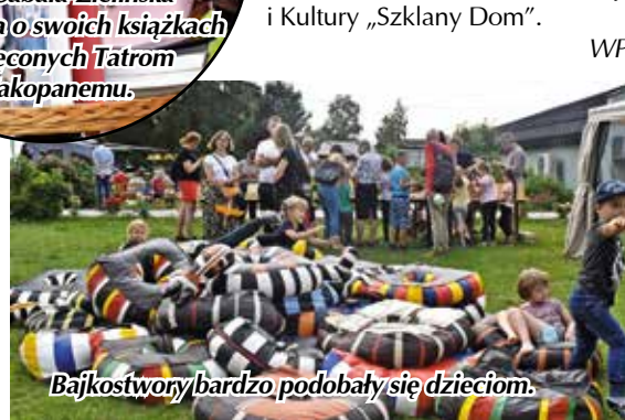
Bajkostwory bardzo podobały się dzieciom.