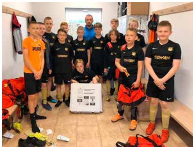
Zawodnicy drużyny młodzika starszego z prezentem z okazji Dnia Dziecka – pizzą.