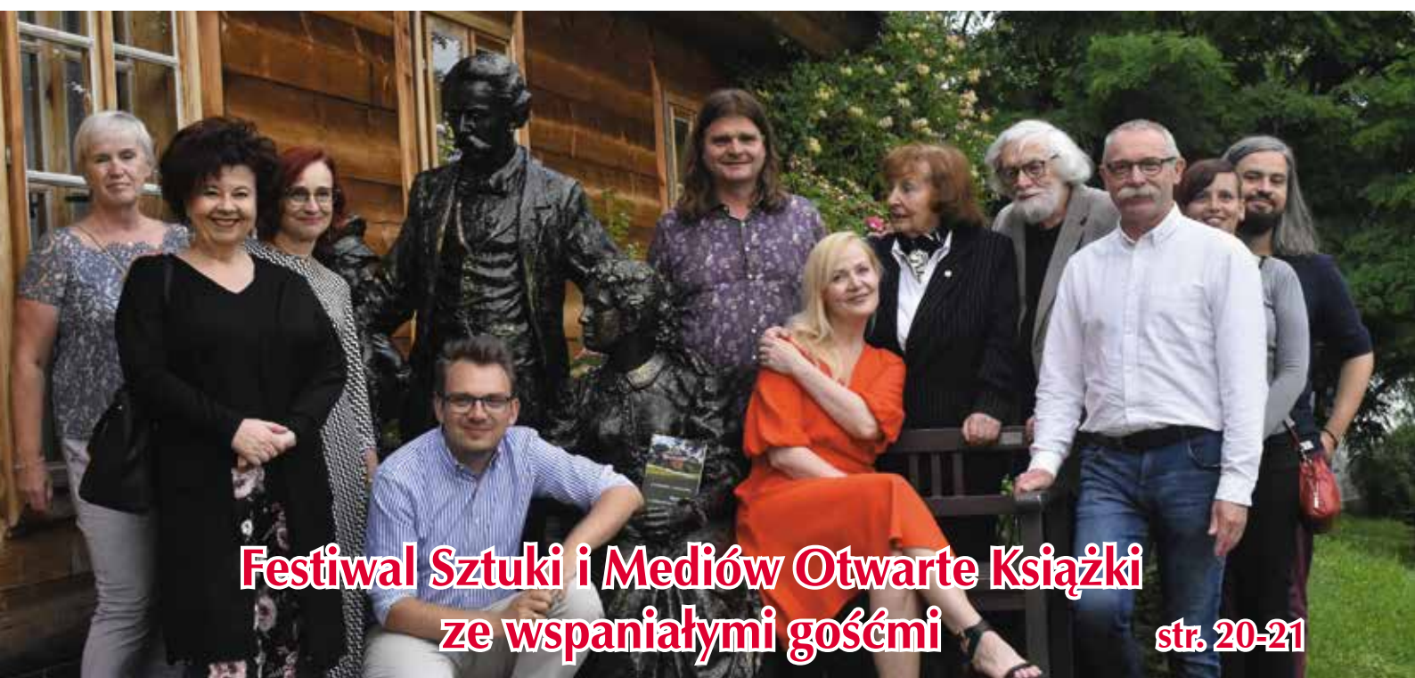
Festiwal Sztuki i Mediów Otwarte Książki ze wspaniałymi gośćmi