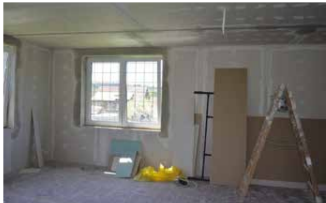
Sala główna zmienia się nie do poznania.

Za pracę odpowiada firma Bud-Przem z Buska-Zdroju. Zakres prac jest szeroki. Odnowione zostaną wnętrza budynku (sala spotkań, kuchnia, łazienka, korytarze). Dzięki pracom remontowym pomieszczenia świetlicy zyskają gruntownie odnowione ściany oraz podłogi. Na podłogach położona będzie nowa terakota i panele. W budynku zostanie zamontowana nowa stolarka drzwiowa oraz oprawy oświetleniowe. Dzięki zaplanowanemu remontowi pomieszczenia zyskają estetyczny i nowoczesny wygląd. W ramach modernizacji obiektu zaplanowano oczyszczenie i wykonanie okładziny kominów, montaż grzejników płytowych z zaworami termostatycznymi wraz z orurowaniem i połączenie z istniejącą instalacją centralnego ogrzewania.