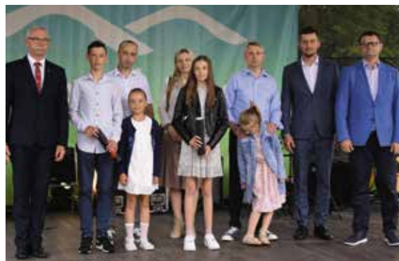
Stypendyści ze Szkoły Podstawowej Nr 15 im. Tadeusza Kościuszki w Kielcach.

W minionym roku ze względu na stan epidemiologiczny wręczenie stypendiów nie odbyło się. Organizatorzy tegorocznej edycji ceremonii, z uwagi na obostrzenia sanitarne wywołane pandemią, przenieśli wydarzenie z dotychczasowego miejsca (Centrum Edukacji i Kultury „Szklany Dom” w Ciekotach) do amfiteatru.