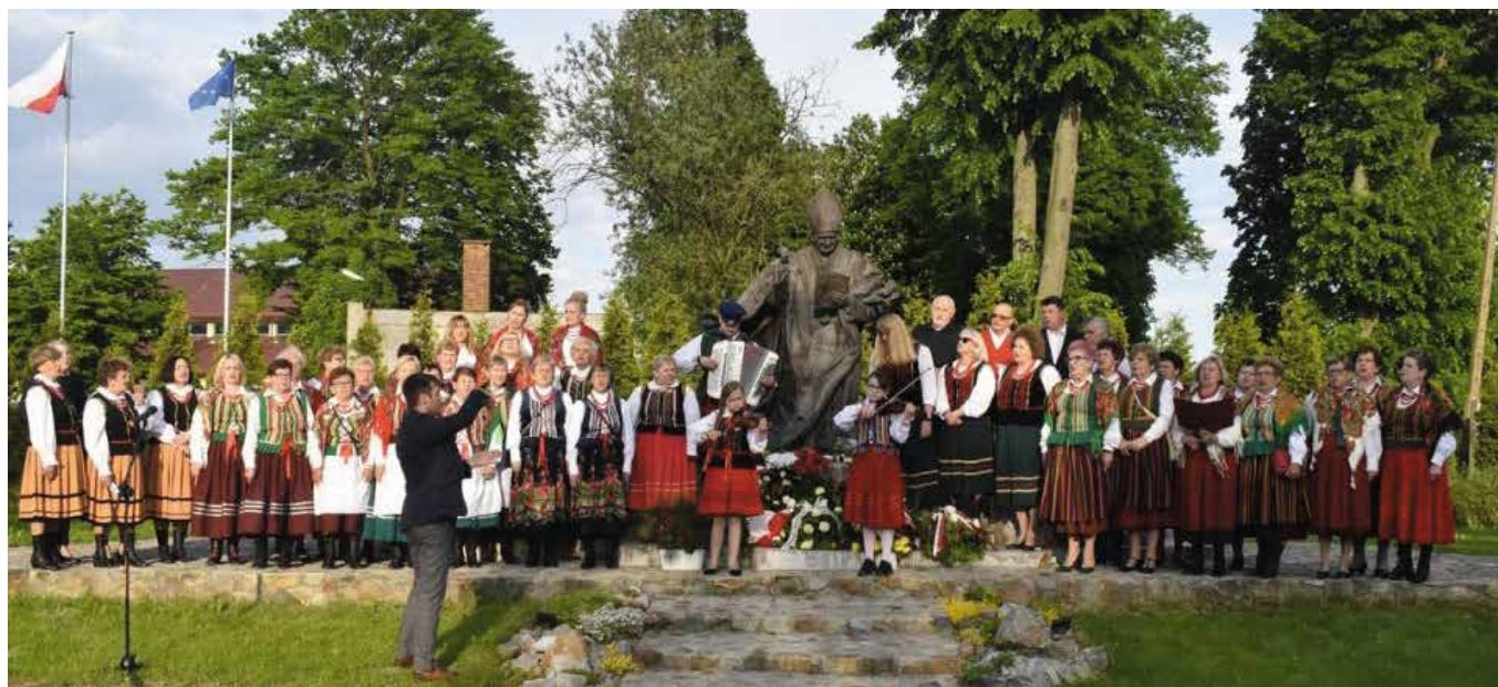
Zespoły odśpiewały wyjątkową wersję „Barki”.