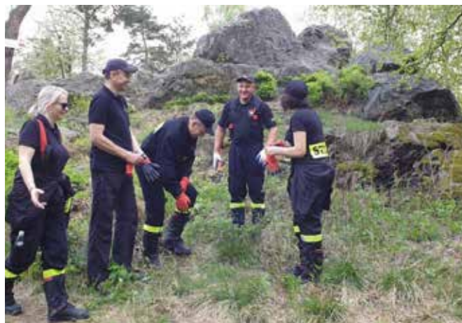
Diabelski Kamień został nie tylko posprzątany, ale również odsłonięty.

- Dziękuję wszystkim druhom, którzy po raz kolejny zaprezentowali piękną postawę i w sobotnie popołudnie z werwą przy-