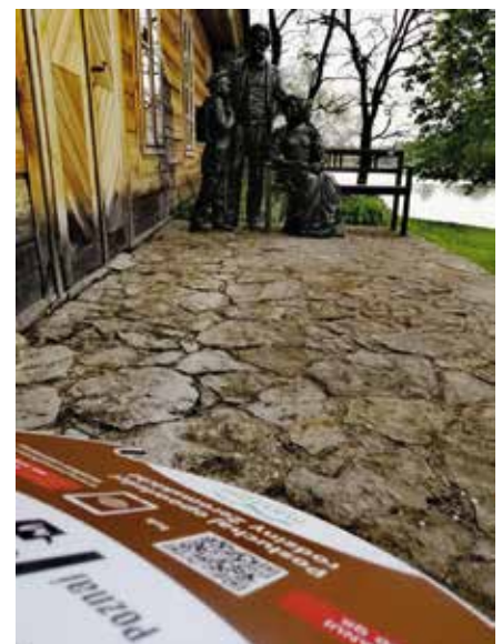
Ławeczka Żeromskich w Ciekotach.

storii będzie nagranie dotyczące cmentarza cholerycznego w Woli Kopcowej, w którym pochowano około 100 mieszkańców Masłowa, Dąbrowy i Woli Kopcowej.