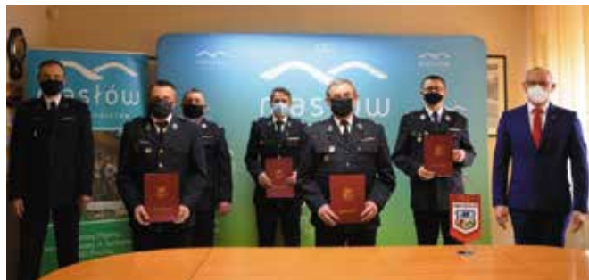
Spotkanie z prezesami OSP odbyło się w Urzędzie Gminy.

– OSP Brzezinki, Ciekoty, Masłów, Mąchocice Kapitulne oraz Wola Kocowa są aktywnie działającymi jednostkami ochrony przeciwpożarowej, w roku 2020 łącznie uczestniczyły w 244 akcjach ratowniczo-gaśniczych, natomiast w roku 2019 aż 264. W szeregach jednostek mamy młodych, pełnych werwy i gotowych do niesienia pomocy druhów. OSP Ciekoty, Masłów, Mąchocice Kapitulne i Wola Kopcowa są włączone do krajowego systemu ratowniczo-gaśniczego, a ich członkowie posiadają uprawnienia do bez-