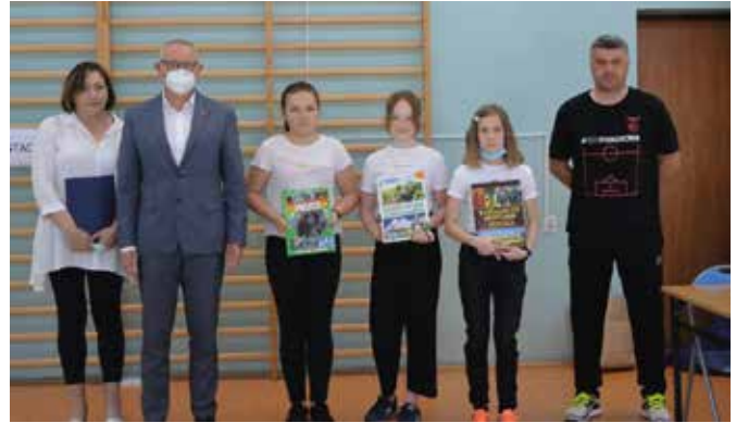
Podczas Dnia Sportu wyróżniono zwycięzców konkursu wiedzy o św. Janie Pawle II, który od wielu lat organizuje masłowska szkoła.

Podczas Dnia Sportu wyróżniono zwycięzców konkursu wiedzy o św. Janie Pawle II, który od wielu lat organizuje masłowska szkoła. – Konkurs jest wspaniałą okazją do przybliżenia postaci papieża młodym mieszkańcom Masłowa. Cieszę się, że od lat wiele dzieci i młodzieży z terenu naszej gminy chętnie bierze w min udział i przybliża w ten sposób wiedzę o patronie. Jest to hołd