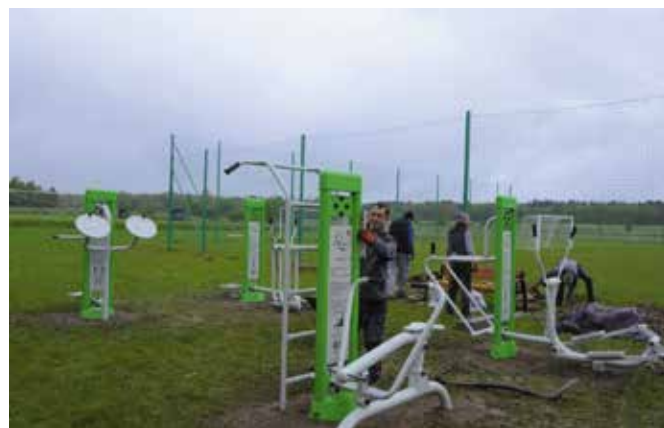
Siłownia napowietrzna w Brzezinkach już została zamontowana.

– Na terenie gminy Masłów stale rozwijamy infrastrukturę sportową. Obecnie mamy dwie duże hale sportowe, pełnowymia-