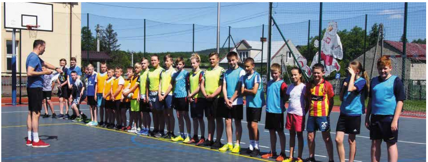
Zajęcia odbywały się również na zewnątrz.