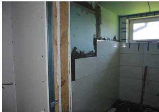
Metamorfozę przejdzie również łazienka.