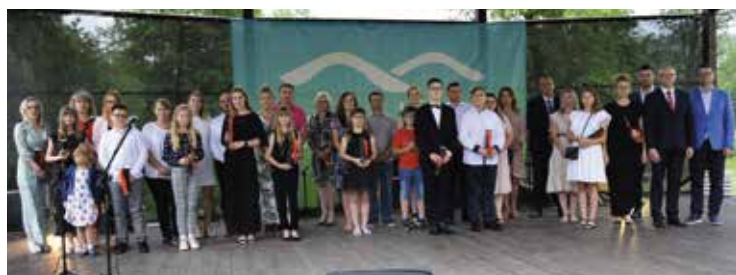
Stypendyści ze Szkoły Podstawowej im. Marii Skłodowskiej-Curie w Mąchocicach Kapitulnych.