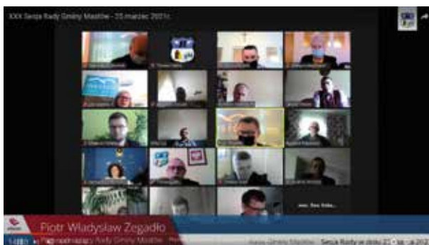
Radni obradowali zdalnie.

Chwilę po zakończeniu XXX obrad sesji Rady Gminy rozpoczęła się XXXI sesja w trybie nadzwyczajnym. Jej program stanowił jeden punkt. Radni zdecydowali o zmianie uchwały podjętej podczas posiedzenia 25 lutego 2021 roku w sprawie udzielenia pomocy rzeczowej dla Powiatu Kieleckiego w realizacji zadań inwestycyjnych polegających na przygotowaniu dokumentacji projektowej. Gmina Masłów wesprze powiatowy samorząd w przygotowaniu projektu na budowę brakującego odcinka chodnika wzdłuż drogi powiatowej w Domaszowicach w kierunku Woli Kopcowej długości ok. 450 mb. Przeznaczone na to zostanie 35 000 zł. Drugim zadaniem będzie przygotowanie dokumentacji projektowej, która potrzebna będzie do realizacji modernizacji drogi powiatowej od skrzyżowania z ul. ks. J. Marszałka w kierunku Dąbrowy do skrzyżowania z drogą krajową. Zabezpieczono na to 51 660 zł. Trzecie zadanie to przygotowanie projektu poszerzenia chodnika i drogi powiatowej ul. Jana Pawła II na odcinku od ul. Spacerowej do ul. Spokojnej w Masłowie Pierwszym za kwotę 24 600 zł. Zmiany w uchwale były konieczne do wprowadzenia po otwarciu ofert przetargowych. W jednym z zadań oferta była niższa niż planowano, a w kolejnym wyższa. Zmiana uchwały dotyczy aktualizacji kwot udzielanej pomocy rzeczowej.