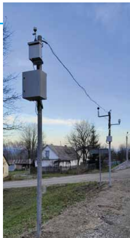
Wokół zakładu, jak „grzyby po deszczu” wyrosły stacje monitoringu pyłu.