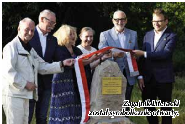
Zagajnik Literacki został symbolicznie otwarty.

Festiwal Mediów i Sztuki Otwarte Książki to plenarne wydarzenie odbywające się w malowniczych sceneriach dworku Stefana Żeromskiego oraz Centrum Edukacji i Kultury „Szklany Dom” promujące czytelnictwo. Tegoroczna edycja trwała trzy dni i przyniosła mnóstwo wydarzeń mających duże promocyjne znaczenie dla Żeromszczyzny oraz gminy Masłów.