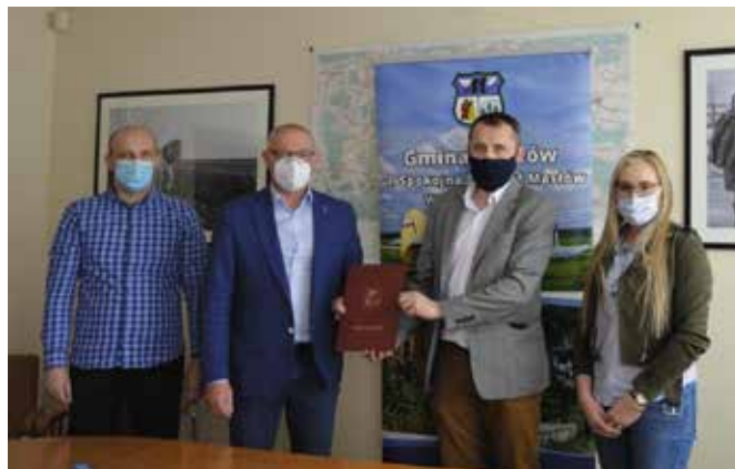
Umowa podpisana, inwestycja będzie gotowa do końca września.

Dzięki niej powstanie kanalizacja w formie kanałów zamkniętych o łącznej długości około 105,60 m i kanałów otwartych, rowów – długości 163,40 m. Jak będzie ona działać? Wody spływające przydrożnymi rowami zlokalizowane po stronie zachodniej drogi gminnej oraz dotychczasowo przejmowane przez wpusty uliczne wody opadowe i roztopowe, odprowadzone do kanału