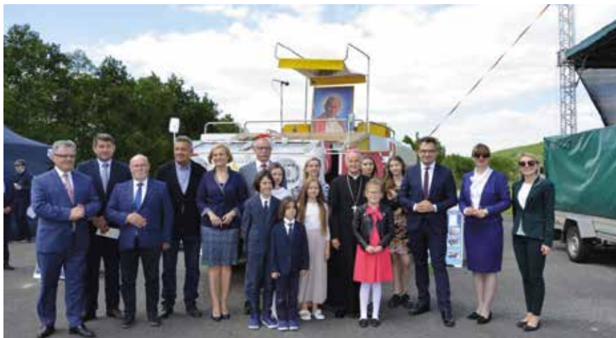
Organizatorzy, goście i nasi masłowscy młodzi wokaliści.