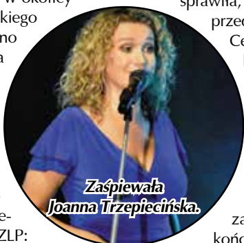
Zaśpiewała Joanna Trzepiecińska.