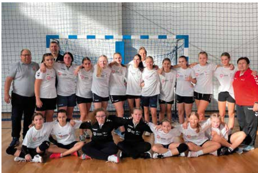
Zgrupowanie to szansa na rozwój dla naszych młodych sportsmenek.