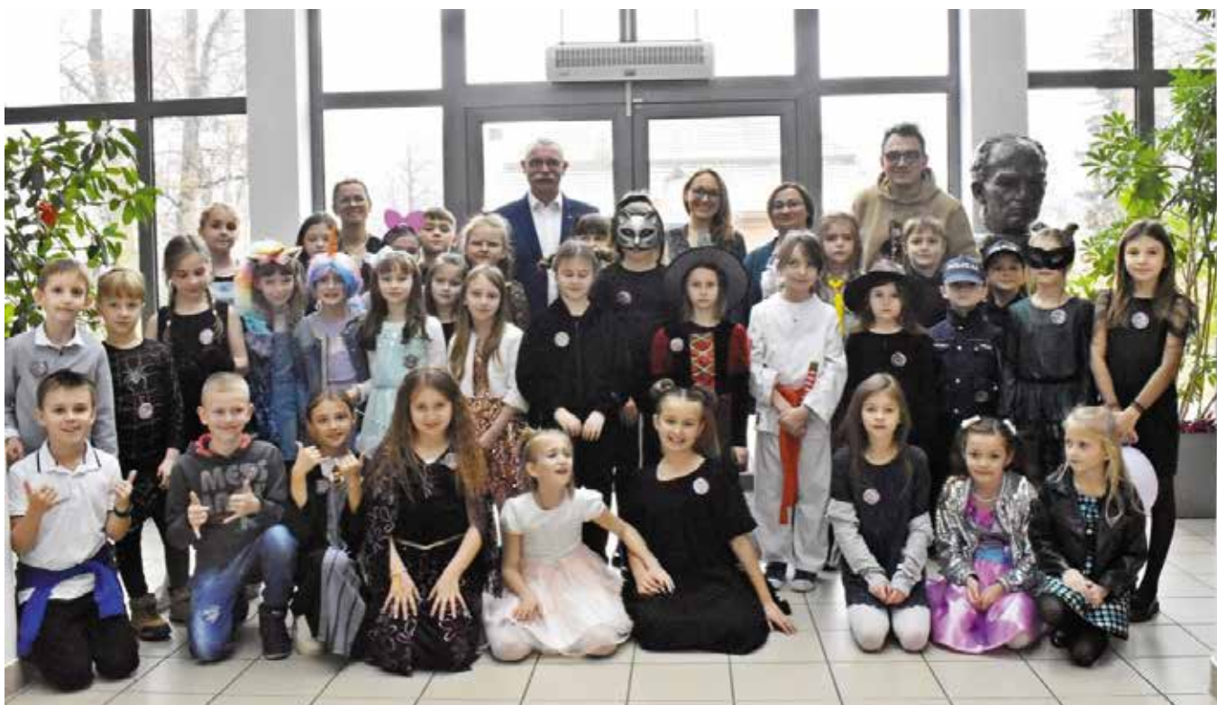
Zuchy z naszej gminy bawiły się znakomicie.