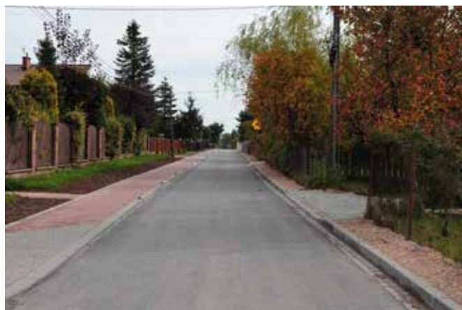
Dzięki robotom budowlanym ulica Letniskowa zyskała nową nawierzchnię asfaltową na odcinku o długości około kilometra i szerokości 3,7 metra.

Zmiany dokonały się w Ciekotach na Żeromskiego, dzięki projektowi realizowanemu w ramach Regionalnego Programu Obszarów Wiejskich na lata 2014 – 2020. Prace objęły przebudowę amfiteatru, montaż paneli fotowoltaicznych oraz projekt wystawy