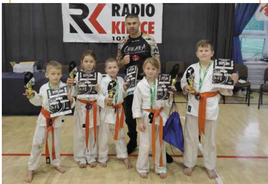
Charakter i walka do końca to ich cechy!