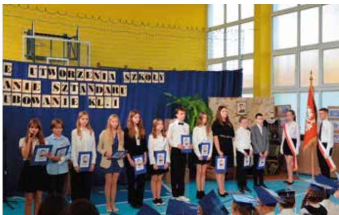
Szkoła w Mąchocicach Kapitulnych obchodziła jubileusz, a uczniowie rozpoczęli naukę w dwujęzycznych oddziałach.

W 2022 roku niemal 170 młodych mieszkańców gminy Masłów wzięło udział w bezpłatnych treningach piłki nożnej, siatkowej, ręcznej, boksu i żeglarstwa. Zajęcia odbyły się dzięki dotacjom, jakie gmina przekazała organizacjom pozarządowym na realizację zadań publicznych z zakresu wspierania i upowszechniania kultury fizycznej w ramach ustawy o działalności pożytku publicznego i o wolontariacie. W br. gmina współpracowała w tym zakresie z Masłowskim Stowarzyszeniem Sportowym, Stowarzyszeniem Piłki Ręcznej SZÓSTKA Masłów, Klubem Sportowym „Skalnik”, Kieleckim Klubem Bokserskim RUSHH oraz Uczniowskim Klubem Sportowym „Zalew Kielce”. W ramach współpracy ze Stowarzyszeniem Nauczycieli i Wychowawców w Kielcach 35 uczniów masłowskich szkół skorzystało z bezpłatnych kolonii