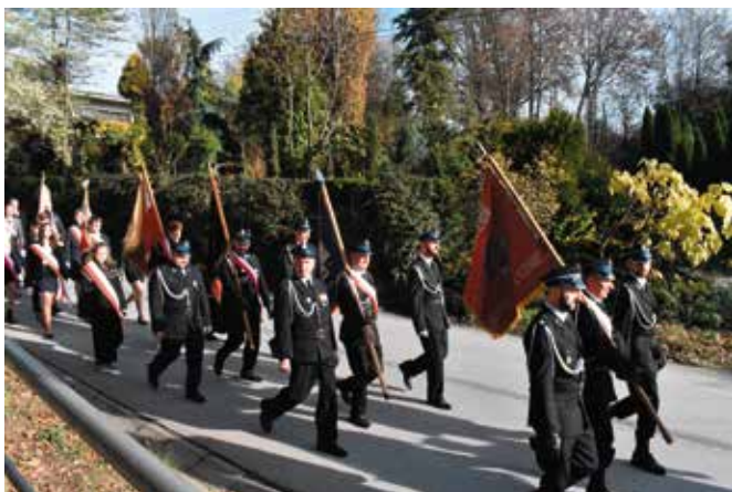
Strażacy poprowadzili przejście z kościoła do hali sportowej.