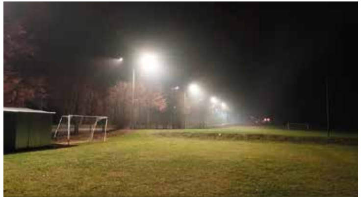
Oświetlenie przy boisku w Brzezinkach.

- Bezpieczeństwo mieszkańców pomimo rosnących cen energii jest nadal priorytetem dla samorządu. W miarę możliwości staramy się budować i uzupełniać energooszczędne ciągi oświetlenia, co przekłada się na komfort