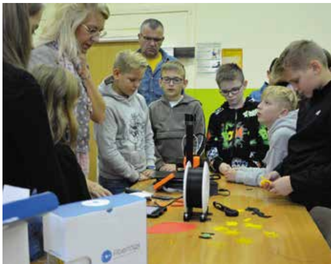
Na dzieci czekają nowe wyzwania.