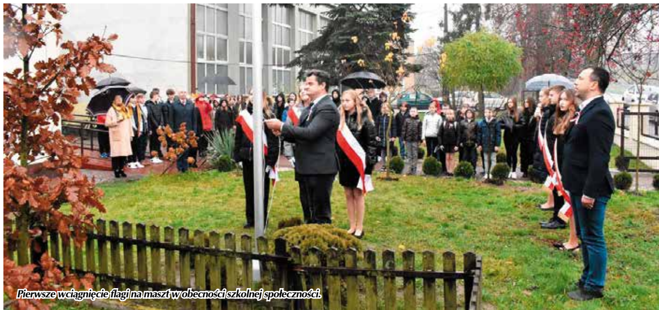
Pierwsze wciągnięcie flagi na maszt w obecności szkolnej społeczności.