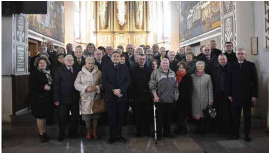
Pamiątkowe zdjęcie jubilatów z organizatorami i gośćmi wydarzenia.