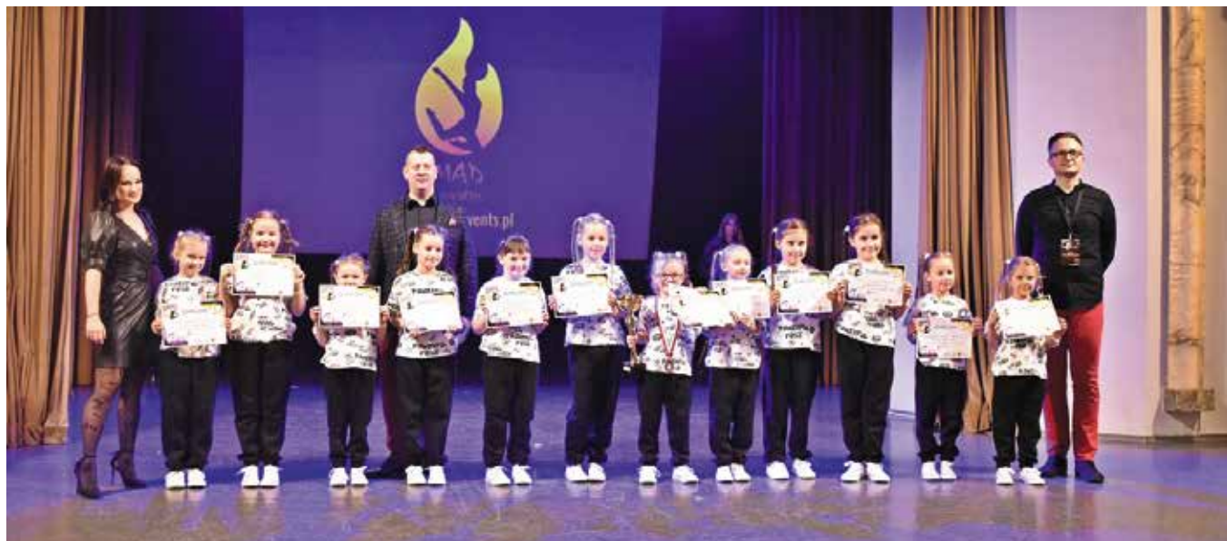
Szklana Ekipa odbiera puchar i dyplomy na scenie WDK.

Szklana Ekipa, dziecięca formacja tańca nowoczesnego i hip-hopu działająca w Centrum Edukacji i Kultury „Szklany Dom” w Ciekotach zadebiutowała w profesjonalnym turnieju tańca!