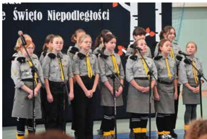
47 DH Iskra z Masłowa