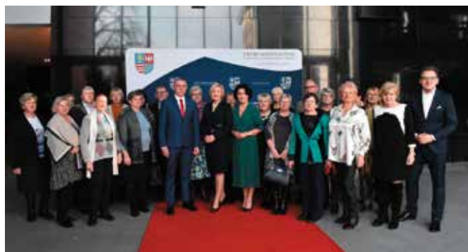
Na widowni zasiedli słuchacze Uniwersytetu Trzeciego Wieku w Masłowie.