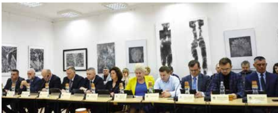
Radni obradowali w Centrum Edukacji i Kultury „Szklany Dom”.

Kolejna uchwała, nad którą pochylili się radni dotyczyła sprawy uchwalenia Roczno Programu Współpracy Gminy Masłów z Organizacjami Pozarządowymi oraz podmiotami określonymi w art. 3 ust. 3 ustawy o działalności pożytku publicznego