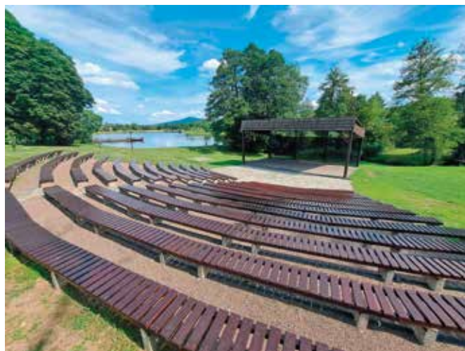
Ciągi komunikacyjne oraz ławki w amfiteatrze w Ciekotach zostały wymienione.

stałej w przestrzeni „Szklanego Domu”. Wartość całkowita projektu to blisko 820 tys. zł, a dofinansowanie blisko 500 tys. zł.