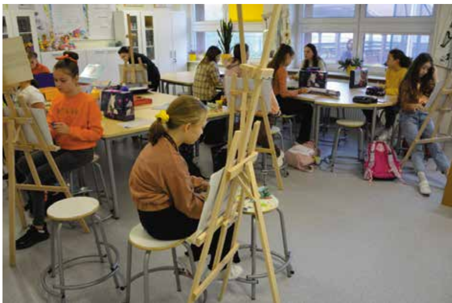
W takich warunkach można rozwijać swoje talenty.

Program „Laboratoria Przyszłości” finansowany jest ze środków przeznaczonych na przeciwdziałanie i zwalczanie COVID-19.