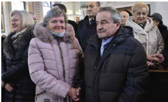
W kościele pary odnowiły przyrzeczenia małżeńskie.