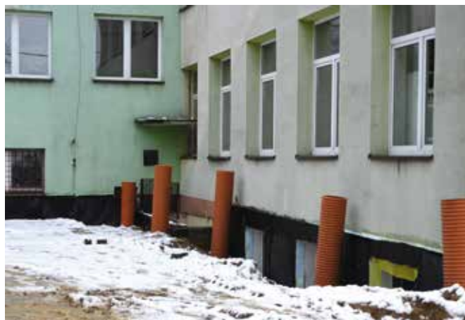
Wkrótce zakończą się prace polegające na odwodnieniu.

Wykonawcą zadania jest Konsorcjum w składzie: Firma Remontowo-Budowlana SELBUD z Warszawy i Firma Remontowa STENBUD ze Staszowa. Prace potrwają do lipca 2023 roku, a ich