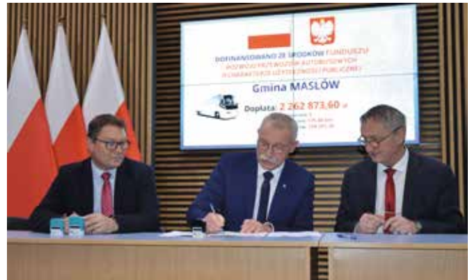
Dzięki umowie zawartej z wojewodą pięć linii busowych będzie nadal kursowało w gminie Masłów w 2023 roku.

- Coraz więcej samorządów korzysta ze środków Funduszu rozwoju przewozów autobusowych o charakterze użyteczności publicznej. Powstające nowe linie komunikacyjne mają zapew-