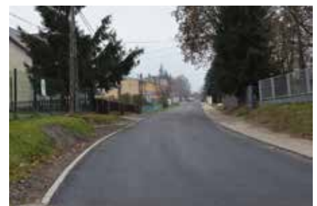
Dzięki zrealizowanej inwestycji ulica Szkolna zyskała odwodnienie i nową nawierzchnię asfaltową.