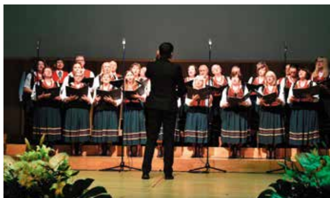
Podczas gali zaśpiewał Chór Masłowianie.