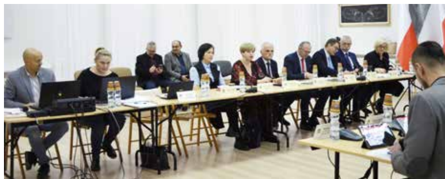
W czasie sesji przedstawiono m.in. najważniejsze informacje dotyczące dodatku węglowego.

i o wolontariacie na 2023 rok. Dokument określa cele, zakres i formy współpracy. Program ma stawiać na partnerską współpracę, ale również stworzyć dla mieszkańców gminy Masłów szansę poszerzenia aktywności społecznej. Zlecenie zadań może odbywać się w formie dofinansowania części zadania lub finansowania go w całości. Istotne jest to, że uchwała została poddana konsultacjom. Wysokość nakładów na 2023 r. wyniesie 184 tys. zł.