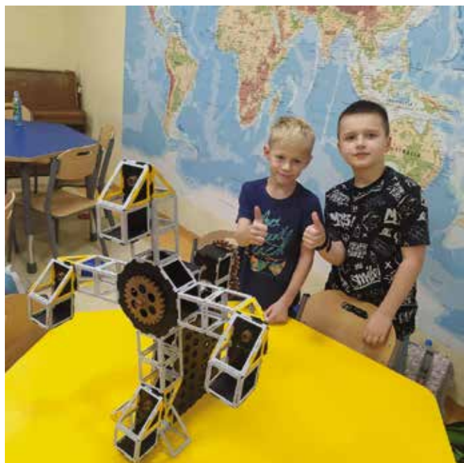
Takie roboty to nie lada konstrukcja!

- Podręcznik, zeszyt i długopis - to za mało. By kształcenie było efektywne, potrzeba też nowoczesnego sprzętu, uruchamiającego wyobraźnię dziecka. Zakupione pomoce z projektu „Laboratoria Przyszłości” pozwalają na bardziej praktyczną formę zajęć,