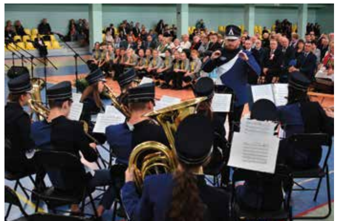
Młodzieżowa Orkiestra Dęta.