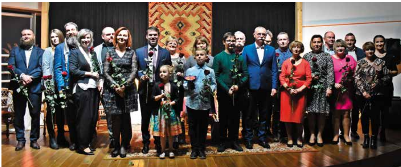
Ekipa „Antka” w komplecie pojawiła się w „Szklanym Domu”.

Za nami uroczysta premiera filmu krótkometrażowego „Antek” wg. noweli Bolesława Prusa wyprodukowanego przez Brzezinianki. Publiczność, która wypełniła salę widowiskową „Szklanego Domu” do ostatniego miejsca uczestniczyła w wyjątkowej projekcji i nagrodziła autorów filmu ogromnymi brawami. W internecie „Antek” został obejrzany już ponad dwa tysiące razy!