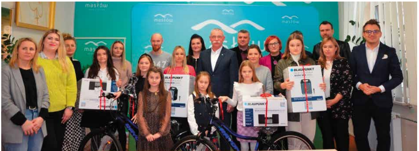
Laureaci konkursu z rodzicami, nauczycielami i organizatorami konkursu.

Rowery, music boxy i mikrowieże bluetooth trafiły do laureatów konkursu plastycznego „Rok bez smogu w Górach Świętokrzyskich” organizowanego przez Związek Gmin Gór Świętokrzyskich. Nagrody wręczono podczas uroczystego podsumowania konkursu w sali samorządowej Urzędu Gminy Masłów.