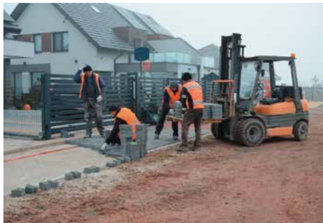
Prace rozpoczęły się w połowie listopada.

To kolejna inwestycja drogowa w bieżącym roku w gminie Masłów, która jest realizowana z udziałem środków zewnętrznych. Warto przypomnieć, że dzięki dofinansowaniu z Rządowego Funduszu Rozwoju Dróg udało się przebudować ulicę Letniskową