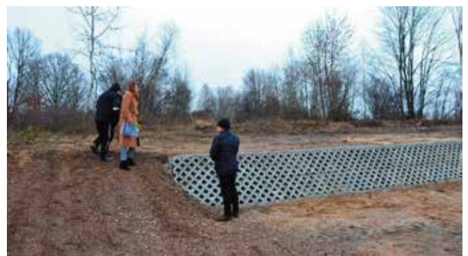
Inicjatorami zadania są mieszkańcy Mąchocic Kapitulnych, którzy środki funduszy sołeckich na lata 2022 i 2023 w pełni przeznaczyli na budowę placu.