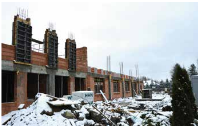
Zgodnie z projektem w nowym budynku powstanie sala sportowa o płycie boiska 20 x 30 m.

z ul. Cichej, Masłowie Drugim na ul. Panoramicznej, Mąchocicach-Scholasterii w kierunku posesji 71 i w Wiśniówce – Starodrożu. Obok znaczących inwestycji gmina prowadzi równolegle mniejsze we wszystkich 12 sołectwach m.in. budowę boiska do piłki plażowej w Wiśniówce, siłowni zewnętrznej w Ciekotach, dowieszenie i budowa nowych linii oświetlenia, czy odwodnienia w Dąbrowie i Dolinie Marczakowej.