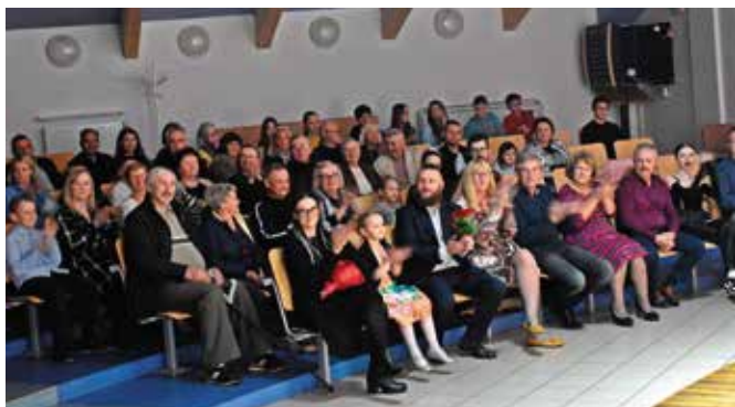
Premierę obejrzał komplet widzów.