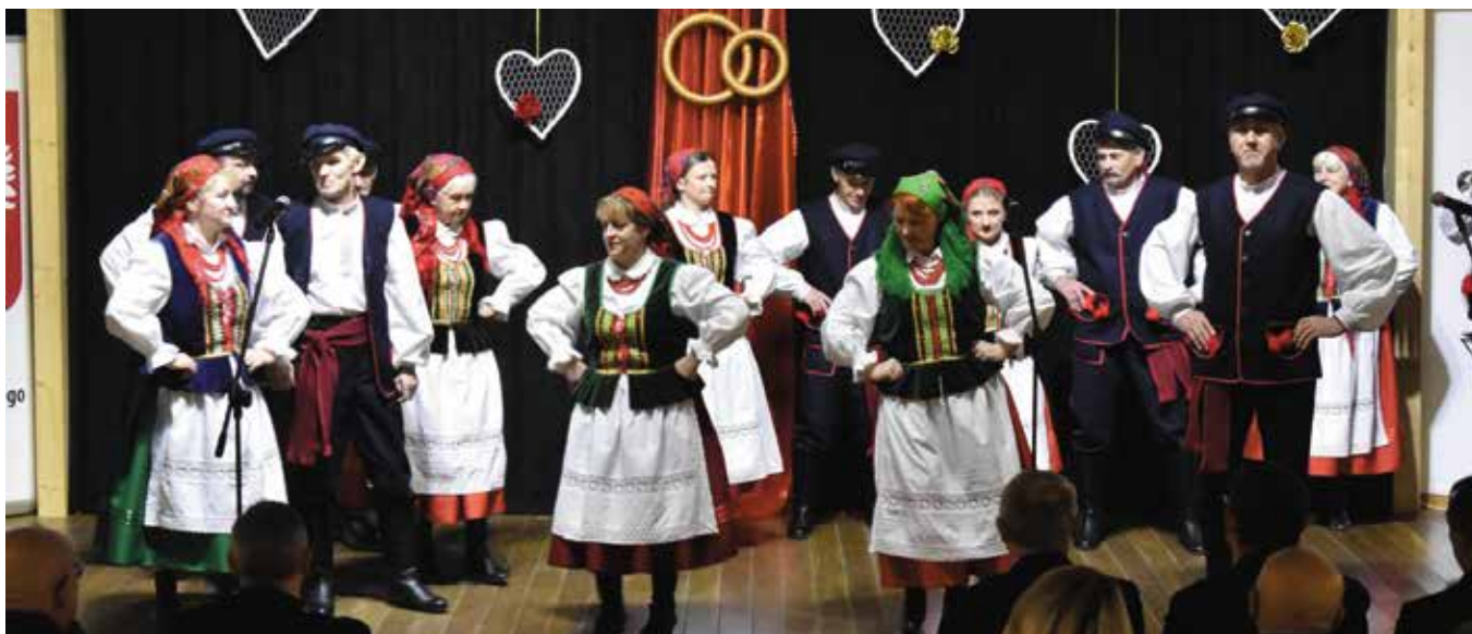
Dla wszystkich wystąpił Zespół Pieśni i Tańca Ciekoty.