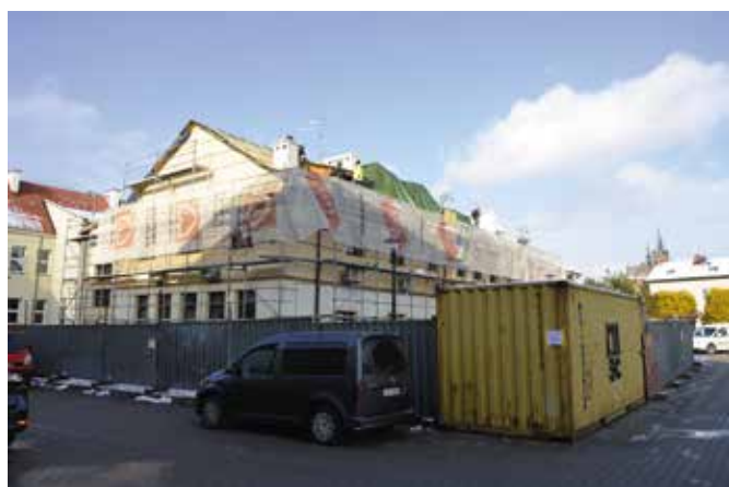
Termomodernizacje urzędu oraz szkoły są realizowane dzięki niemal 3 mln dofinansowaniu.

W trosce o środowisko naturalne kilka tygodni temu ruszyła termomodernizacja dwóch ważnych budynków: szkoły w Mąchocicach Kapitulnych oraz Urzędu Gminy Masłów. W ramach prac zostaną zamontowane odnawialne źródła energii, zmodernizowane źródła ciepła. Wszystko to w celu uzyskania oszczędności w zużyciu energii oraz obniżenia kosztów eksploatacji. Termomodernizacje realizowane są dzięki dofinansowaniu w wysokości niemal 3 mln zł z Regionalnego Programu Operacyjnego Województwa Świętokrzyskiego na lata 2014-2020.