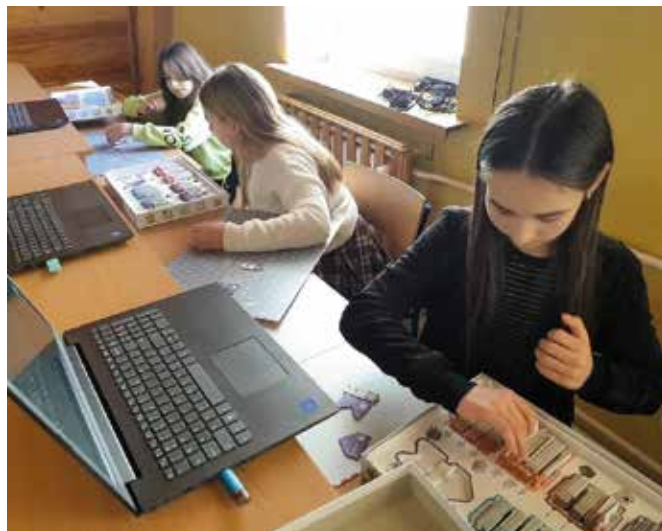
Nowy sprzęt daje nowe możliwości.