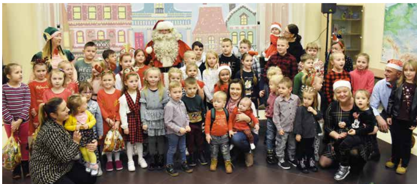
W Dolinie Marczakowej z Mikołajem spotkało się blisko 70 dzieciaków.

Sezon świąteczny otwarto w gminie Masłów mikołajkowymi spotkaniami. Odbyły się one w Gminnej Bibliotece Publicznej w Masłowie oraz świetlicy samorządowej w Dolinie Marczakowej.