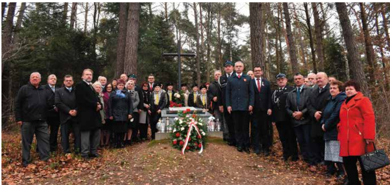
Przed pomnikiem na Białej Górze.