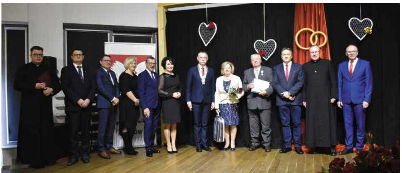
Uroczysta dekoracja medalami odbyła się w „Szklanym Domu”.

Z wielkim szacunkiem o jubilatach wypowiadali się również goście. - To jest ogromne wydarzenie. Życzę wam, żebyście