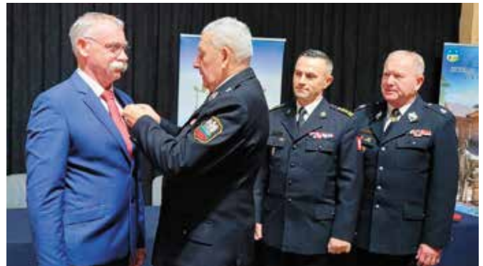
Medal przyznawany jest osobom szczególnie zasłużonym dla rozwoju pożarnictwa.

W czasie spotkania komendanci omawiali najważniejsze tematy dotyczące m.in. stanu ochrony przeciwpożarowej w województwie, zabezpieczenia logistycznego działalności OSP, wy-