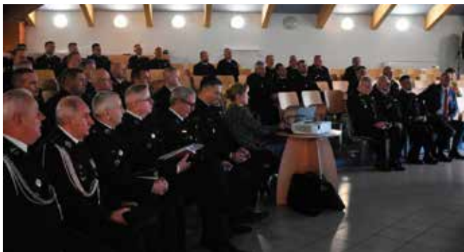
Do Ciekot zjechali strażacy z całego regionu.