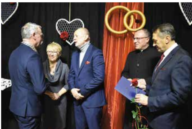
Nie zabrakło serdecznych życzeń i prezentów.