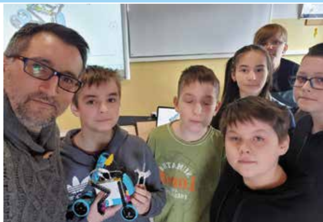
Szkoła Podstawowa w Mącholicach-Scholasterii