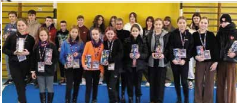
Wolontariusze ze Szkoły w Mąchocicach Kapitulnych