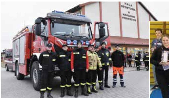
Jak co roku byli z nami druhowie strażacy.