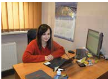
Punkt nieodpłatnej pomocy prawnej mieści się w GOPS Masłów.