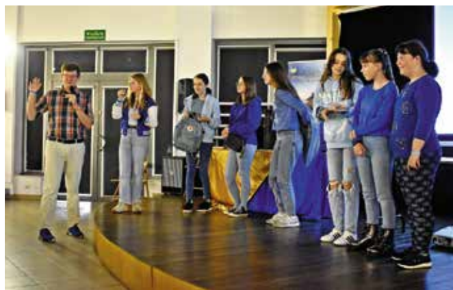
Młodzież z gminy Masłów wzięła udział w spotkaniu „Archipelag skarbów”.

W ubiegłym roku w szkołach na terenie gminy Masłów przeprowadzone zostało aż 254 godziny zajęć profilaktycznych z zakresu przeciwdziałania narkomanii i alkoholizmowi. Ponadto uczniowie ze szkoły w Mąchocicach-Scholasterii wzięli udział w warsztatach profilaktycznych dotyczących promocji zdrowia psychicznego i radzenia sobie z depresją. Zorganizowano również wyjazdy na basen, trampoliny, do kina, teatru i bawialni, wskazujące właściwy sposób spędzenia wolnego czasu. W ramach działań profilaktycznych wszyscy ósmoklasiści z terenu gminy Masłów przez dwa dni uczestniczyli w ciekawych warsztatach pn. „Archipelag Skarbów”, a dzieci z klas „0” i I obejrzały spektakl teatralny „Świąteczny cud”. GKRPAiN organizuje konkursy profilaktyczne,