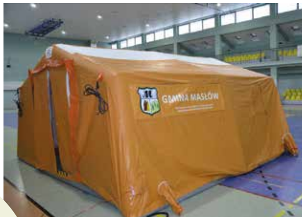
Zakup był współfinansowany ze środków Funduszu Sprawiedliwości, którego dysponentem jest Minister Sprawiedliwości.

Namioty pneumatyczne znajdują szerokie zastosowanie wśród służb ratowniczych, jako namioty zabezpieczenia medycznego, namioty kwatermistrzowskie, do wódczo-sztabowe lub sypialne. Mogą również stanowić część składową mobilnych systemów dekontaminacyjnych, modułów szpitali polowych oraz miejsc kwarantanny.