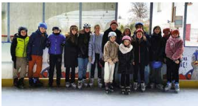
Szkoła Podstawowa w Masławie

Ferie zimowe i czas wypoczynku za nami. Najmłodszy mieszkańcy gminy Masłów mieli możliwość skorzystania z bogatej oferty zajęć i wycieczek, którą przygotowały dla nich szkoły, Centrum Edukacji i Kultury „Szklany Dom” oraz świetlice w: Barczy, Ciekotach, Dąbrowie, Dolinie Marczakowej i Wiśniówce, Gminna Biblioteka Publiczna w Masławie oraz filie w Mącholicach Kapitulnych i Wiśniówce oraz Placówka Wsparcia Dziennego „Promyczek”.