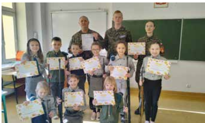
Szkoła Podstawowa w Woli Kopcowej