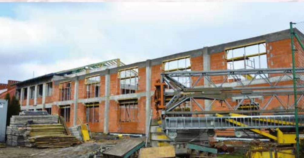
Postępują prace w Woli Kopcowej str. 2