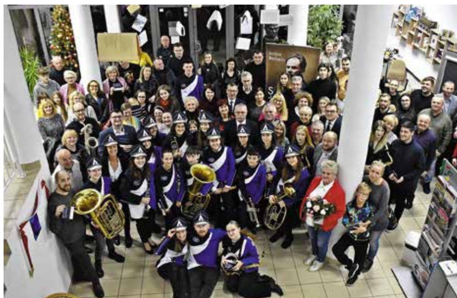
Pamiątkowe zdjęcie uczestników jubileuszu.

wspólnego działania. Cieszę się, że młodzi muzycy uczestniczą w życiu naszej społeczności podczas ważnych wydarzeń na terenie gminy Masłów, ale też są zapraszani na gościnne występy – mówi wójt Tomasz Lato.