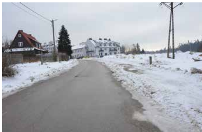
Do końca tego roku metamorfozę przejdzie droga wewnętrzna w Wiśniówce.

60% pokryje rządowe dofinansowanie, a po 20% środki powiatu i gminy.