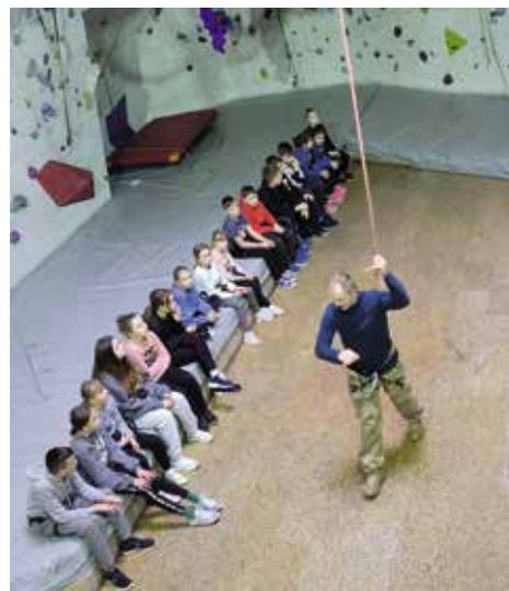
Szkoła Podstawowa w Mącholicach Kapitulnych