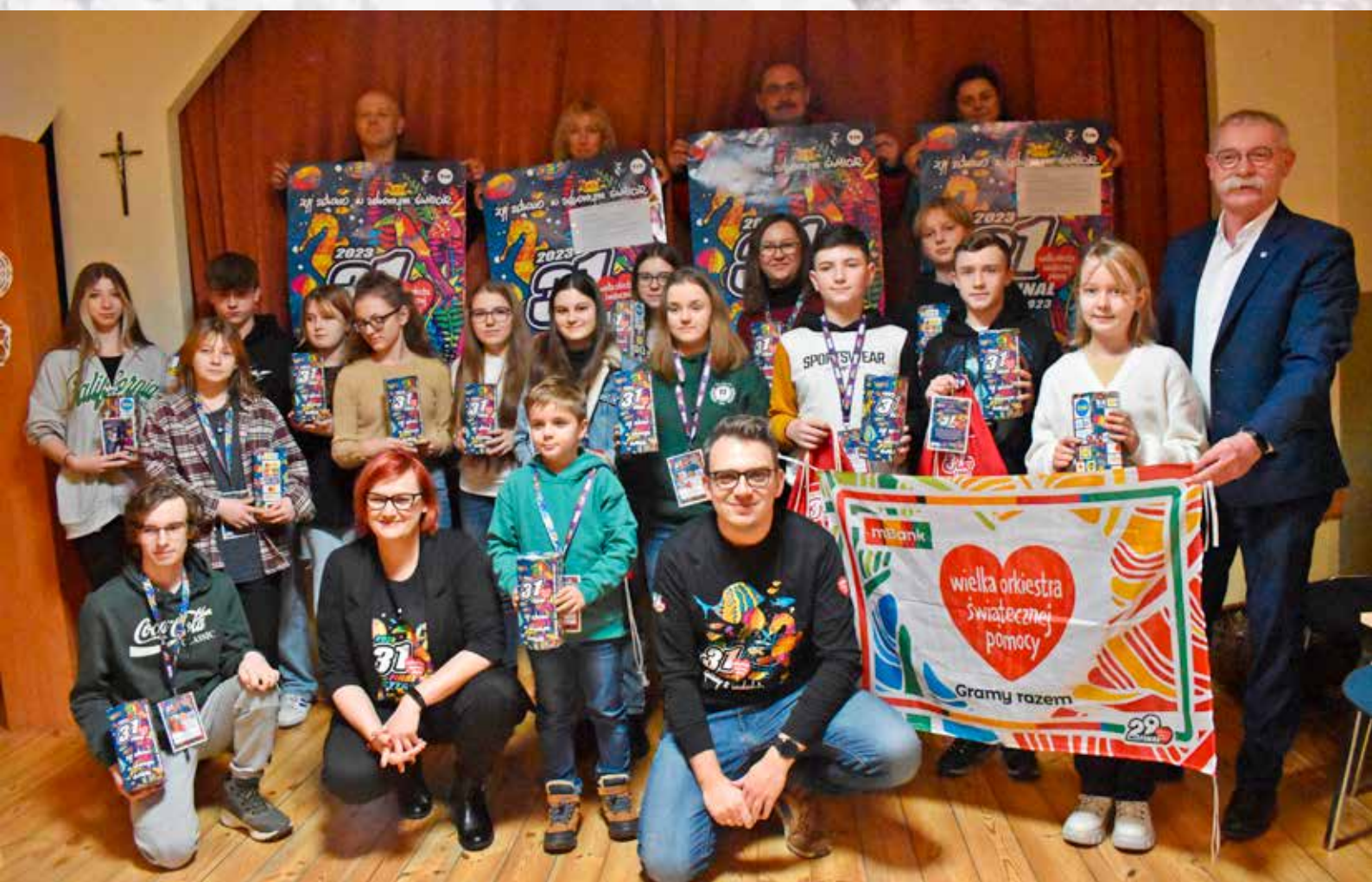
Ponad 40 tys. zł dla WOŚP! Dziękujemy! str. 26-27