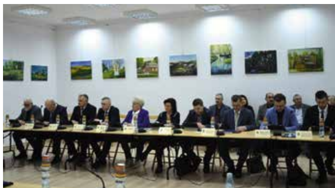
Radni przyjęli budżet na 2023 rok.

Pierwsza z bloku uchwał dotyczyła zmiany uchwały budżetowej. Wynika to z konieczności przeniesienia części planowanych wydatków z 2022 roku na 2023 rok i wprowadzenia ich do przyszłorocznego budżetu. W związku z tym, że konieczne było zmniejszenie planu wydatków. W wyniku zmian w budżecie zmniejszono planowany deficyt budżetu i przychody budżetu pochodzące z wolnych środków. Wynikiem tej uchwały było przyjęcie zmiany Wieloletniej Prognozy Finansowej Gminy Masłów na lata 2022 – 2029.