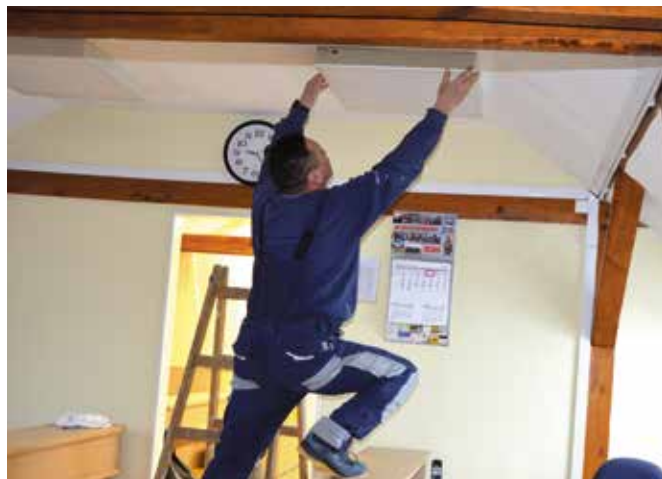
Oprawy energooszczędne pojawiły się również w budynku urzędu gminy.

Warto wspomnieć, że równoległe prace termomodernizacyjne toczą się w budynku Szkoły Podstawowej w Mącholicach Kapitulnych, gdzie właśnie dobiegły końca prace przy modernizacji oświetlenia. - Prace prowadzone są w trakcie roku szkolnego również wewnątrz budynku, dlatego wykonawca zintensyfikował je w trakcie ferii. Wykonano już odwodnienie budynku i ocieplenie