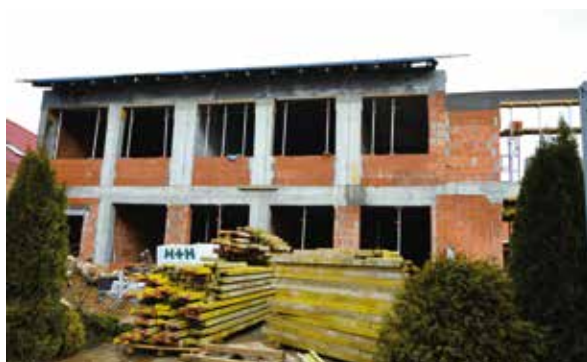
Sala gimnastyczna przy Szkole Podstawowej im. Janusza Korczaka w Woli Kopcowej powstanie do końca 2023 roku.

będą kolejne dwie sale lekcyjne oraz sala rekreacyjno-sportowa z wykładziną sportową przystosowaną do zajęć korekcyjnych i fitness itp. Całość uzupełnią dwie łazienki ogólnodostępne oraz widownia umożliwiająca obserwację zajęć w sali gimnastycznej.