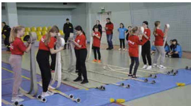
Jedną z konkurencji było zwijanie węży.

Najlepszą drużyną okazała się Młodzieżowa Drużyna Pożarnicza z Brzezinek, tuż za nimi uplasowała się jedna z drużyn z Woli