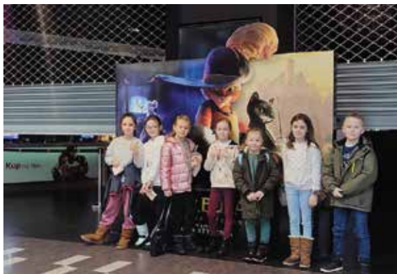
Placówka Wsparcia Dziennego „Promyczek”

Ferie zimowe i czas wypoczynku za nami. Najmłodszy mieszkańcy gminy Masłów mieli możliwość skorzystania z bogatej oferty zajęć i wycieczek, którą przygotowały dla nich szkoły, Centrum Edukacji i Kultury „Szklany Dom” oraz świetlice w: Barczy, Ciekotach, Dąbrowie, Dolinie Marczakowej i Wiśniówce, Gminna Biblioteka Publiczna w Masławie oraz filie w Mącholicach Kapitulnych i Wiśniówce oraz Placówka Wsparcia Dziennego „Promyczek”.