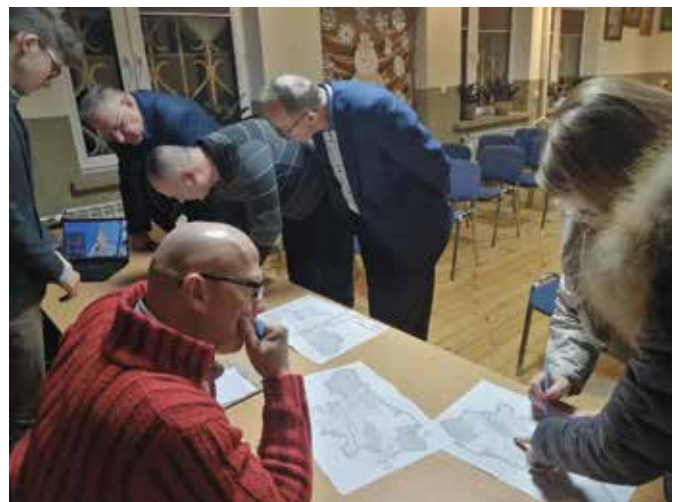
Na spotkaniu, które odbyło się w formie warsztatów, każdy z uczestników mógł wyrazić zdanie na temat przyszłości transportu w okolicy.

Na spotkaniu, które odbyło się w formie warsztatów, każdy z uczestników wyraził swoje zdanie na temat szeroko pojętej mobilności oraz mógł zgłosić uwagi dotyczące problemów transportowych na terenie gminy.