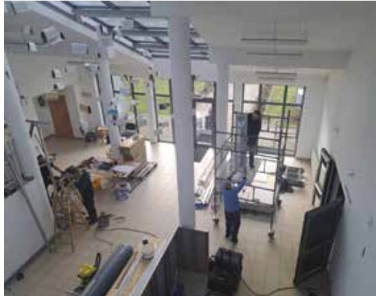
Dzięki pracom remontowym metamorfozę przejdzie również hol „Szklanego Domu”.

W przestrzeni placówki powstaje wystawa z wykorzystaniem nowoczesnych systemów wystawieniowych poświęcona m.in. Stefanowi Żeromskiemu i Barbarze Wachowicz. Tworzyć ją będą m.in. panele dotykowe czy wielka księga sterowana gestem. Każdy z odwiedzających będzie mógł poznać najciekawsze fakty z życia pisarzy i ich związki z Ciekotami. Przeglądając ją znajdziemy również informacje dotyczące atrakcji turystycznych gminy Masłów. W „Szklanym Domu” trwają prace przy gruntownym przearanżowaniu przestrzeni holu, przebudowie kasy i Punktu Informacji Turystycznej. Niepowtarzalną atrakcją będzie siedmiometrowa