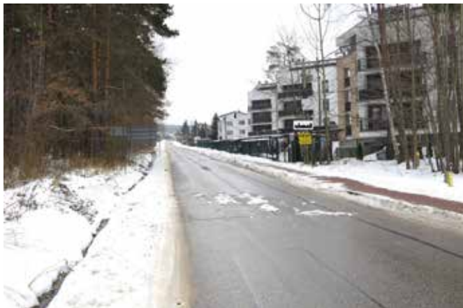
Prace ruszą również w Dąbrowie i Maśłowie Drugim.

W lipcu tego roku rozpocznie się przebudowa drogi powiatowej nr 1302T w miejscowościach Maśłów Drugi i Dąbrowa. Na długości ponad 1,8 km od skrzyżowania ulicy Diamentowej z drogą krajową S73 do ulicy Krajobrazowej droga zyska nową podbudowę, nakładkę asfaltową szerokości 5,5 m, jednostronny chodnik szerokości 2 m oraz rów odwadniający umocniony płytami ażurowymi. Tu koszt zadania oszacowano na 11,5 mln zł z czego