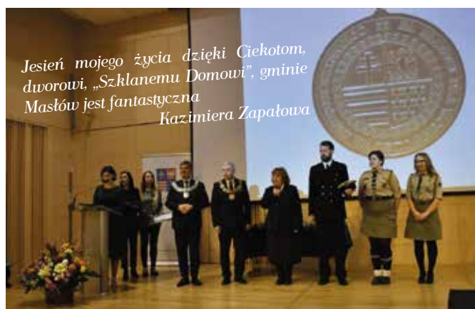
Uroczystość odbyła się w Filharmonii Świętokrzyskiej.