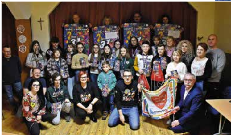
Ekipa wolontariuszy wraz z rodzicami pracowała nad świetnym wynikiem zbiórki!