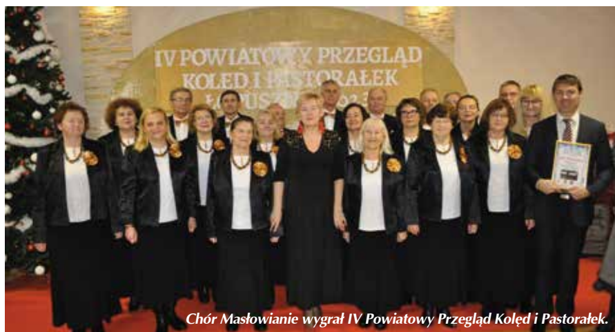
Chór Masłowianie wygrał IV Powiatowy Przegląd Kolęd i Pastoralek.