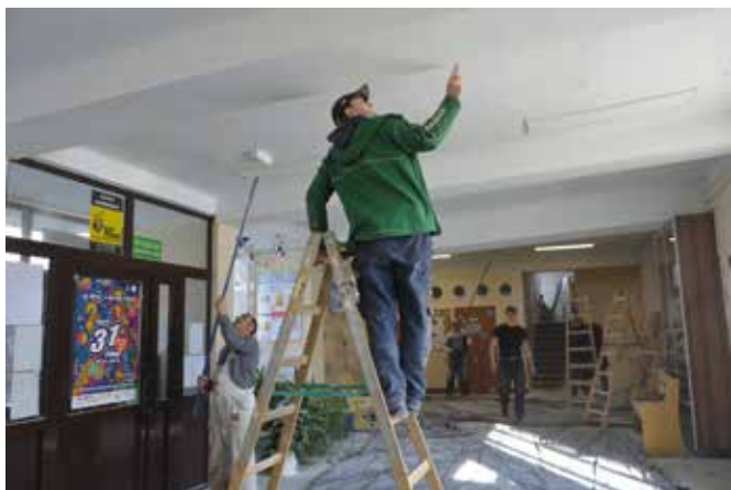
Oprawy LED-owe w szkole już zostały zamontowane, teraz trwają prace odtworzeniowe.