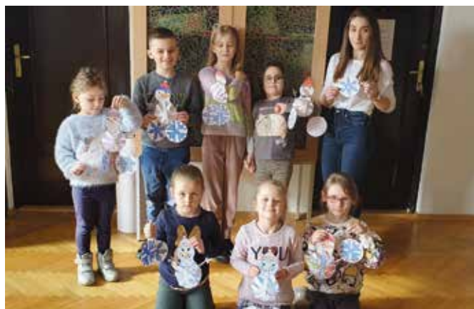
Biblioteka w Masławie