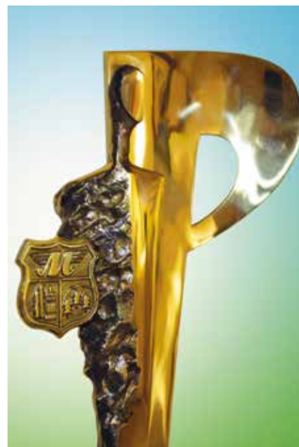
Nagroda jest okazją do nagrodzenia i wyróżnienia przedsiębiorców z gminy Masłów.

Zgłoszenia kandydatów należy dostarczyć pocztą lub osobiście do sekretariatu Urzędu Gminy Masłów do końca kwietnia. Wszystkie niezbędne informacje, regulamin i formularze można znaleźć na stronie internetowej Gminy Masłów lub odebrać osobiście w sekretariacie Urzędu Gminy. Wszystkie pytania związane z konkursem należy kierować, pod numer telefonu Urzędu Gminy Masłów 41 311 00 73.