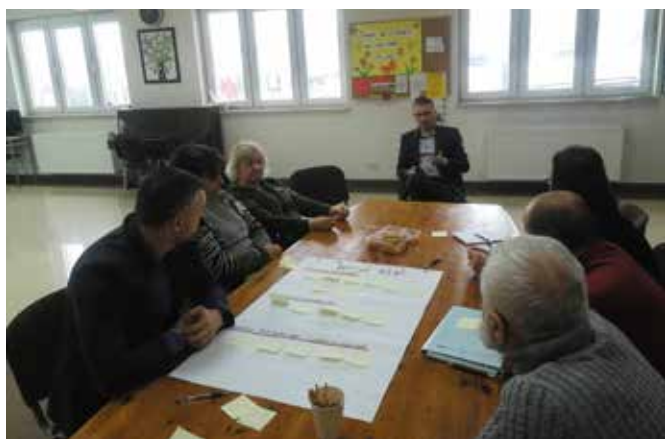
Spotkanie poświęcone było budowie wspólnej wizji oraz kierunkom rozwoju Kieleckiego Obszaru Funkcjonalnego.

Warsztaty odbyły się z udziałem przedstawicieli wszystkich gmin tworzących Kielecki Obszar Funkcjonalny tj. Chęciny, Chmielnik, Daleszyce, Górnio, Masłów, Miedziana Góra, Morawica, Nowiny, Piekoszków, Pierzchnica, Strawczyn i Zagnańsk oraz miasta Kielce.