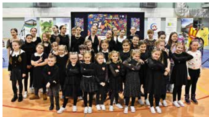
Wednesday dance był hitem koncertu.