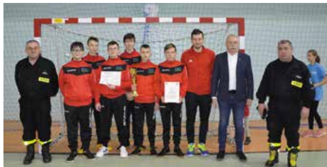
Najlepsza była drużyna z Brzezinek.