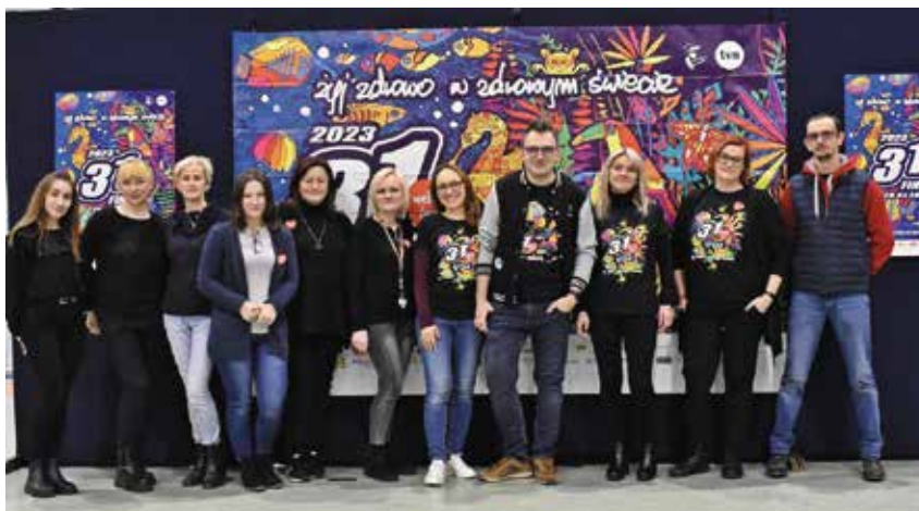
To oni pracowali nad sprawną organizacją i zbiórką podczas 31. Finału.