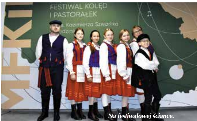
Na festiwalowej scenie.