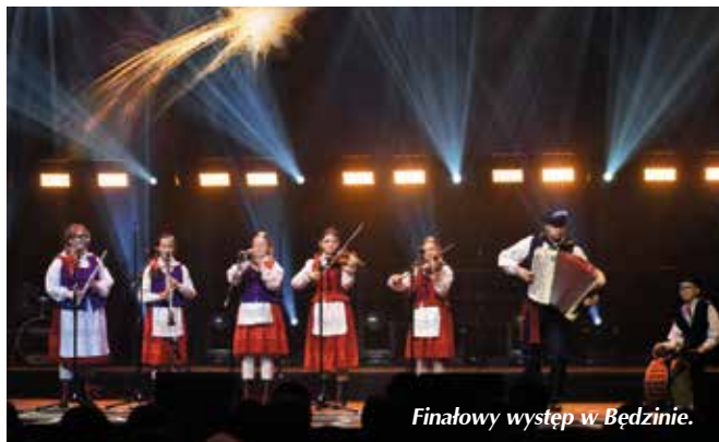
Finałowy występ w Będzinie.