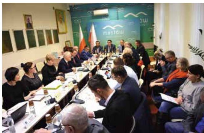
Obrady odbyły się w sali samorządowej w Urzędzie Gminy w Masłowie.

szu Solidarnościowego. Oznacza to, że projekt skierowany do osób z niepełnosprawnościami, będzie realizowany na terenie gminy Masłów od stycznia do grudnia 2023 r. Projektem zostaną objęte 104 osoby, którym zostaną przyznane usługi asystentki. Całkowita wartość programu wynosi nieco ponad 2 mln zł. W kolejnym punkcie zmieniono uchwałę Nr LII/542/2022 Rady Gminy Masłów z dnia 22 grudnia 2022 roku w sprawie udzielenia pomocy finansowej dla Gminy Górno. Zmiana dotyczyła doprecyzowania roku 2023 r., w którym zostanie udzielona pomoc.