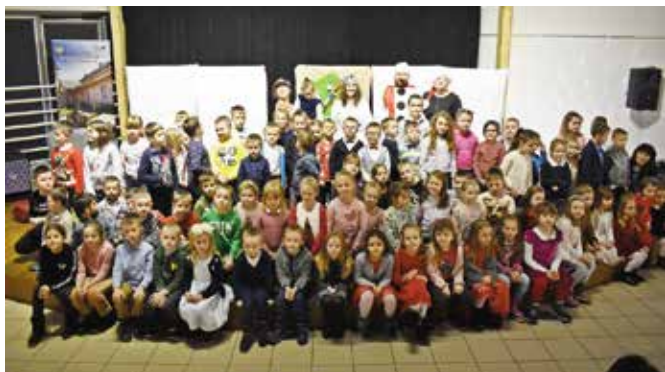
Po spektaklu każdy miał szansę na zdjęcie z aktorami.

Na scenie „Szklanego Domu” aktorzy z Krakowskiego Biura Promocji Kultury zaprezentowali spektakl „Świąteczny cud”. Już od pierwszych minut dzieci żywo reagowały na akcję przedstawienia i chętnie angażowały się w jego interaktywny charakter. Dzieciaki miały szansę na zaprezentowanie się na scenie u boku aktorów. Była to dla nich nie lada atrakcja, ale też pierwsza szansa występu na profesjonalnej scenie.