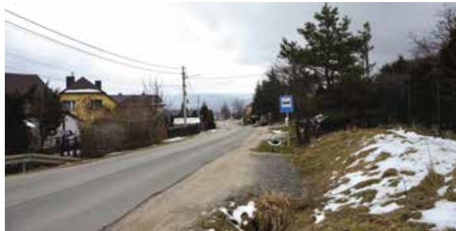
Powstanie projekt budowlany chodnika, wiodącego od Masłowa Drugiego, przez Brzezinki aż do Ciekot.

- Planowo projekt będzie zakładał budowę chodnika z kostki brukowej o szerokości 2 m. W miejscach, w których nie będzie możliwe wygospodarowanie takiego terenu ze względu na własność gruntów, będziemy planować inne bezpieczne rozwiązania