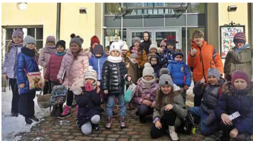
Centrum Edukacji i Kultury „Szklany Dom” i świetlice