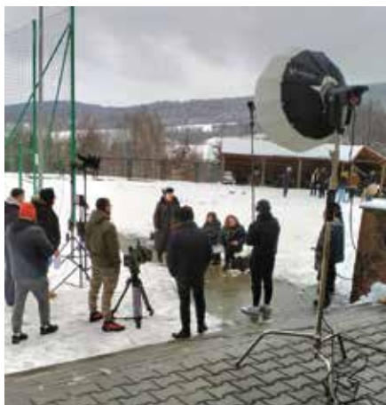
Zdjęcia kręcono również przed szkołą.