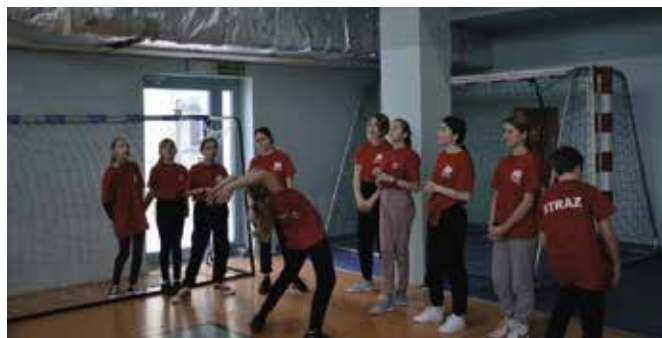
Rzut piłką lekarską wymagał sprytu i uwagi.