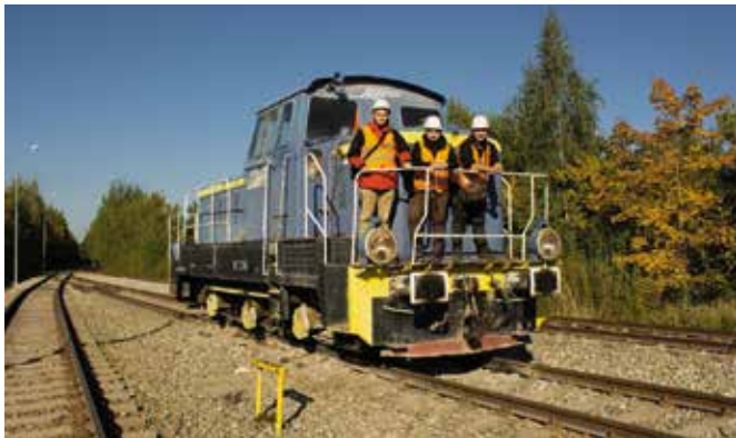
Na terenie kopalni można zobaczyć lokomotywę Fablok 401Da z 1975 roku.

Co istotne, wiek odwiedzających nie ma tu najmniejszego znaczenia! W ramach zajęć wakacyjnych kopalnię Wiśniówka zwiedzały dzieci ze świetlicy w Dolinie Marczakowej. To była dla nich prawdziwa wyprawa pełna przygód! Kaski na głowie tak duże, że trzeba je było wiązać na kokardkę, kamizelki sięgające kolan... to była niewątpliwie dodatkowa atrakcja dla małych uczestników wycieczki. Kierownik kopalni oprowadził grupę po wyrobisku i opowiedział o ciekawostkach skrywających się na dnie dawnego morza oraz o specyfice pracy w kopalni.