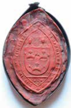
Pieczęć Kapituły z 1625 r