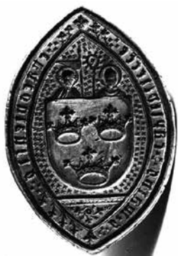
Srebrny tlok pieczęci Kapituły