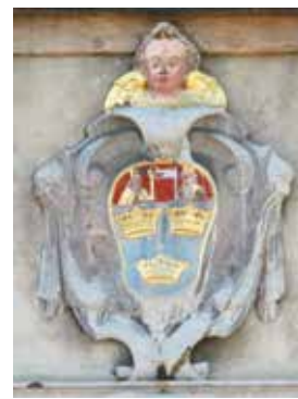
Herb Trzy Korony Kapituły na Pałacu Biskupów Krakowskich

świadczyć fakt, że jego wyobrażenie ikonograficzne zostało wykorzystane przy tworzeniu projektów herbu dla gminy Masłów.